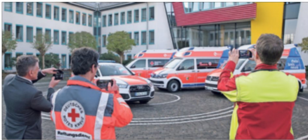
Drei neue Krankentransportwagen sowie ein Notarzt-Fahrzeug hat jetzt der Rhein-Kreis Neuss als Träger des Rettungsdienstes im Kreisgebiet an die Einsatzkräfte von drei Hilfsorganisationen übergeben.

Grevenbroich. Drei neue Krankentransportwagen hat jetzt der Rhein-Kreis als Träger des Rettungsdienstes im Kreisgebiet an die Einsatzkräfte von drei Hilfsorganisationen übergeben. In Zukunft sind die Helfer des Deutschen Roten Kreuzes in Grevenbroich und Korschenbroich sowie der Johanniter-Unfall-Hilfe in Meerbusch mit diesen Fahrzeugen im Einsatz.