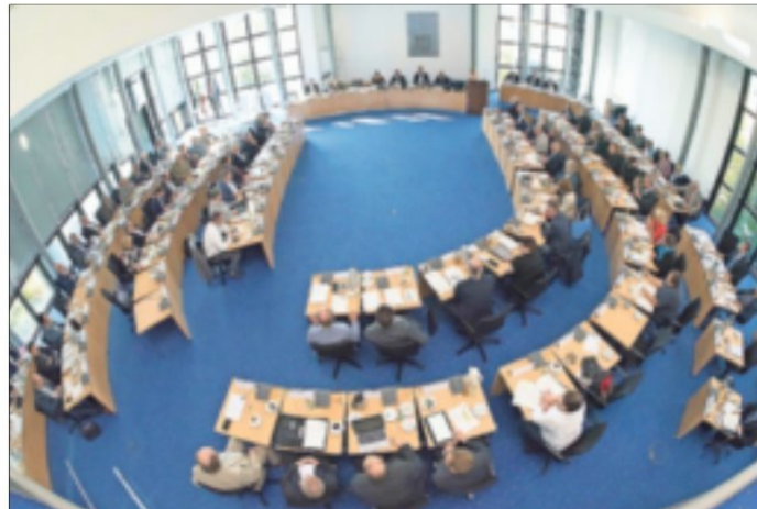
Der Kreistag hat mit breiter Mehrheit ein Strategiepapier zur Gestaltung von Strukturwandel, Klimaschutz und Nachhaltigkeit verabschiedet.

Für die Umsetzung der Handlungsfelder Strukturwandel, Klimaschutz und Klimawandelvorsorge hat der Rhein-Kreis bereits eine Million Euro im Kreishaushalt veranschlagt. Außerdem werden vom Kreis Fördermittel akquiriert und die dafür nötigen Komplementärmaßnahmen zur Verfügung gestellt. Das Strategiepapier soll zukünftig regelmäßig fortgeschrieben werden. -ekG.