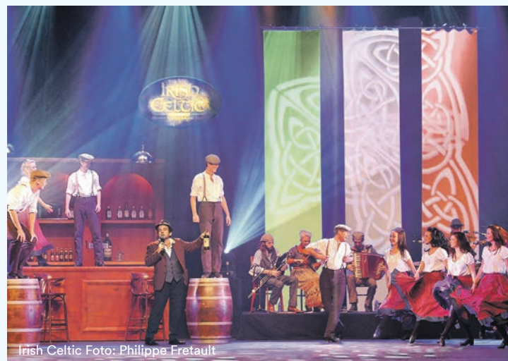
Irish Celtic

„Die Hoppeditz-Guerilla – Rosenmontag for Future“ Tickets unter www.stunk.net Club im Capitol Theater