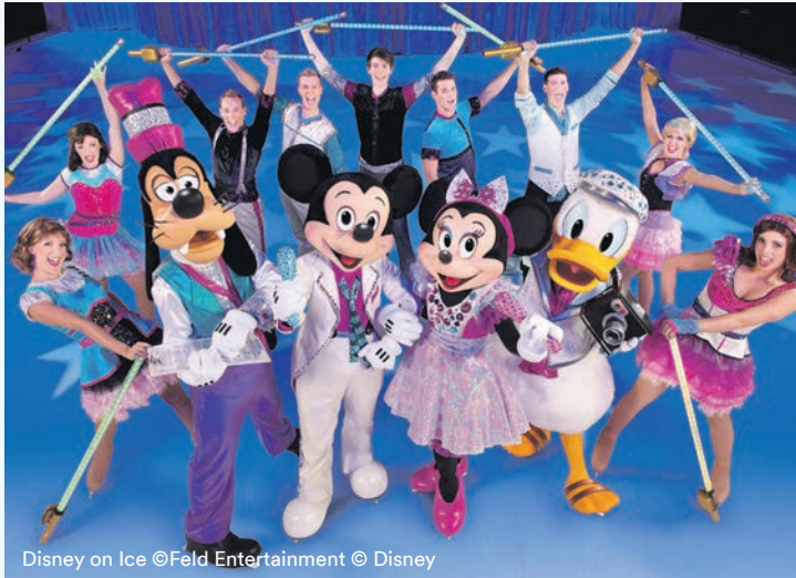
Disney on Ice © Feld Entertainment © Disney