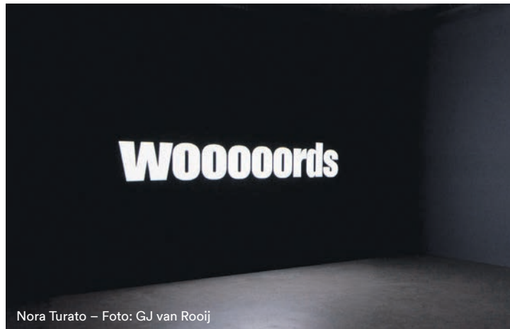
Nora Turato – Foto: GJ van Rooij

Good-Bye-Grabbeplatz Galerie Hans Mayer Grabbeplatz 2 T 13 21 35