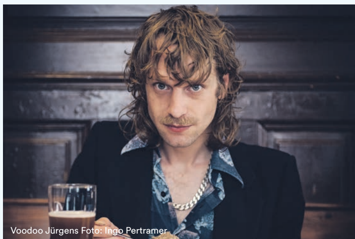
Voodoo Jürgens

„Lott jonn... – oder als das Würstchen Huppsi machte“ Kurhaus