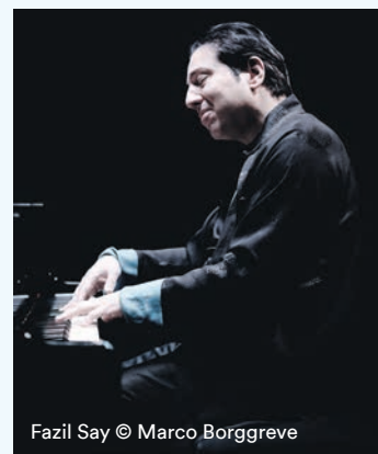
Fazil Say