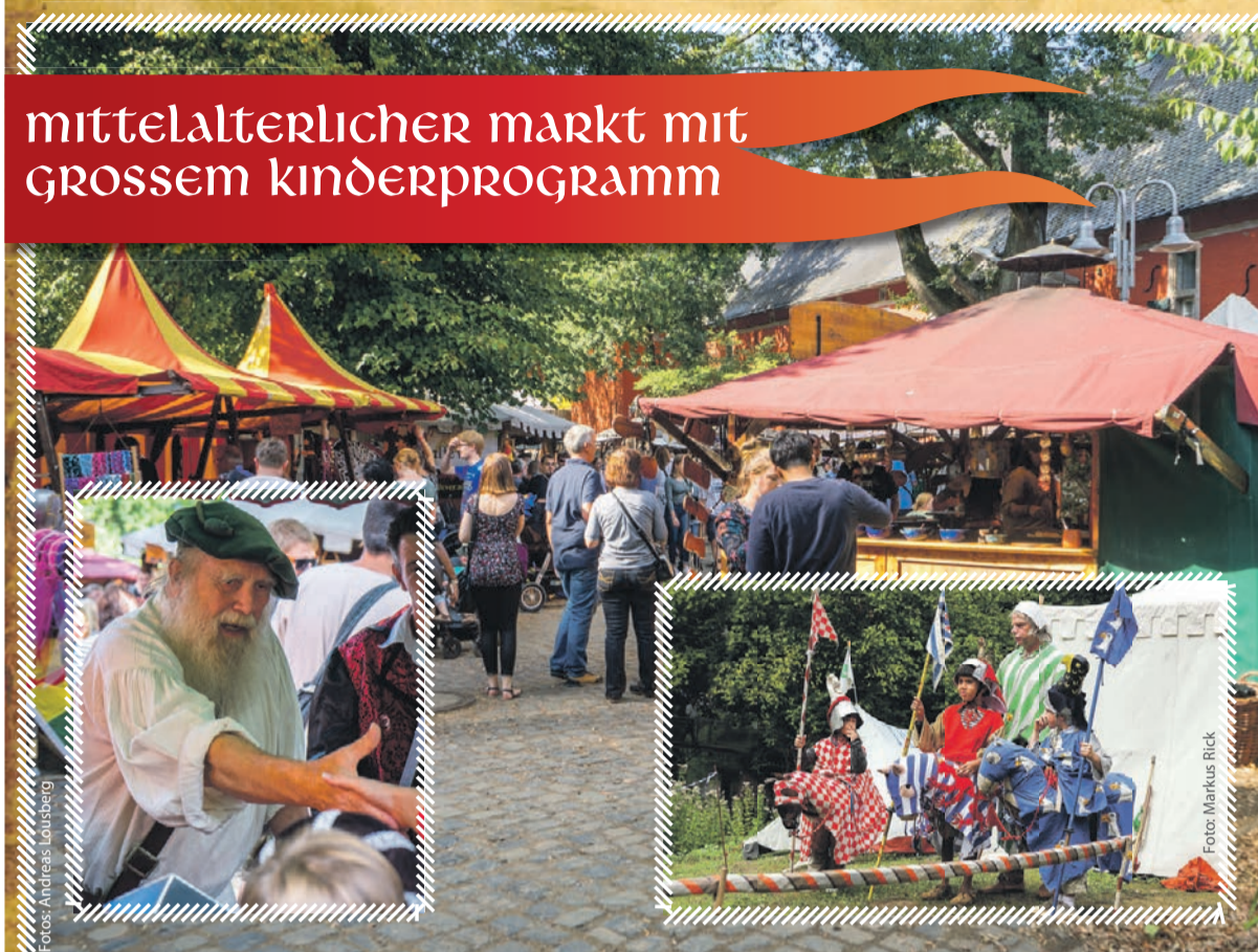
mittelalterlicher Markt mit grossem Kinderprogramm

Flanieren Sie über den mittelalterlichen Markt im wunderschönen Ambiente des Schloss Rheydt. Rund 70 Aussteller, Händler und Handwerker bieten ihr Können und Handelsgut feil. Genießen Sie das ritterliche Treiben bei Erzeugnissen mittelalterlicher Braukunst und vielen leckeren Schlemmereien. Auch die Kleinen können sich ins historische Vergnügen stürzen.