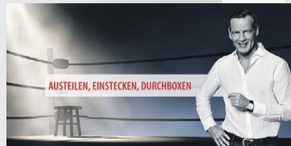
AUSTEILEN, EINSTECKEN, DURCHBOXEN