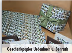
Geschenkpapier Urdenbach u. Benrath

und andere schöne Dinge, Geschenkideen und Präsente geht.