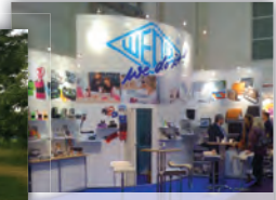
Messestände u. Grafiken