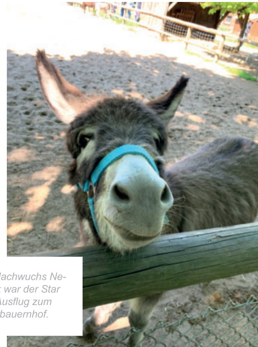
Esel-Nachwuchs Nepomuk war der Star beim Ausflug zum Kinderbauernhof.

gleitet „Aufwind“ derzeit 100 Familien. Im September 2019 soll eine weitere Elterngruppe und Kindergruppe starten, kündigt Dorothea Brilmayer an, Leiterin der EFB „balance“.