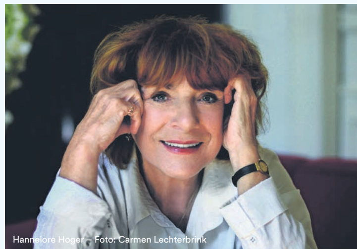
Hannelore Hoger