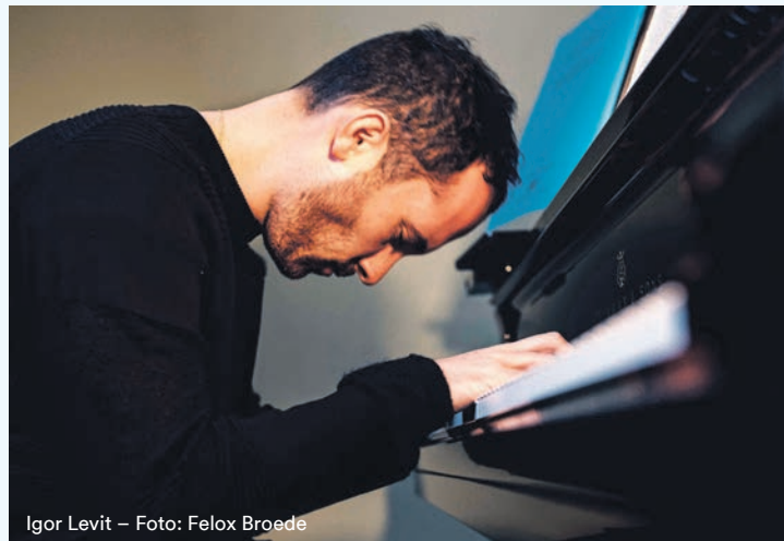
Igor Levit

Das aktuelle Apollo-Programm Roncalli's Apollo Varieté