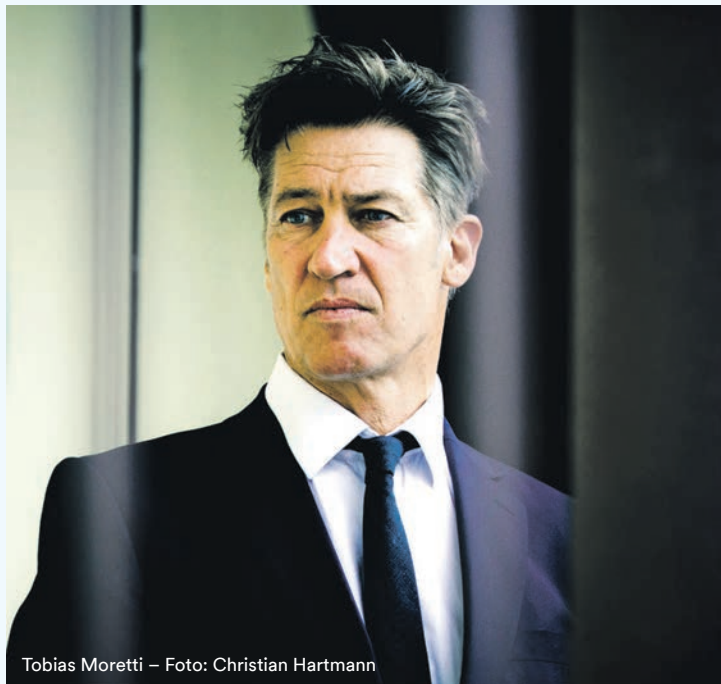
Tobias Moretti