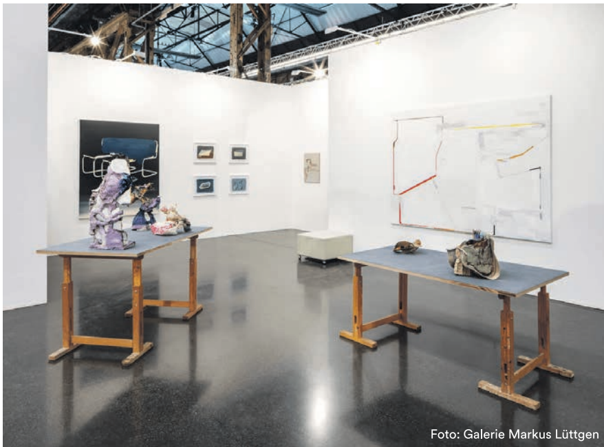
Viele renommierte Galerien stellen auf der Kunstmesse im Areal Böhler aus.