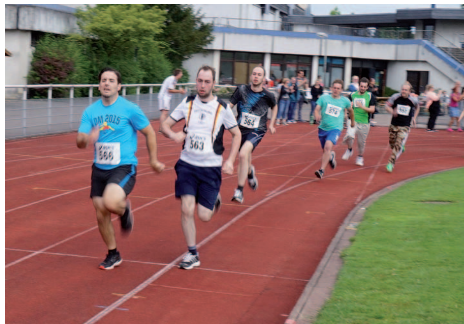
Beim 200-m-Lauf der Männer lagen die Sportler ohne Behinderung vorn.