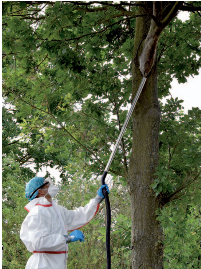
Die Absaugung erfolgt mittels Spezialgeräten. Anschließend wird abgeflämmt, um auch die letzten Härchen zu erwischen.