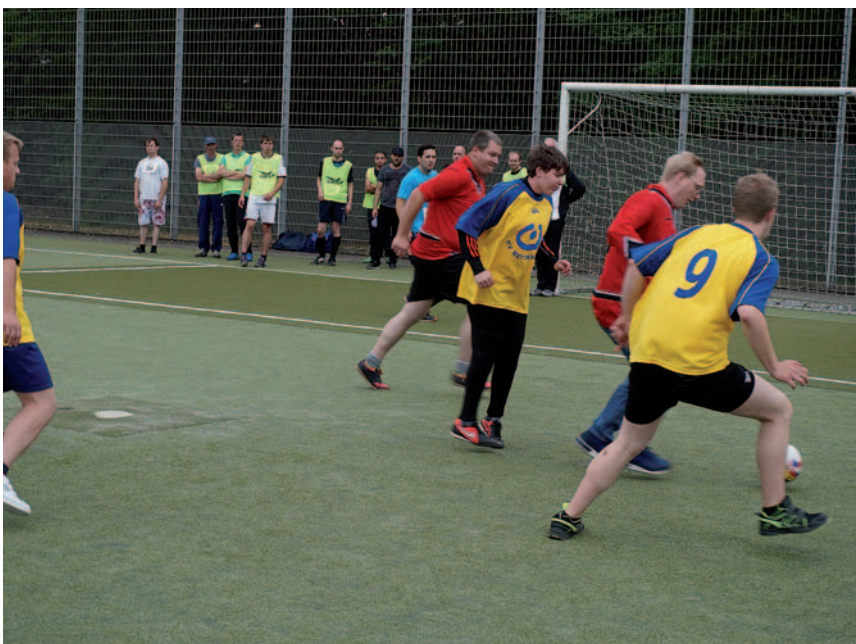
Die Kicker vom HPZ-Netz Ost und von der Lebenshilfe im Einsatz.