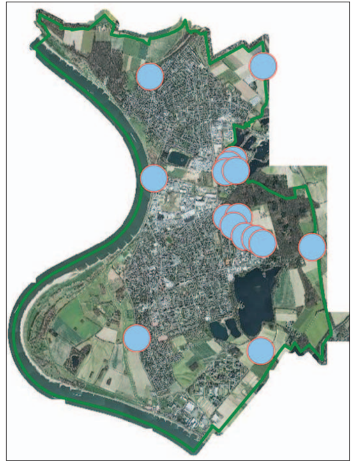
An diesen Stellen im Monheimer Stadtgebiet ist der Eichenprozessionsspinner in den letzten beiden Wochen bereits entdeckt worden. Auch in Leverkusen ist er bereits verstärkt aufgetaucht.

Eine klare Empfehlung zu Spaziergängen und anderen Besu-