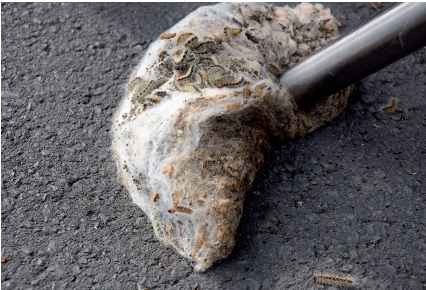
Ein bereits vom Baum abgesaugtes Nestgespinnst auf der Alfred-Nobel-Straße.