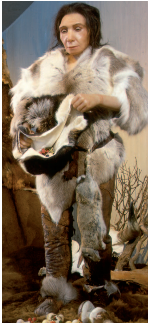
Damals wurde vieles gesammelt, um Krankheiten heilen zu können.

Das Verfahren gilt als ungewöhnlich. Kratzte man doch am Zahnbelag der in einer spanischen Höhle gefundenen Neandertaler, um dort auf die DNA ebenjener Pappel zu stoßen. Und die wiederum enthielt Acetylsalicylsäure, besser bekannt als „Aspirin“. Damit aber war's noch längst nicht genug. Einer der Herren aus der spanischen Höhle litt offenbar unter Durchfall und hatte nachweislich auf einem antibiotisch wirksamen Schimmelpilz herumgekaut. Ebenfalls im Zahnbelag nachgewiesen: Penicillin.