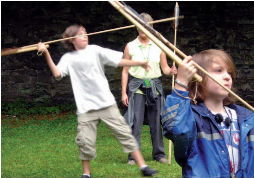
Im Neanderthal Museum steigt das Sommerferienprogramm.