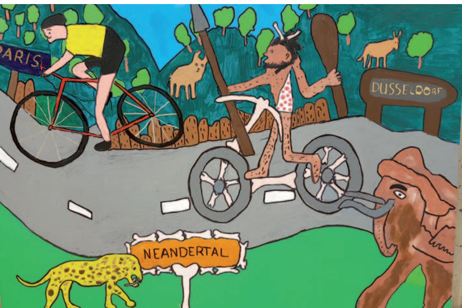
Das von Schülern gefertigte Werk zur Tour de France 2017.