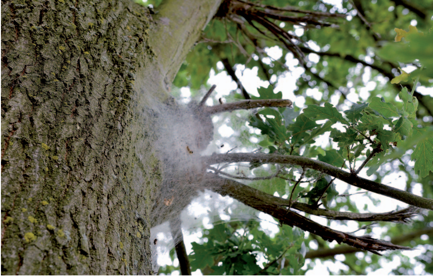
Eichenprozessionsspinner befallen tatsächlich ausschließlich Eichen. An anderen Bäumen sind sie nicht zu finden.