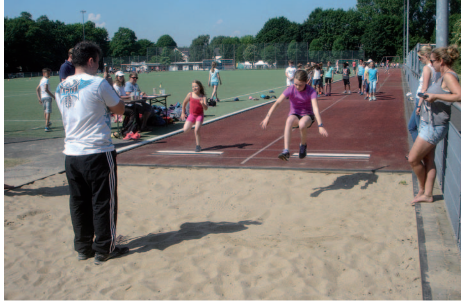
Viel Spaß hatten die Kids beim Sportfest am Weidenweg.