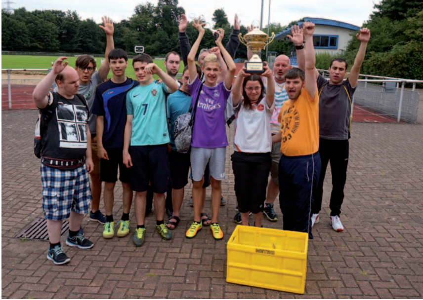
Die Mannschaft der Graf-Recke-Stiftung jubelt über den Wanderpokal.

Sportler mit und ohne Behinderung kämpften in Hilden um Platz und Sieg