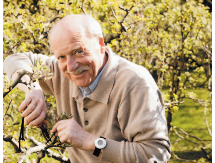
Urlaub kann so entspannend sein – mit ein wenig Überlegung macht auch die Anreise keinen Stress.

Je näher der Lebensabend rückt, desto mehr schätzen die Deutschen die Vorzüge der Großstadt. 43 Prozent der 51- bis 65-Jährigen sehen sich im Alter in der Großstadt besser aufgehoben als auf dem Land. Das ist das Ergebnis einer repräsentativen Studie von immowelt.de, eines der führenden Immobilienportale. Von den unter 30-Jährigen wollen nur 37 Prozent in einer Großstadt alt werden. Die große Mehrheit träumt davon, den Lebensabend beschaulich in einer Kleinstadt oder auf dem Dorf zu verbringen. Ursache für die Großstadtliebe der Älteren ist eine nüchterne Sichtweise auf ihre zukünftigen Bedürfnisse: Kurze Wege, etwa zum Einkaufen, sind für 90 Prozent ein wichtiges Argument, 84 Prozent schätzen die bessere ärztliche Versorgung und 78 Prozent sehen in der Großstadt mehr Angebote für seniorengerechtes Wohnen in Gemeinschaft und