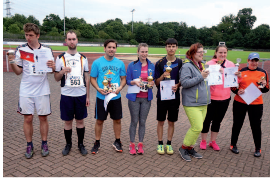
Die Sieger im Dreikampf (Laufen, Weitsprung, Ballwurf), dabei gab es auch Mehrfachsieger.

Die Bezirkssportanlage „Am Bandsbusch“ in Hilden war dieses Jahr Austragungsort für das inklusive Sportfest, das von der Lebenshilfe e.V. Kreisvereinigung Mettmann, dem LVR-HPH-Netz Ost, dem LVR-Berufskolleg Düsseldorf, der Graf-Recke-Stiftung und der SG Monheim organisiert wurde. Bei idealem Wetter kämpften die Teilnehmer aus dem Kreis Mettmann und Düsseldorf um eine gute Platzierung. „Wichtig ist hier aber unser Motto ‘Dabei sein ist alles’, denn dieses Sportfest soll in erster Linie Freude bereiten“, erklärte Jakob Dreesmann, Leiter der Lebenshilfe-Sport-