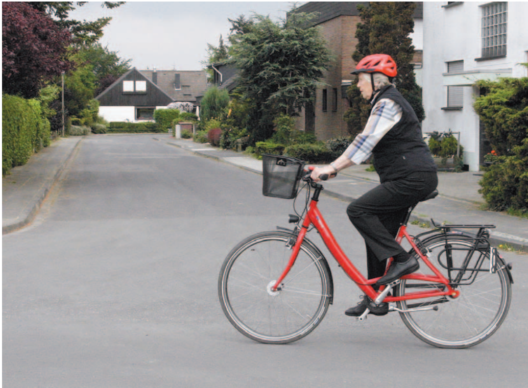
Unfallrisiken können durch ein sicheres Fahrrad deutlich verringert werden.