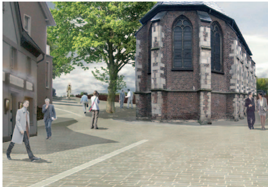
Der Bereich Kapellenstraße/An d'r Kapell wird umgestaltet.