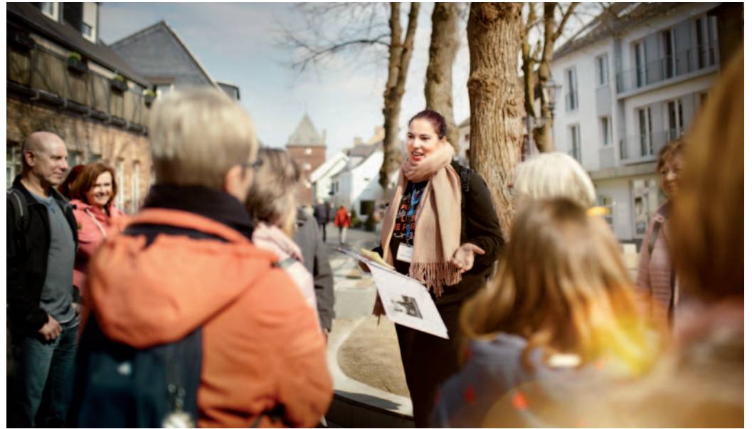
Die MonGuides machen die Entdeckung der Stadt zu einem ganz besonderen Erlebnis.