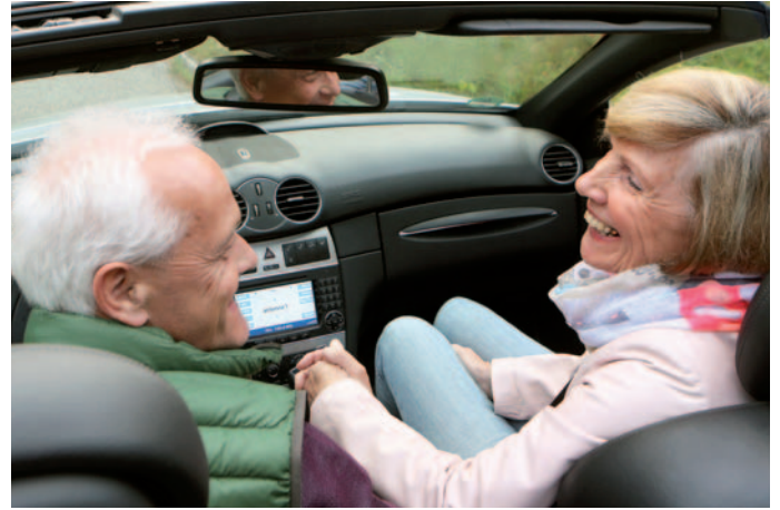
Mit der Aktion Schulterblick ist eine Kampagne für sichere Mobilität im Alter gestartet.

Anfahren“ mit 16,2 Prozent zu 11,5 Prozent als Unfallursache. Mit zunehmendem Alter können sich Gesundheitsbeeinträchtigungen einstellen. Typisch sind ein Nachlassen der Seh- und Hörkraft sowie eine verminderte Reaktionsfähigkeit. Dies kann die Fahrtüchtigkeit beeinträchtigen. Um Klarheit über den eigenen Gesundheitszustand zu erhalten und auch rechtzeitig gegensteuern zu können, ist ein regelmäßiger freiwilliger Gesundheitscheck beim Hausarzt oder der Hausärztin hilfreich. Einen einheitlichen Check gibt es nicht. Überprüft werden sollten neben der Sehkraft das Gehör, die Beweglichkeit, die Aufmerksamkeit und die Reaktionsgeschwindigkeit sowie die Funktion von Herz, Leber und Nervensystem. Interessierte Autofahrende können beim Online-Test unter www.dvr.de/schulterblick ihre Seh-, Hör- und Reaktionsfähigkeit prüfen. Der Test vermittelt einen ersten Eindruck, ersetzt aber nicht den regelmäßigen Besuch beim Arzt. Angehörige sehen es häufig als Erste, wenn sich bei Familienmitgliedern allmählich Beeinträchtigungen beim Fahren einschleichen. Sie