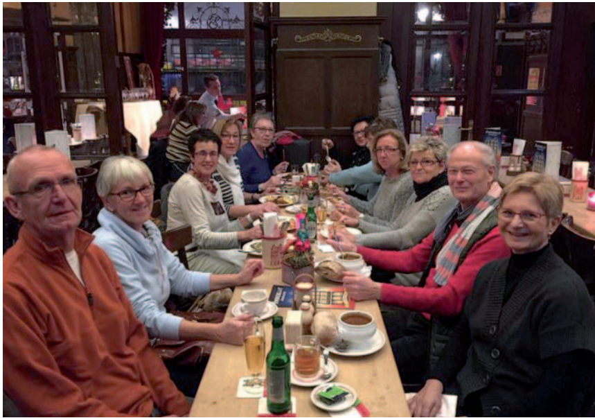
Einen spannenden Ausflug nach Köln gab es im Dezember für eine Gruppe des „ZWAR“-Netzwerkes Monheim.