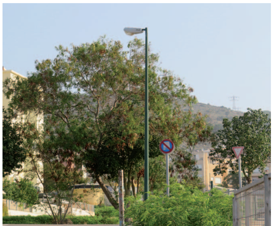
Regenspeichernde Carmel-Berge in Israel.