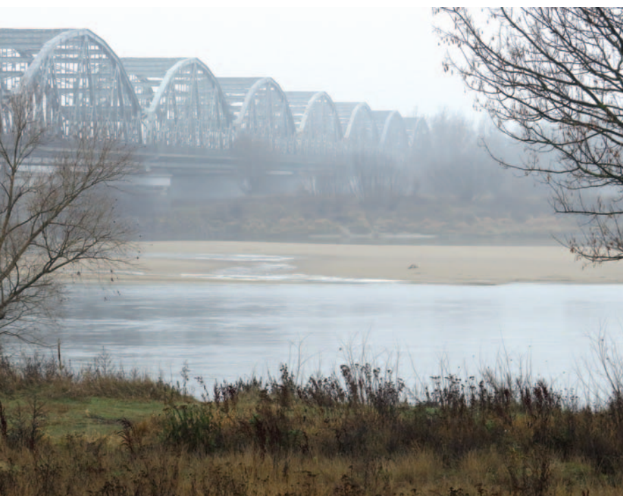
Die Weichsel bei Grudziqdz/Graudenz in Polen.

Raststation der Pilger auf dem Weg von Paris nach Santiago de Compostela sein. Die Barockzeit sollte für ihren Fluss Bièvre eine besondere Rolle spielen. Die gigantischen Wasserspiele der Schlossanlage von Versailles benötigten ungeheure Mengen sauberen, klaren Wassers. Um dies zu erreichen, wurde auch die Bièvre angezapft. Von der Quelle bis zum Schloss-Reservoir wurde sie geschützt, damit absolut nichts das Wässerchen trübe. Hinter Versailles galt das