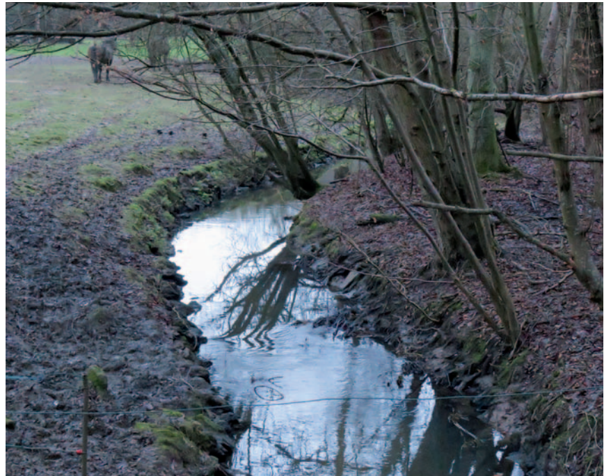
Die Barockzeit spielte für den Fluss Bièvre eine besondere Rolle.