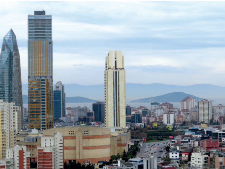
Atasehir ist die Hauptstadt des gleichnamigen Landkreises der türkischen Provinz Istanbul.

Ein ganz besonderer Blick auf Monheim am Rhein und seine Partnerstädte