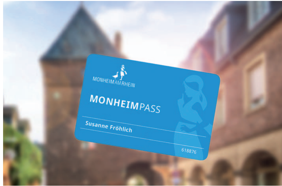
So ungefähr wird er wohl aussehen: der neue Monheim-Pass, den alle Bürgerinnen und Bürger der Stadt ab 2019 in der Tasche haben werden. Grafik: Stadt Monheim am Rhein

selbst bei spontanen Rathaus-Besuchen in mehr als 95 Prozent der Fälle bei unter zehn Minuten liegt. Die durchschnittliche Wartezeit im Monheimer Bürgerbüro beträgt gerade einmal drei Minuten. Am schnellsten und bequemsten geht es natürlich über die Online-Termin-Reservierung, die auch direkt über die Seitennavigation der Startseite auf www.monheim.de erreichbar ist. ■