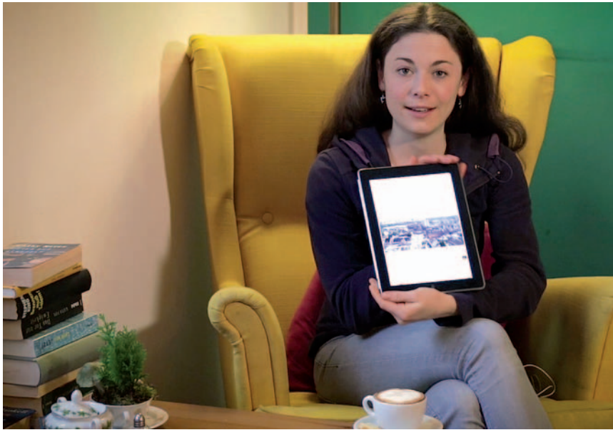
Unter www.monheimer-lokalhelden.de sind die Monheimer Lokalhelden von überall mit jedem Endgerät erreichbar.