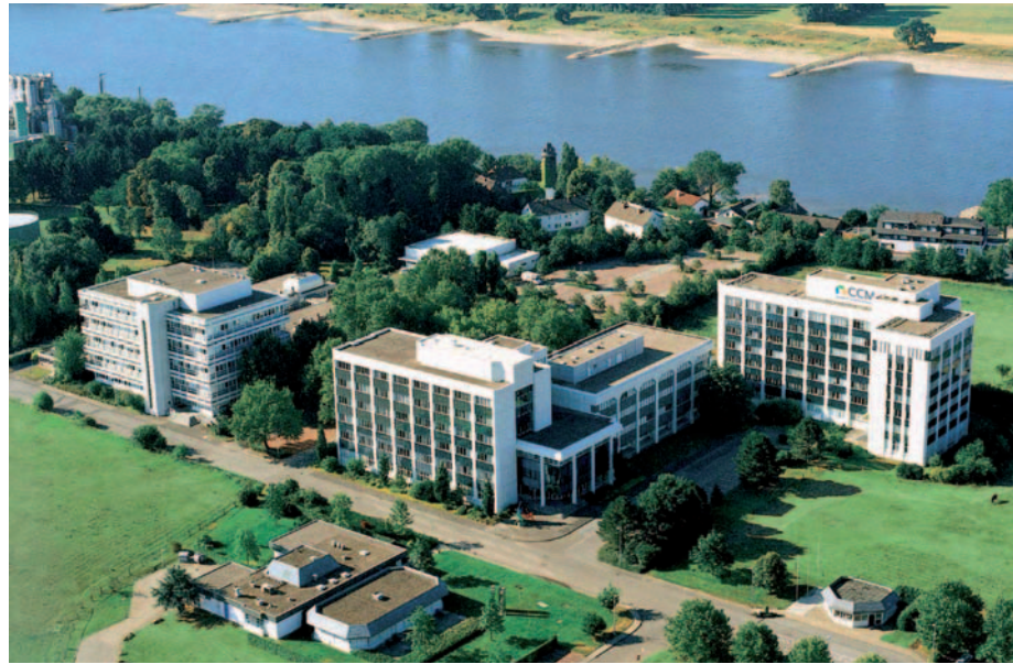
Der Creative Campus Monheim ist von der Stadtentwicklungsgesellschaft gekauft worden.

ten haben daher bereits im Vorfeld angefragt. Die Monheimerinnen und Monheimer können sich nach Stand der Dinge daher schon heute auf ein sehr gutes Angebot freuen, das in den kommenden Monaten nun qualitativ sicher noch weiter ergänzt wird. Denn jetzt werden über Oberender & Partner die entscheidenden Gespräche geführt und es geht in die konkrete Vermarktung.“ Die Abrissarbeiten des alten Krankenhauses sind bereits von der Kirchengemeinde und dem Investor gemeinsam beauftragt worden und starten im ersten Quartal 2019. Nach etwas sechs Monaten Rückbau- und Abrissarbeiten, in denen auch Versorgungseinrichtungen wie ein Trafo versetzt werden müssen, beträgt die eigentliche Bauzeit rund zwei Jahre. Die „Alte Schulstraße GmbH“, hinter der die Absolut Immobilien und Beteiligungs GmbH in Köln steht, will auf der gut 6000 Quadratmeter großen Grundstücksfläche sieben Wohn- und Geschäftshäuser mit drei bis fünf Stockwerken errichten, die künftig als gestaffeltes Ensemble den Gesundheitscampus bilden werden. „Die 86 schwellenfreien Mietwohnungen mit zwei bis vier Zimmern und zirka 50 bis 100 Quadratmetern Wohnfläche in den Obergeschossen werden als KfW55-Effizienzwohnungen mit eigenem Blockheizkraftwerk sowie weitestgehend mit ‘natürlichen’ Baustoffen errichtet, so dass auch das ‘Wohnen im Gesundheitscampus’ diesen Namen verdienen wird“, verspricht Alexander Kürten, geschäftsführender Gesellschafter bei Absolut. Den etwa 6300 Quadratmetern Gesamtwohnfläche stehen