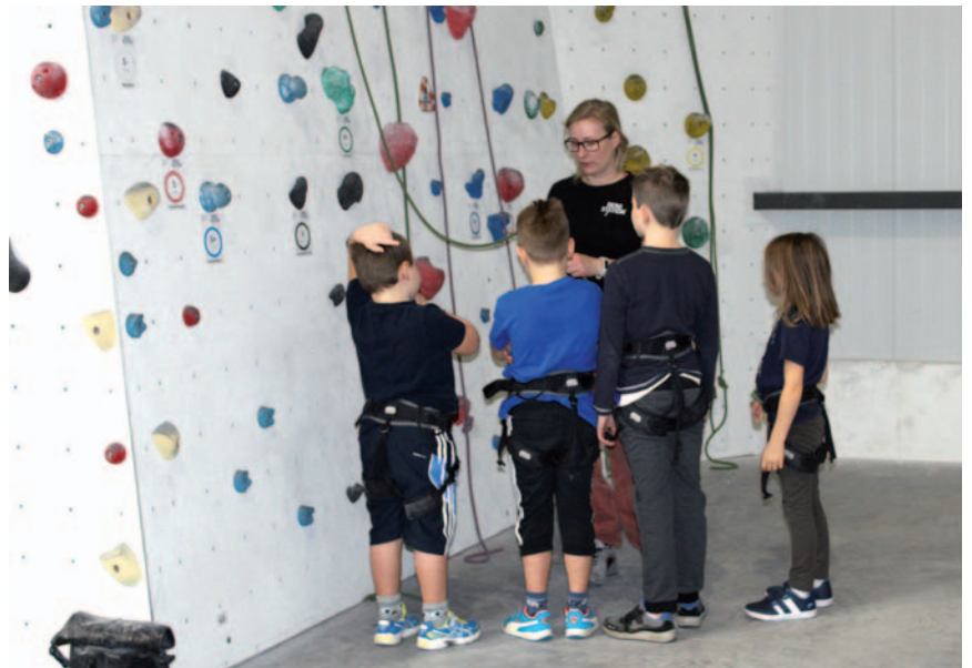
Klettertrainer zeigten den Kindern, wie sie die Wand bezwingen können.