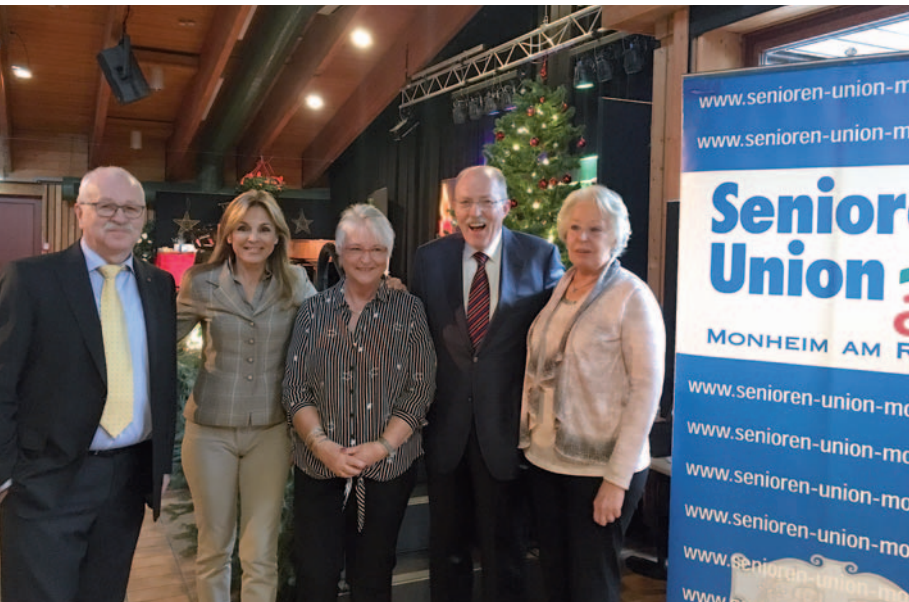
Jahresausklang bei der Monheimer Senioren-Union (SU).