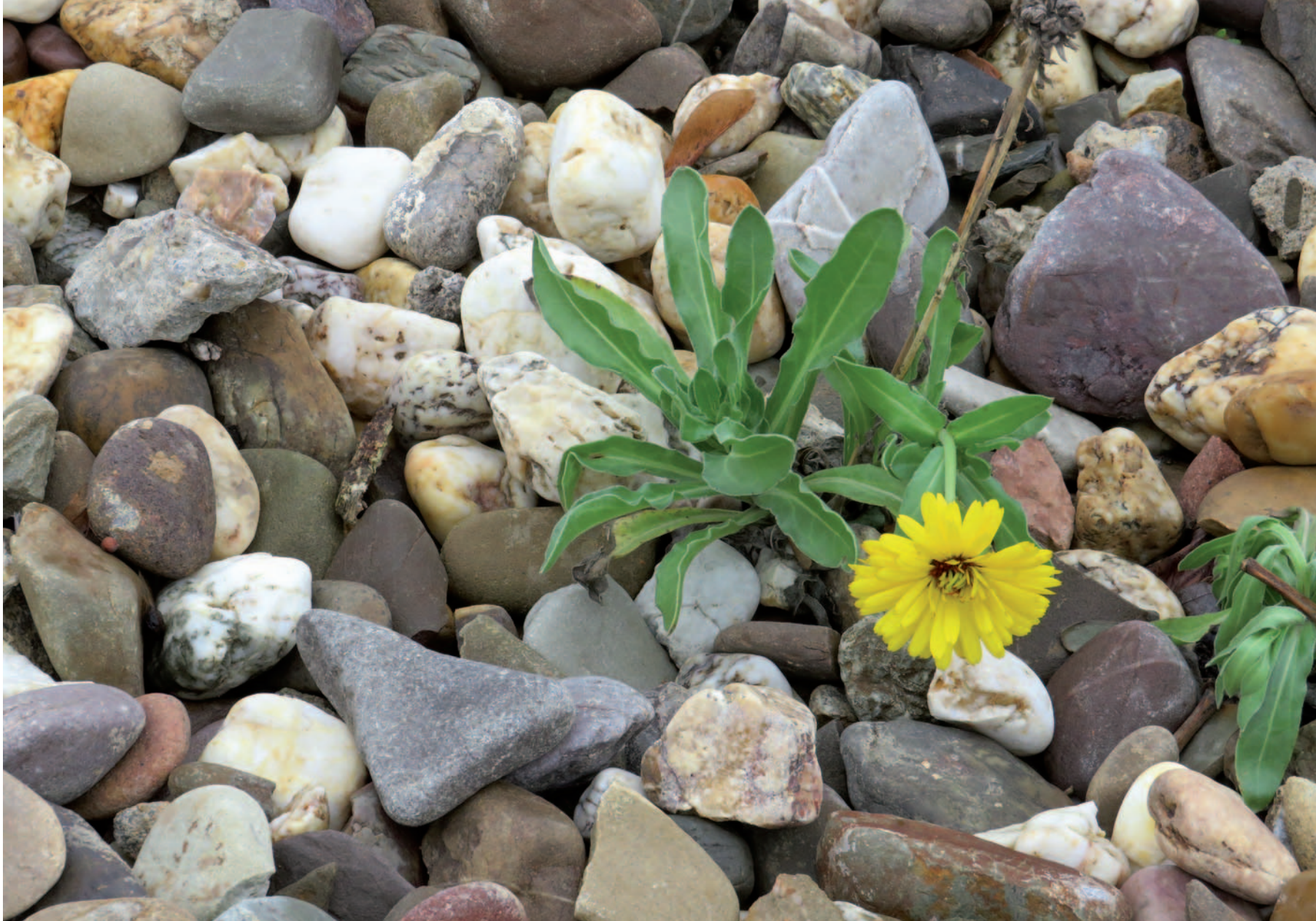
Rheinkies in Monheim.