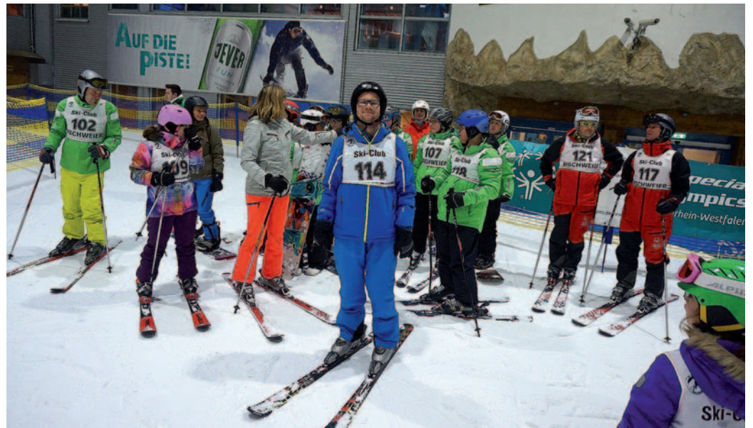
Warten auf den Start in der Neusser Skihalle.