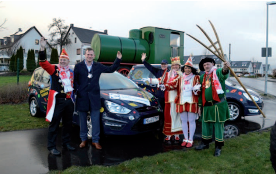
Die schon traditionelle Fahrzeugübergabe durch das Unternehmen UCB.

Nelkenfreitagszug in Hitdorf am 9. Februar