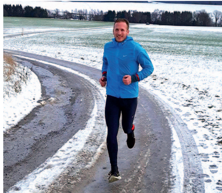
Im Winter dreht er seine Trainingsrunden im Kreis Mettmann.

Wenn Jan Fitschen mal was anderes sehen will, läuft er auch schon mal locker 20 Kilometer. Und das durchaus auch im Winter, irgendwo zwischen Mettmann, Haan und Hilden – auch durch Schnee und Regen. Für die meisten Hobbyläufer dürfte das Pensum eines 10 000 Meter-Europameisters (2006) wohl zu ambitioniert sein. Und seien wir doch mal ehrlich: Wenn man in dieser Jahreszeit aus dem Fenster schaut, überkommt einen schon mal das kalte Grausen.