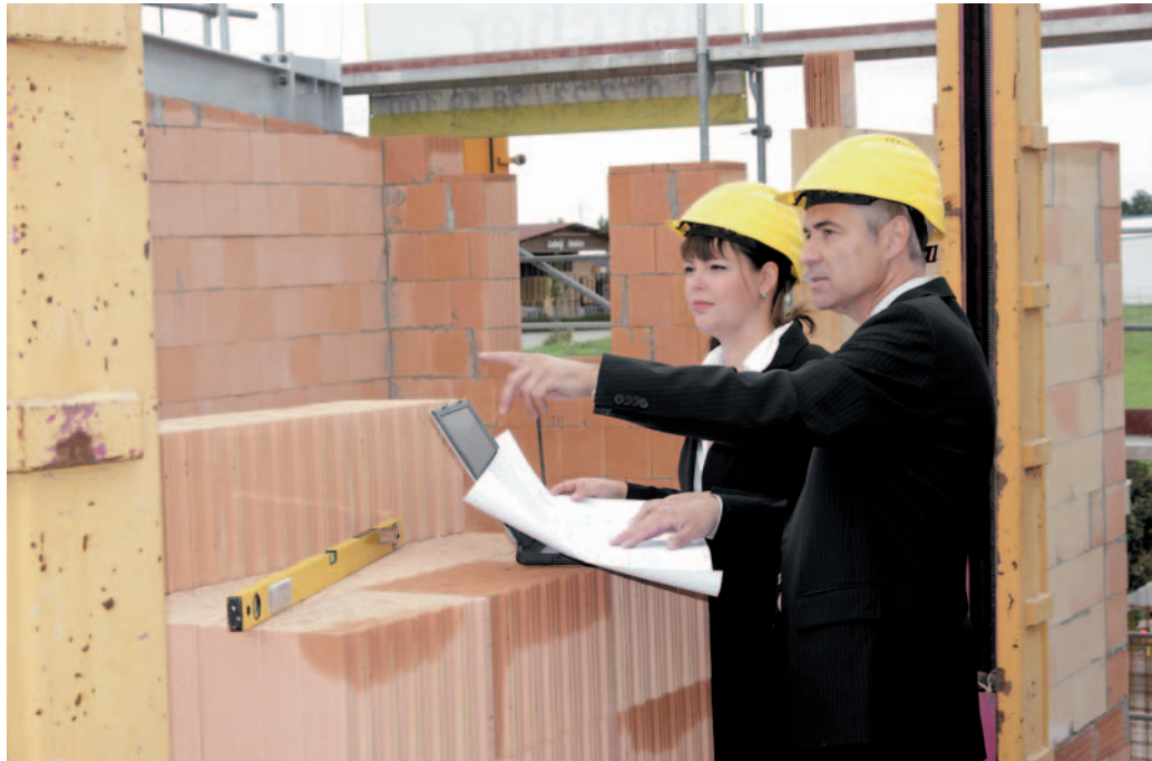
Seriöse Bauträger zeichnen sich in allen Planungs- und Bauphasen in der Regel durch Transparenz und Verhandlungsbereitschaft aus.

Einfach nur den Haustürschlüssel entgegennehmen und das neue Eigenheim genießen. So unkompliziert und bequem stellen sich die meisten Immobilien-erwerber ihren Weg ins eigene Traumhaus vor, wenn sie mit einem Bauträger bauen. Schlüsselfertig bauen heißt zunächst einmal, sämtliche relevanten Entscheidungen bei der Bauplanung und Fertigstellung des Objektes von einem Bauträger treffen zu lassen. Dieser kauft in der Regel freies Bauland, bebaut es und veräußert das fertige Haus samt Grundstück an die neuen Eigentümer. Gegenüber den Behörden und Handwerksbetrieben gilt der Bauträger als Bauherr, der bis zur Übergabe für den gesamten Bauablauf verantwortlich ist. Wer schon ein Grundstück besitzt oder selbst erworben hat, kann mit dem Bauträger einen Werkvertrag über die schlüsselfertige Herstellung des Hauses abschließen. Für die Auswahl des richtigen Baupartners sollten sich die zukünftigen Eigenheimbesitzer deshalb ausreichend Zeit nehmen und sich detaillierte Informationen über das Unternehmen beschaffen. Ist der Bauträger bereits lange in dem Gewerbe tätig? Gibt es Referenzobjekte, die besichtigt oder Kunden, die nach ihrer Zufriedenheit befragt werden können? Wie sieht