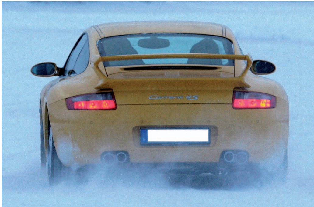
Autodiebe haben es meist auf hochwertige Modelle wie beispielsweise den Porsche Carrera 4S abgesehen.

So jedoch erhielt die Polizei ein perfektes Porträt des wegen Bandenhilfe einschlägig Vor-