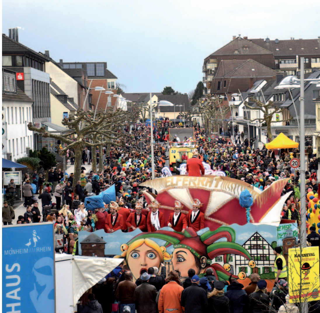
Der Wagen des Gromoka-Elferrates nimmt am Rathaus-Vorplatz die Kurve von der Krischer- in die Alte Schulstraße, gefolgt von der Baumberger Hippogarde.