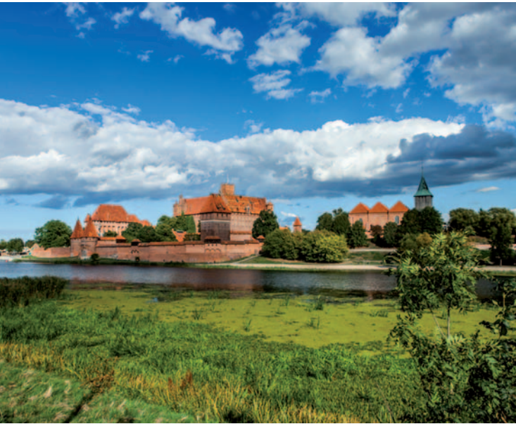
Selbstverständlich steht in Malbork auch ein Besuch der weltberühmten Marienburg auf dem Programm.