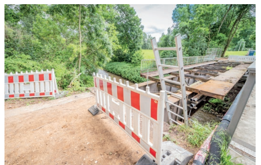
Radwegarbeiten an der Erftbrücke zwischen Grimlinghausen und Gnadental

Zusätzlich erweitern nach und nach die Öffnungen der Einbahnstraßen das Fahrradverkehrsnetz in Neuss. Dazu gehören im Dreikönigenviertel die Goethestraße und die Bergheimerstraße. Im Bereich der Innenstadt werden in naher Zukunft die Erftstraße (zwischen Kanal- und Friedrichstraße), Kanalstraße, Grünstraße, Liedmannstraße, Hermannstraße, Sternstraße (zwischen Kanalstraße und Drususallee), Mühlenstraße und Elisenstraße für Räder beidseitig befahrbar sein. Derzeit wird