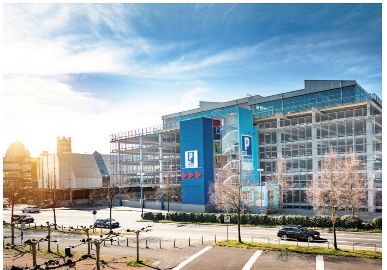
Eins der vier City-Parkhäuser: Das Rheintor-Parkhaus an der Rheinstraße

Allen Anwohnerinnen und Anwohnern macht die City-Parkhaus GmbH zudem das Angebot, eine 24-Stunden-Dauerkarte zu nutzen. Mit diesem Tarif ist es in den drei Parkhäusern Tranktor, Niedertor und Rheintor möglich, für 60 Euro im Monat rund um die Uhr zu parken. Beschlossen wurden die neuen Gebühren im Mai vom Rat der Stadt Neuss.