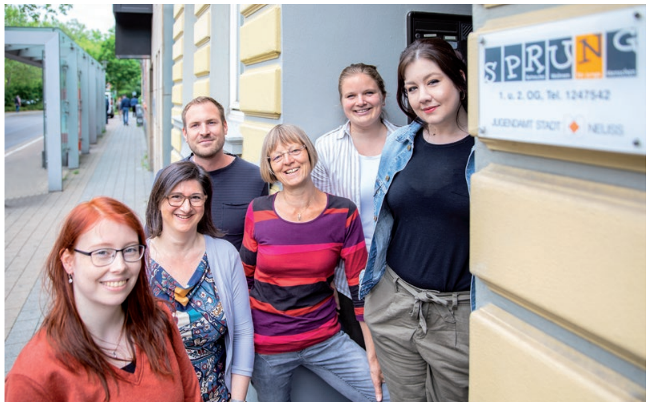
Das Team „Sprung“ vor seinem Büro am Hamtorwall

Es gibt aber auch Ausnahmen. Nicht jede oder jeder braucht eine eigene Wohnung. „Wenn wir bei