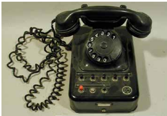
Objekt: Telefonapparat; Material: Kunststoff, Kupfer, Eisen, Gummi.

Öffnungszeiten: sonntags von 10.30 Uhr bis 12.30 Uhr und nach telefonischer Anmeldung (02802) 2604 oder 4403 In loser Folge werden hiermit die einzelnen Objekte einer größeren Öffentlichkeit vorgestellt.