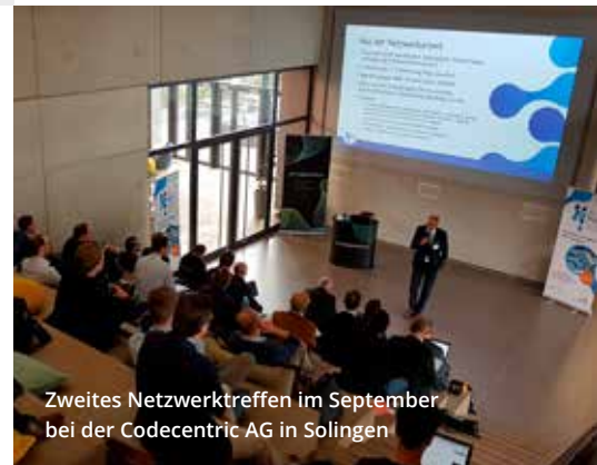
Zweites Netzwerktreffen im September bei der Codecentric AG in Solingen

GmbH (München), die ENLYZE GmbH (Aachen) und das Fraunhofer-Institut für Mikroelektronische Schaltungen und Systeme IMS (Duisburg). Ziel ist es, gemeinsam im Austausch mit Anwendern, Anbietern und der Wissenschaft neue praxisorientierte Forschungs- und Entwicklungsprojekte auf den Weg zu bringen. Ein Beitritt zum Netzwerk ist jederzeit möglich.