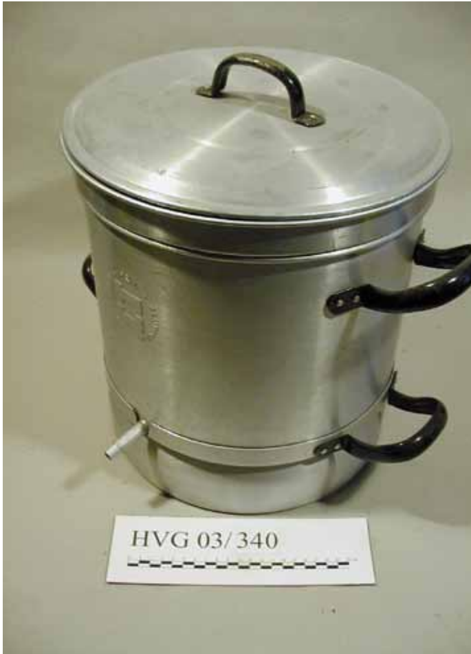
Objekt: Entsafter; Material: Aluminium; Erwerb von: Fam. Willi Dahmen.

Öffnungszeiten: sonntags von 10.30 Uhr bis 12.30 Uhr und nach telefonischer Anmeldung (02802) 2604 oder 4073 oder 4403 In loser Folge werden hiermit die einzelnen Objekte einer größeren Öffentlichkeit vorgestellt.