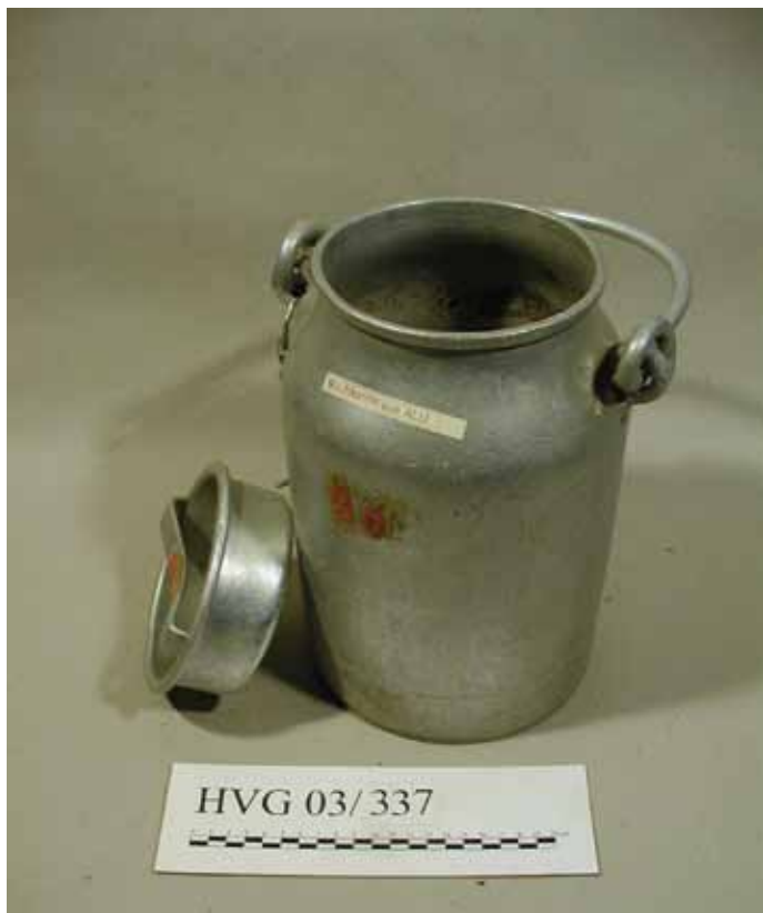
Objekt: Milchkanne; Material: Aluminium

Öffnungszeiten: sonntags von 10.30 Uhr bis 12.30 Uhr und nach telefonischer An- meldung (02802) 2604 oder 4073 oder 4403 In loser Folge werden hiermit die einzel- nen Objekte einer größeren Öffentlichkeit vorgestellt.