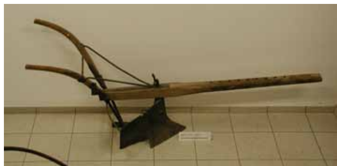
Objekt: Beetpflug; Material/Technik: Holz, Eisen

In loser Folge werden hiermit die einzelnen Objekte einer größeren Öffentlichkeit vorgestellt.