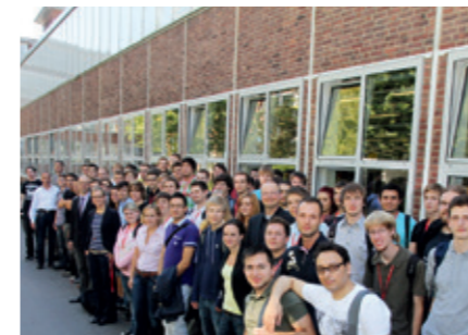
Studienanfänger im WS 2011/2012

Mit den Schwerpunkten Elektrotechnik, Informatik, Mechatronik, Maschinenbau und Wirtschaftsingenieurwesen erhalten die Studierenden fundiertes Know-how im Ingenieurbereich. Modernste Ausstattung sowie ausreichend Arbeits- und Laborplätze bieten ein Lernumfeld, das Spaß und Erfolg im Studium garantiert. Die Atmosphäre an der Hochschule ist familiär geprägt. Kleine Studiengruppen ermöglichen ein intensives Studium sowie eine individuelle Betreuung durch die Professoren.