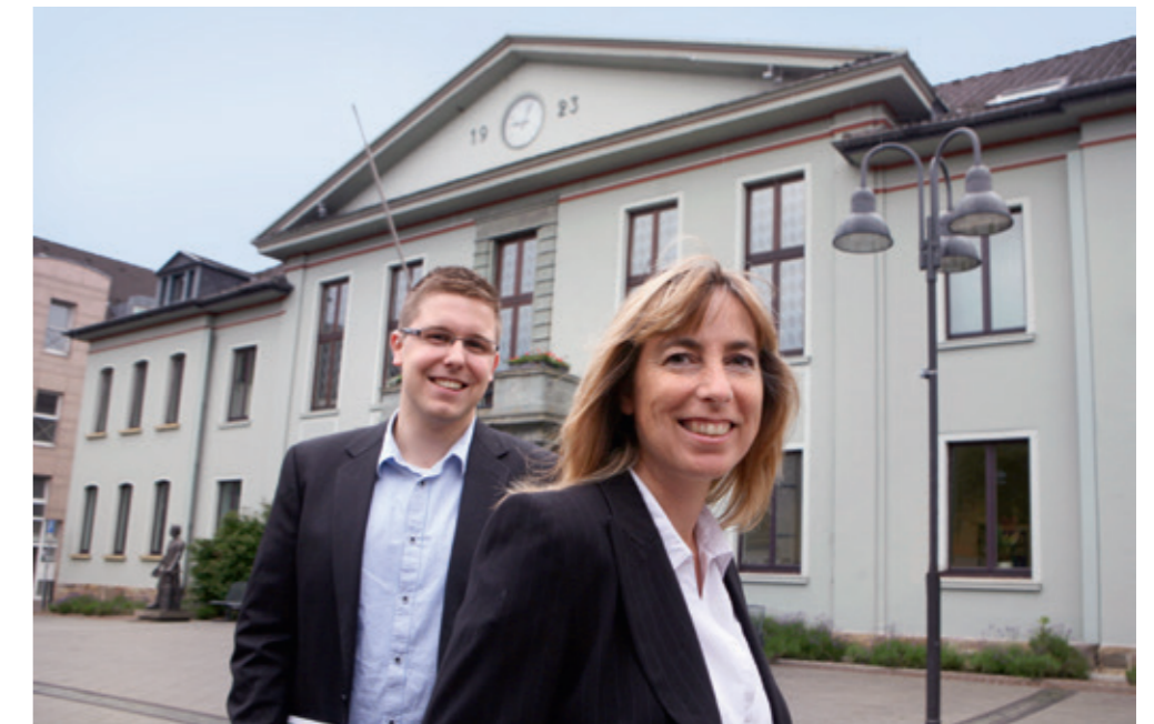
Wir freuen uns auf Sie! Ihre Wirtschaftsförderung

Heiligenhaus ist als gründerfreundliche Kommune ausgezeichnet worden: Auch beim Schritt in die Selbständigkeit unterstützt und begleitet Sie die Wirtschaftsförderung gerne. Durch umfangreiche Hilfestellungen und ein breites Angebot an grundlegenden und Fachthemen betreffenden Gründerveranstaltungen möchten wir einen Beitrag zum Erfolg Ihrer Gründungsidee leisten.