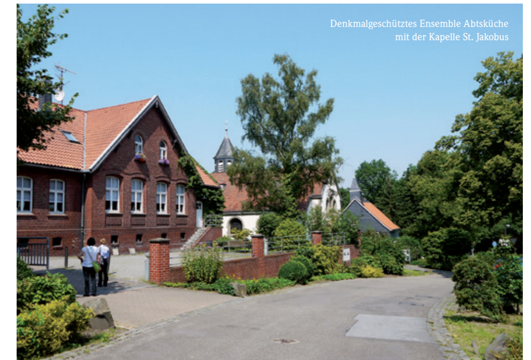
Denkmalgeschütztes Ensemble Abtsküche mit der Kapelle St. Jakobus

Der Ort für das Waldmuseum hätte besser kaum gewählt sein können: Das kleine Stückchen Erde trägt den Namen „Im Paradies“. Mitten im Naturschutzgebiet Vogelsangbachtal ist das kleine Museum im denkmalgeschützten ehemaligen Wasserwerk, einige Wanderminuten vom Museum Abtsküche und der Museums-scheune der Feuerwehr entfernt, untergebracht. Seit April 2008 hat es seine Pforten für Schulklassen, Familien oder auch Erwachsenengruppen geöffnet – allerdings nur nach Anmeldung!