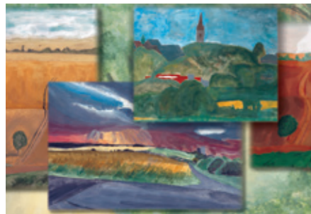
Collage - Bilder des Kunstkurses (11. Jhg.) des Immanuel-Kant-Gymnasiums

Abgerundet wird das Schulangebot durch die private, englischsprachige Rheinland International School, die sich in der Trägerschaft der Stuttgarter Klett Gruppe befindet. Englischsprachige Lehrer unterrichten dort die Schüler und bereiten sie auf das international anerkannte „International Baccalaureate“ vor, einer vollwertigen Alternative zum deutschen Abitur. Die Schullaufbahn beginnt mit zwei Vorschulklassen und erstreckt sich weiter über zwölf Schuljahre.