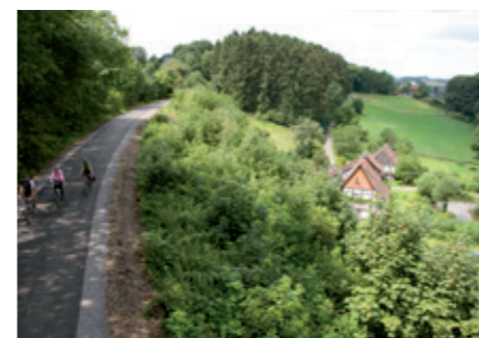
PanoramaRadweg am Gellenkothen

Heiligenhaus und Tourismus. Passt das zusammen? Natürlich ist das Niederbergische keine klassische Urlaubsregion. Aber Heiligenhaus bietet seinen Einwohnern, Menschen aus umliegenden Großstädten, Messegästen und Sportlern jeden Tag mehr. Man muss die schönen Seiten nur neu entdecken.