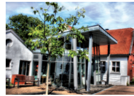
Museumsanbau, Foto: Marcel Quoos