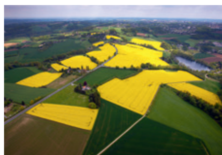
Felder und Wiesen rund um den Abtskücher Stauteich