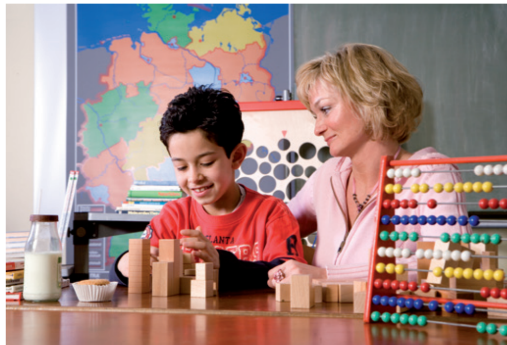
Heiligenhaus - Ein Platz für vielfältige Betreuungsangebot