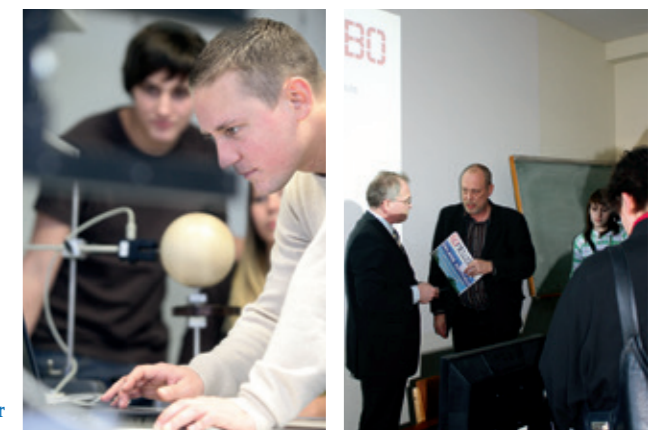
Tag der offenen Tür