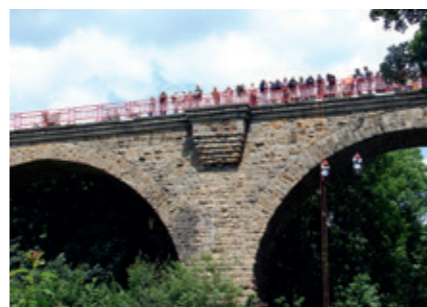
Professionelle Industriekletterer am Viadukt Ruhrstraße Süd