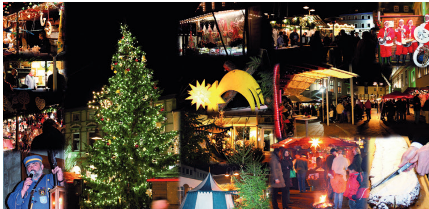
Impressionen vom Heiligenhauser Weihnachtsmarkt