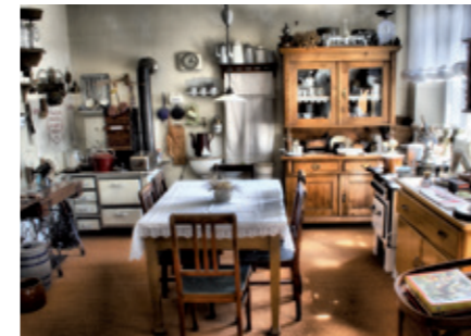
Historische Küche in der Heimatkundlichen Sammlung