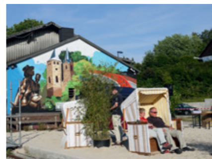
Entspannen vor dem ehemaligen Güterbahnhof