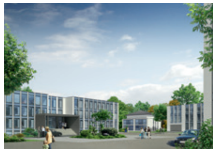
Visualisierung Gewerbe- und Büropark grünSelbeck

Auch für die übrigen Branchen werden Kooperationsmöglichkeiten entwickelt, die den Dialog zwischen Forschung und Wirtschaft fördern. Wirtschaft, Bürgerschaft, Stadt und Bildungsträger dürfen sich dank Stadtmarketing und weiterer (Wirtschafts-) Vereinigungen einer guten