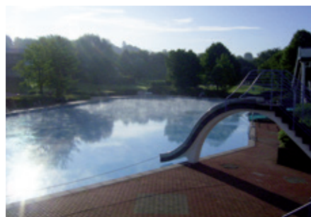
Sonnenaufgang im Heljensbad