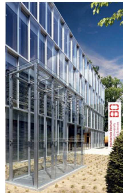
Der Neubau auf dem ehem. Kiekert-Areal wird den Studenten ab 2014 ideale räumliche Gegebenheiten bieten

Die enge Verzahnung von Theorie und Praxis, die es den Studierenden ermöglicht, von Beginn an praktische Erfahrungen in technischen Disziplinen zu sammeln und die sich dadurch ergebenden guten Karrierechancen sowie der intensive und frühzeitige Kontakt zu einem potenziellen zukünftigen Arbeitgeber sind klare Vorteile, die das duale Studium aufweist. Die Vergütung während des Studiums verschafft zudem eine finanzielle Unabhängigkeit.