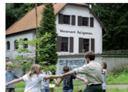
Ehemaliges Wasserwerk – nun Waldmuseum im Paradies