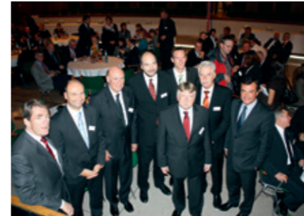
Festakt zur Eröffnung der Hochschule

Einwohner im 15 km-Radius um Heiligenhaus ca. 1,2 Mio Einwohner im 25 km-Radius um Heiligenhaus ca. 3,7 Mio Lückenschluß der A44 im Bau