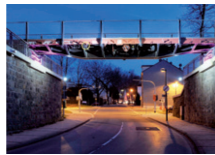
Erste Waggonbrücke Deutschlands an der Bahnhofstraße