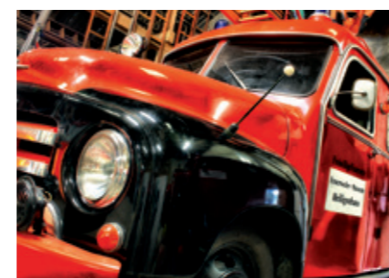
Fahrzeug im Feuerwehrmuseum

Gleich drei Museen findet der interessierte Besucher im geschichtsträchtigen Ortsteil Abtsküche: Die Heimatkundliche Sammlung (Museum Abtsküche) des Geschichtsvereins Heiligenhaus, das Feuerwehrmuseum der Freiwilligen Feuerwehr sowie das Waldmuseum .