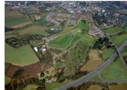
Künftige Gewerbegebiet „Grüner Jäger“ mit A44 und den ersten beiden dargestellten Bauabschnitten

15 Universitäten und Fachhochschulen sind von Heiligenhaus aus in weniger als einer Stunde zu erreichen. Sie garantieren neben dem komplett ausgebauten Heiligenhauser Schulsystem die exzellente Qualifikation zukünftiger Arbeitnehmer. Die wissenschaftliche Landschaft ist seit 2009 um zwei regionale Hochschuleinrichtungen reicher. Mit dem Institut für Sicherungssysteme der Bergischen Universität Wuppertal in Velbert und dem Studienzentrum Heiligenhaus der Hochschule Bochum konnte in der Schlüsselregion der Campus Velbert. Heiligenhaus etabliert werden.