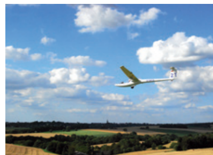
Segelflugzeug vor dem Panorama von Heiligenhaus