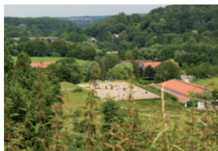
Reitanlage mitten im Grünen!

In Heiligenhaus steht ein breites und umfangreiches Sportangebot zur Verfügung, das den Vergleich zu den umliegenden Großstädten nicht scheuen muss. Die zurzeit 21 eingetragenen und anerkannten Heiligenhauser Sportvereine bieten ihren mehr als 5.100 Mitgliedern ein vielfältiges und auf jede Altersgruppe abgestimmtes Sportangebot. Trainiert wird in einer der insgesamt acht modernen städtischen Turn- und Sporthallen, die teilweise mit entsprechenden Besuchertribünen auch für die Austragung von Wettkämpfen bestens geeignet sind, oder auf der städtischen Freisportanlage an der Talburgstraße. Als Schwimmsportstätte dient den Sportlern das Heljensbad mit Frei- und Hallenbad. Darüber hinaus betreiben die Heiligenhauser Sportvereine insgesamt zehn vereinseigene Sportanlagen. Dies sind neben drei Tennis- und zwei Reitanlagen auch ein Flugplatz für den Motor- und Segelsportflug, eine Schießsport- und Kegelsportanlage sowie ein Bootshaus der Kanuten an der Ruhr in Kettwig.