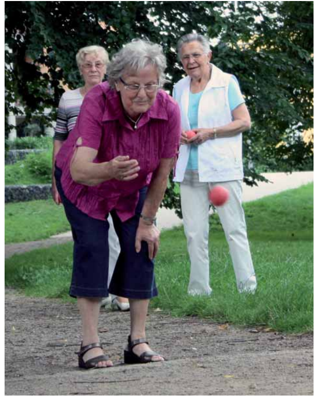
Boule im John-Steinbeck-Park

Alle in Heiligenhaus ansässigen Vereine, Verbände und Institutionen an dieser Stelle aufzuführen würde den Rahmen des Seniorenwegweisers sprengen. Eine Übersicht über die verschiedenen Institutionen