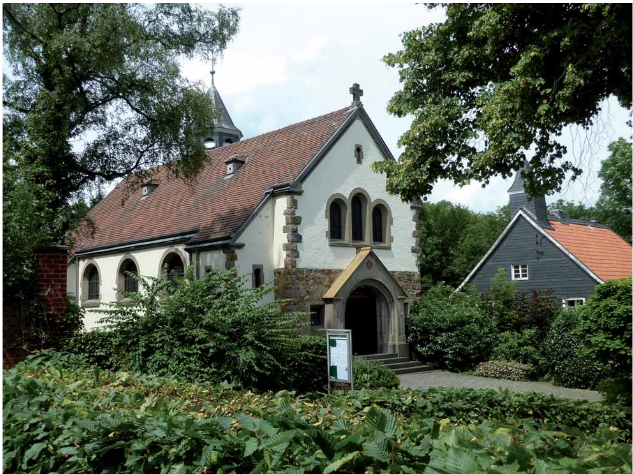
Kapelle Sankt Jakobus