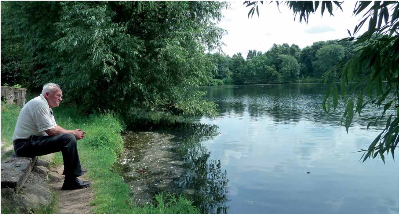
Entspannung am Abtskücher Stauteich