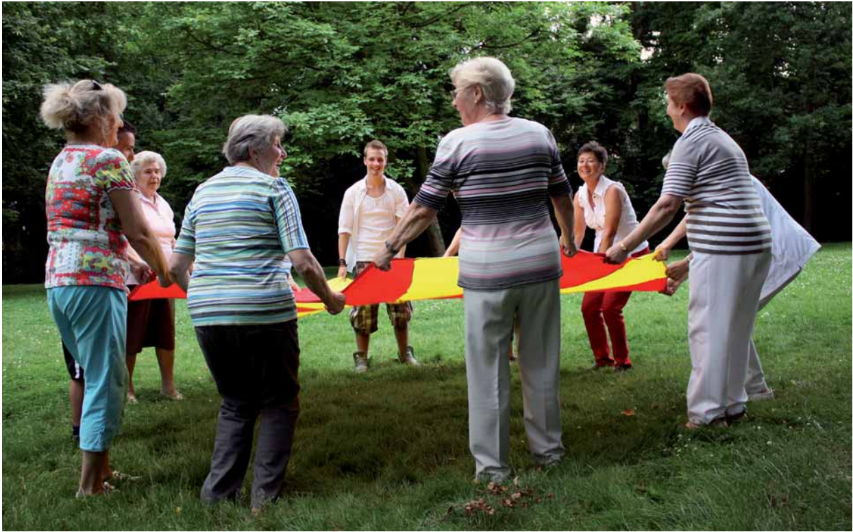
Bewegung im John-Steinbeck-Park

tungsbesuch durch einen Pflegedienst oder eine andere von der Pflegekasse anerkannte pflegefachliche Beratungsmöglichkeit in Anspruch zu nehmen. Für die Pflegestufe III ist der Beratungsbesuch vierteljährlich notwendig.