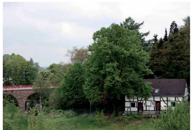
Fachwerkhaus am PanoramaRadweg niederbergbahn

Es werden darüber hinaus zahlreiche Touristen erwartet, da die Niederbergbahn mit größeren Radwegen, wie der Kaiser-Route oder dem Euroga-Radweg, verbunden ist. Zudem ist eine Einbindung des Radwegs in ein touristisches Gesamtnetz unter der Dachmarke Bergischer Panoramaradweg geplant. So wird einer der längsten Bahnradwege Europas entstehen.