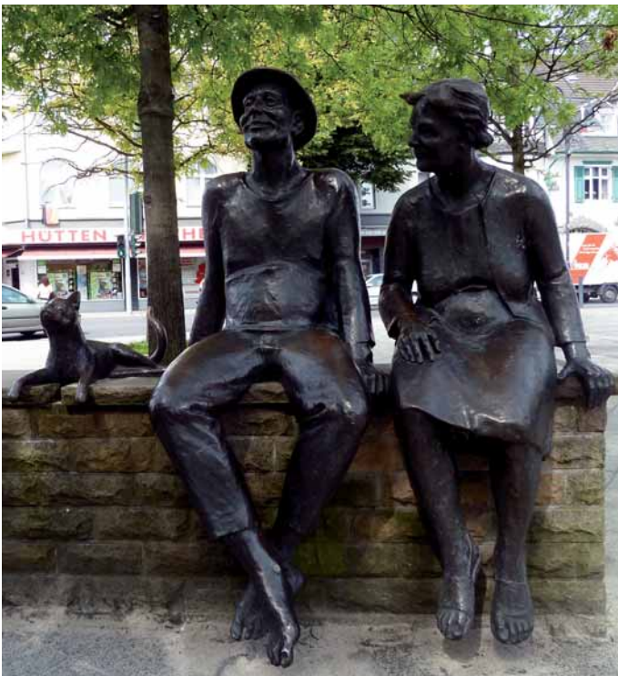
Pladderköpp am Kirchplatz