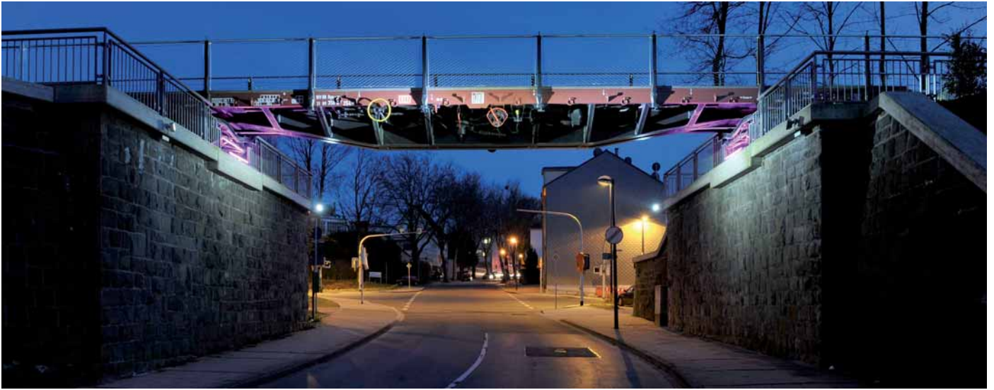
Waggonbrücke bei Nacht