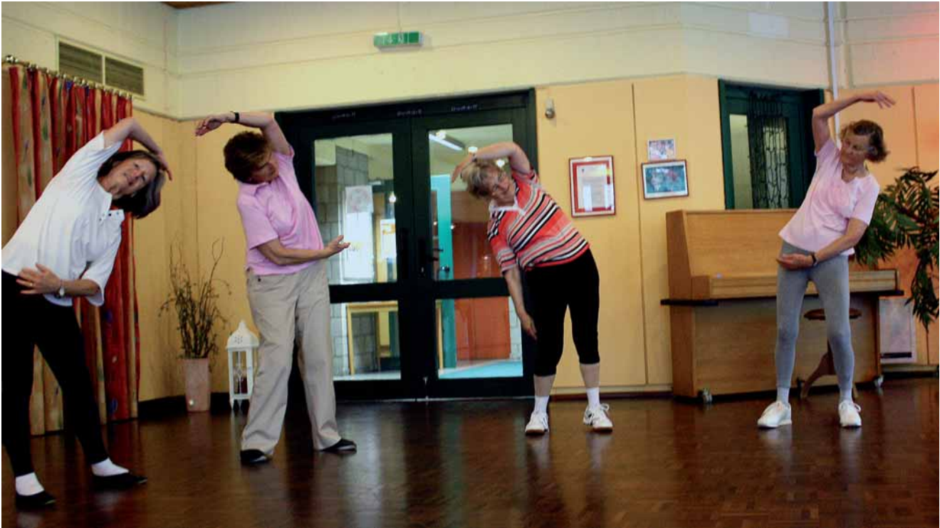
Aktiv im Alter

Nicht nur Menschen im hohen Alter können durch Krankheit, Unfall und Behinderung auf fremde Hilfe angewiesen sein. Persönliche Angelegenheiten wie