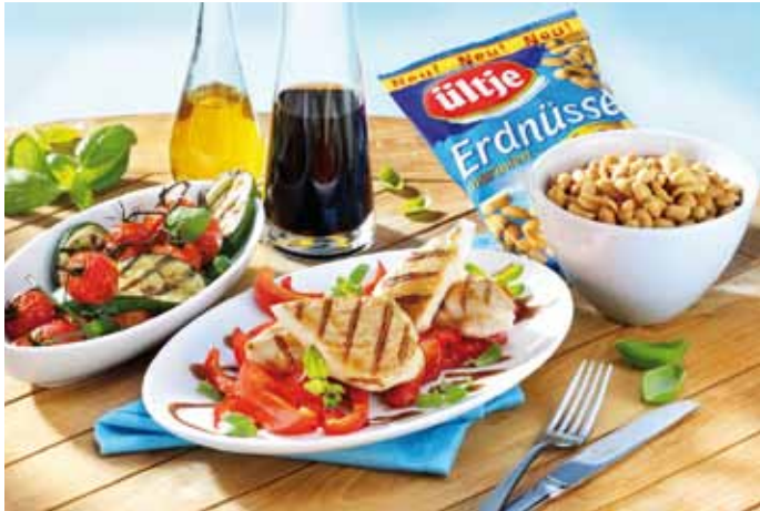
Mariniertes Fleisch und Gemüse ist beim Grillen sehr beliebt. Als ergänzender Snack zur Grillparty gibt es jetzt auch marinierte Erdnüsse.

Kaum ist der Sommer da, schon duftet es überall draußen herrlich nach gegrilltem Fleisch, Fisch oder Gemüse. So manch einer wird jetzt zu einem genialen Küchenchef und probiert neue Varianten beim Grillen aus. Zu einer wahren Kunst hat sich das