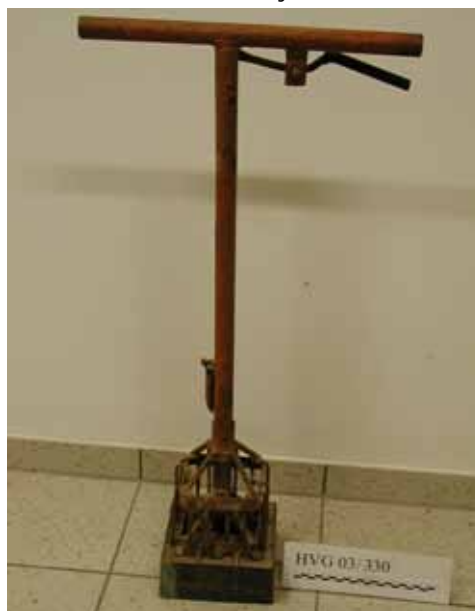
Objekt: Steckbeetportionierer; Material/Technik: Eisen

Öffnungszeiten: sonntags von 10.30 Uhr bis 12.30 Uhr und nach telefonischer Anmeldung (02802) 2604 oder 4073 oder 4403 In loser Folge werden hiermit die einzelnen Objekte einer größeren Öffentlichkeit vorgestellt.