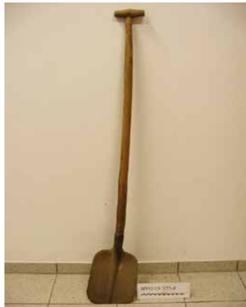
Objekt: Schüppe; Material/Technik: Eisen, Holz.

Öffnungszeiten: sonntags von 10.30 Uhr bis 12.30 Uhr und nach telefonischer Anmeldung (02802) 2604 oder 4073 oder 4403 In loser Folge werden hiermit die einzelnen Objekte einer größeren Öffentlichkeit vorgestellt.