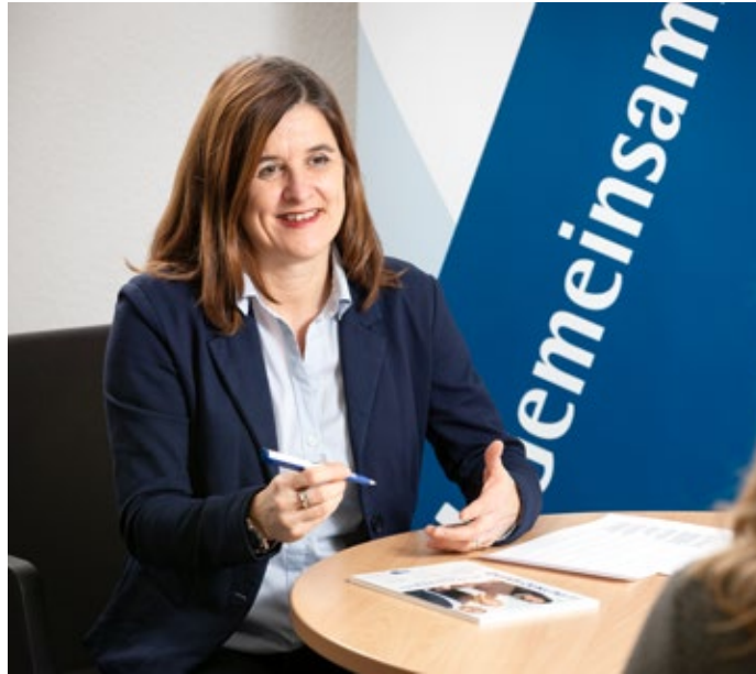
42 Nachgefragt – Wie funktioniert das IHK-Unterstützungsangebot zur passgenauen Vermittlung von Azubis?