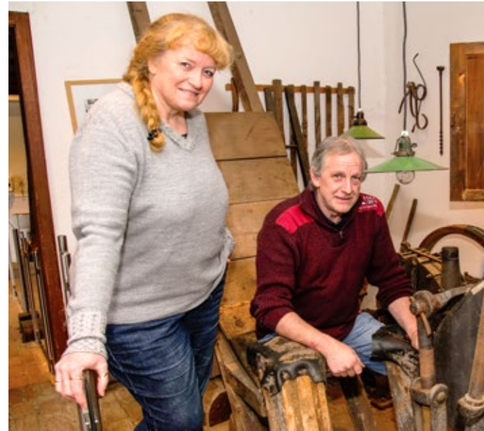
46 Regional – Im Schleifermuseum Balkhauser Kotten wird das harte Leben der Schleifer und „Liewerfrauen“ spürbar.