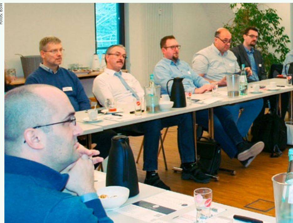
20 Maschinenbauer tauschten sich beim ersten Barcamp des Netzwerks aus.

Die BSW ist vom 1. bis 5. April auf der Hannover Messe in Halle 2, Stand C02 zu finden. Mehr Infos zur Messe gibt es unter: www.hannovermesse.de