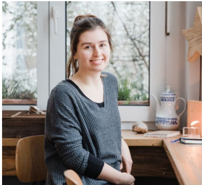
44 Kulinarisches – Die „Lise“ im „W-tec“ setzt auf Wohlfühlatmosphäre und gesunde Küche.