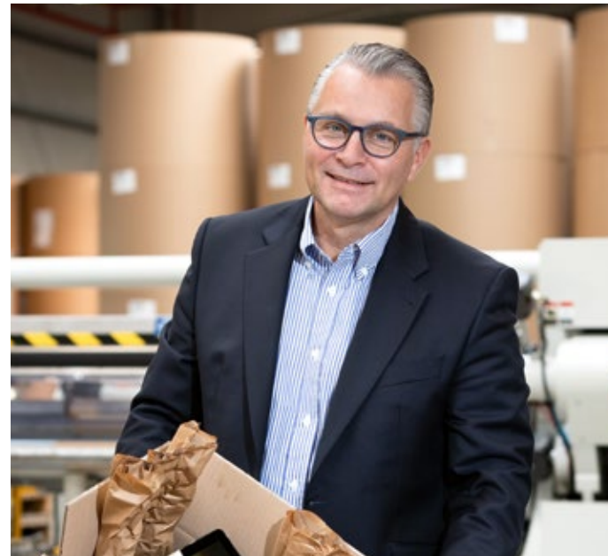
36 Schwerpunkt – Was ändert sich für Unternehmen mit dem neuen Verpackungsgesetz?

Herausgeber und Eigentümer: Bergische Industrie- und Handelskammer Wuppertal-Solingen-Remscheid Hauptgeschäftsstelle: Heinrich-Kamp-Platz 2 42103 Wuppertal (Elberfeld) · Telefon: 0202 2490-0 · Telefax: 0202 2490-999 · www.bergische.ihk.de Geschäftsstellen: Kölner Straße 8 42651 Solingen · Telefon: 0212 2203-0 · Elberfelder Straße 77 · 42853 Remscheid · Telefon: 02191 368-0 Verantwortlich für den redaktionellen Inhalt (Chefredaktion): Hauptgeschäftsführer Michael Wenge · Telefon: 0202 2490-100 · Telefax: 0202 2490-199 Redaktion: Thomas Wängler Telefon: 0202 2490-110 · Telefax: 0202 2490-119 · t.waengler@bergische.ihk.de · Csilla Letay · Telefon: 0202 2490-115 · Telefax: 0202 2490-119 c.letay@bergische.ihk.de · Frauke Fechtner · Telefon: 0202 2490-112 · Telefax: 0202 2490-119 · f.fechtner@bergische.ihk.de · Verlag, Gesamtherstellung, Anzeigenverwaltung, Layout: wppt:kommunikation GmbH · Verantwortlich: Süleyman Kayaalp · Treppenstraße 17-19 42115 Wuppertal Telefon: 0202 42966-0 · Telefax: 0202 42966-29 · az@bergische-wirtschaft.net · www.wppt.de · Druck: Silber Druck oHG · Niestetal. Erscheinungstermin: 7. März 2019