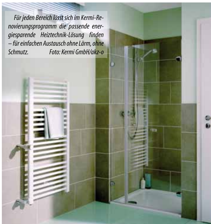
Für jeden Bereich lässt sich im Kermi-Renovierungsprogramm die passende energiesparende Heiztechnik-Lösung finden – für einfachen Austausch ohne Lärm, ohne Schmutz.