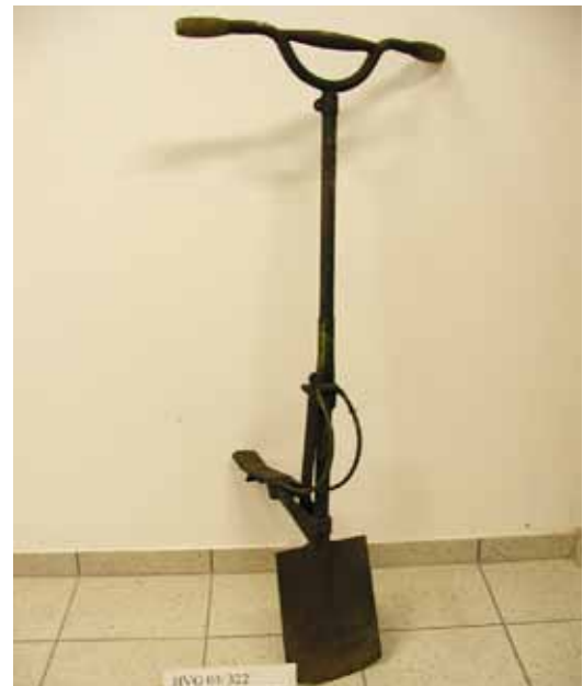
Objekt: Patentspaten; Material/Technik: Eisen, Stahl.

Öffnungszeiten: sonntags von 10.30 Uhr bis 12.30 Uhr und nach telefonischer Anmeldung (02802) 2604 oder 4073 oder 4403 In loser Folge werden hiermit die einzelnen Objekte einer größeren Öffentlichkeit vorgestellt.