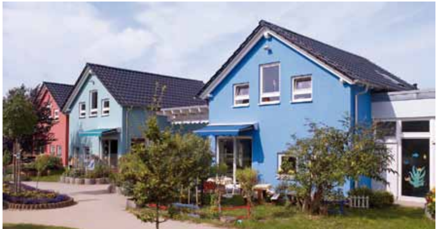
Wetterbeständig, diffusionsfähig, substanzschützend, so lauten die definierten Anforderungen an eine Fassadenfarbe. Hochwertige Produkte bringen Farbgestaltung und die Arbeit des Fachhandwerkers optimal zur Geltung.

die wichtigsten Merkmale der neuen Fassadenfarbengeneration zusammen: „Bislang hatte der Verarbeiter die Qual der Wahl zwischen Silikat- und Silikonharzfarben. Während Silikatfarben mit Eigenschaften wie hoher Wasserdampfdurchlässigkeit aufwarteten, punkteten Silikonharzfarben durch ihre hohe abweisende Wirkung, der geringen Kriechung, einfacher Verarbeitung und nahezu universellen Einsetzbarkeit“, erläutert Caparol-Farbexperte Kairies. Die neuartigen Werkstoffe mit Nano-Quarz-Gitter Technologie vereinen die herausragenden Vorzüge beider Farbtypen – und mit der neuen