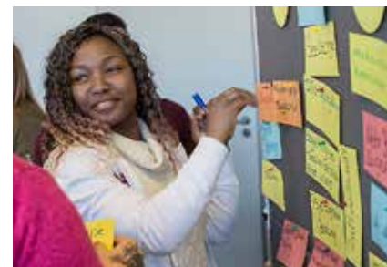
Mehr als 70 Fort- und Weiterbildungen bieten die Kaiserswerther Seminare an.

(lld) Wer auf der Suche nach einer Weiterbildung im Sozial- und Gesundheitswesen ist, sollte einen Blick ins neue Programm der Kaiserswerther Seminare werfen. 71 Fort- und Weiterbildungen bietet der zertifizierte Bildungsträger der Kaiserswerther Diakonie in den Bereichen „Systemisch beraten, therapieren, coachen und führen“, „Führen und organisieren“, „Lehren und anleiten“ und „Pflegen und betreuen“ an. Die Kurse richten sich an Fachkräfte aus Krankenhäusern, Altenheimen, ambulanten Pflegediensten, sozialen Diensten, Einrichtungen der Behindertenhilfe und Ausbildungsstätten für Gesundheitsberufe. Ob Ausbau von Beratungs- oder Führungskompetenzen, Weiterbildung in der Pflegepraxis oder Teamentwicklung – das Angebot ist vielfältig. Neu ist der Kurs „Traumapädagogik“, der