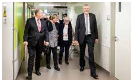
Beim Rundgang durch das Krankenhaus konnten sich die Gäste von den kurzen Wegen überzeugen.

(kb) 80 Millionen Euro hat die Kaiserswerther Diakonie in den letzten zehn Jahren in die umfassende Modernisierung mit Neubauten am Florence-Nightingale-Krankenhaus investiert. Mitte dieses Jahres ist der zweite Bauabschnitt des Projektes „Neuer Funktionstrakt“ abgeschlossen worden. „100 Tage im neuen Gebäude“ hat der Vorstand daher im November zum Anlass genommen, zum Herbstempfang mit Führungen einzuladen. Zu den Gästen gehörten Mitarbeitende, Politiker, beteiligte Firmen, Kooperationspartner, Freunde und Förderer sowie Repräsentanten der Stadt Düsseldorf und der evangelischen Kirche.