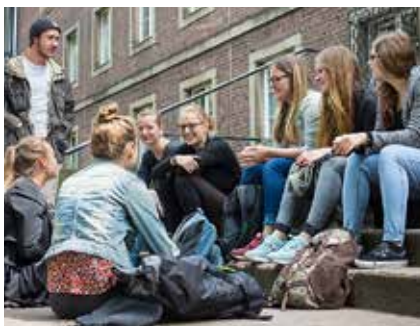
Die Projekte beim Innovationssemester an der FFH verbinden Wissenschaft und Beruf.

(dld) Zwei Projekte der Fliedner Fachhochschule Düsseldorf (FFH) sind Teil des neuen Lernformats „Innovationssemester“ am Bildungsstandort Düsseldorf und Region. Das Innovationssemester, initiiert vom Verein zur Förderung der Wissensregion Düsseldorf e. V., bringt zwei eigentlich voneinander getrennte Bildungswelten zusammen: Studierende der Düsseldorfer Hochschulen und Auszubildende aus verschiedenen Betrieben arbeiten gemeinsam an Projekten, bringen ihre jeweiligen Stärken ein und profitieren vom gegenseitigen Ideenaustausch. Im Oktober ist die Wissensregion Düsseldorf mit insgesamt acht Innovationsprojekten gestartet: Von der Entwicklung einer Einkaufs-App über nachhaltiges Bauen bis hin zu De-Eskalationsmaßnahmen für Krankenhäuser – die Palette an spannenden Themen ist groß. Die Fliedner Fachhochschule ist mit zwei Projekten aus den Studiengängen „Bildung und Erziehung in der Kindheit“ und „Medizinische Assistenz-Chirurgie“ dabei: Ziel des Projektes „Urban Gardening“ ist, ein Gartengrundstück der Kaiserswerther Diakonie ökologisch sinnvoll und nachhaltig zu bearbeiten. Beim Projekt „Integration gesundheitsfördernder Maßnahmen im Arbeitsalltag“ geht es um die Gesundheitsförderung in Düsseldorfer Betrieben und Hochschulen.