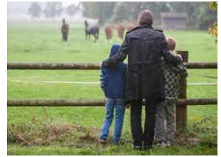
Gut Rosendahl betreut verhaltensauffällige Jungen.