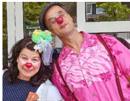
Die beiden Clowns zaubern den Bewohnern in Haus Salem Lintorf ein Lächeln ins Gesicht.

(he) Mit roter Pappnase, Herzmund im Gesicht und einer Ukulele unterm Arm sind regelmäßig zwei Clowns im Altenzentrum Haus Salem Lintorf unterwegs. Die beiden sind speziell ausgebildet im Umgang mit alten und an Demenz erkrankten Menschen. Bei ihrer „Visite“ durch die Wohnbereiche stehen Freude, Zuwendung und Humor im Mittelpunkt. Im Frühjahr startete im Lintorfer Altenzentrum das Pilotprojekt „Menschen Stärke geben! Clownvisiten in der stationären Pflegeeinrichtung“,