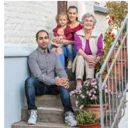
In guter Nachbarschaft leben die Bewohner des Fliednerhofs.

sagt sie. Viele dieser Menschen sind jedoch mittlerweile verstorben – daher heißt es nun für Frau Helbig, neue Kontakte aufzubauen.