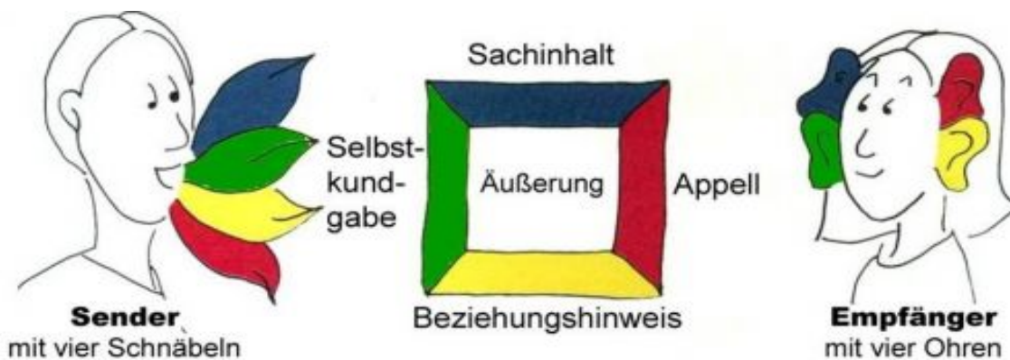
Abb. Kommunikationsquadrat nach Schulz von Thun