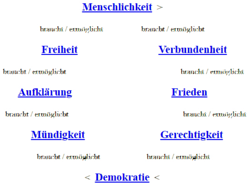
Abb. 3.2 Humanistisches Wertesystem nach Rudolf Kuhr

Ein Versuch einer Neuorientierung ist das Humanistische Wertesystem nach Kuhr 12 (s. Abb.)