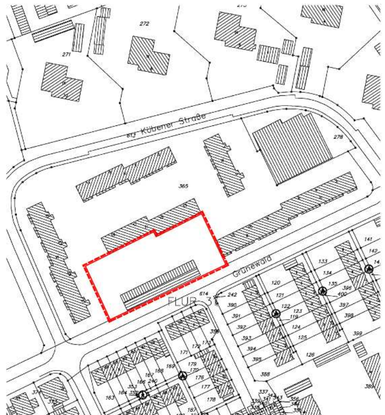
Bebauungsplan Nr. 63A, 1. Änderung für den Bereich Grünwald/ Köbener Straße - Plangebiet -

Hilden, den 13.12.2018 Die Bürgermeisterin Birgit Alkenings