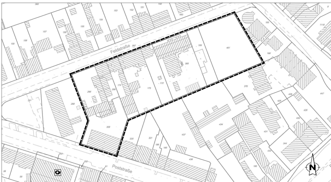
Bebauungsplan Nr. 10D für den Bereich südlich der Feldstraße Plangebiet (ohne Maßstab)

Der Entwurf des Bebauungsplanes inkl. Begründung kann mit den weiteren Unterlagen auch im Internet unter www.hilden.de/bplanverfahren => Hilden-Mitte => 10D eingesehen werden. Auf den zur Orientierung veröffentlichten Kartenausschnitt wird hingewiesen.