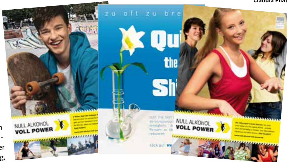
Alle drei Bilder zu Drogen & Sport sind Pressemotive der BzGA. Quellenangabe: © Bundeszentrale für gesundheitliche Aufklärung (BzGA), Köln

„Es gibt zahlreiche Beispiele von abhängigen Menschen, die entweder während ihrer Zeit als Leistungssportler eine Suchtmittelabhängigkeit entwickelt haben oder im Anschluss an eine Zeit intensiven Suchtmittelkonsums erst zum Leistungssport finden“, so Norbert Bläsing. „Diese ‚Vorbilder‘, wie der Fußball-Nationalspieler Uli Borowka oder der Weltklasse-Triathlet Andreas Niedrig, weisen häufig darauf hin, dass auch der Sport für sie eine suchttähnliche Erfahrung ist. Allerdings bedeutet sportliche Betätigung, solange sie sich in vertretbaren Bahnen bewegt, eine erheblich gesündere Lebensweise als ein von exzessivem Drogen- oder Alkoholkonsum beherrschtes Leben.“