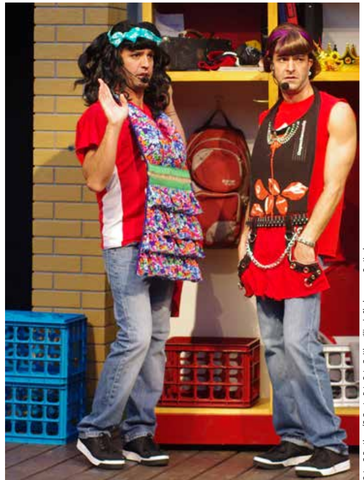
Foto: Q Brothers/Q Gents, Foto Pete Guither, Illinois Shakespeare Festival

den über Original-Musik gespielt, die von einem Live-DJ abgemischt werden. Sie nennen ihre Arbeiten „Add-Rap-Tations“.