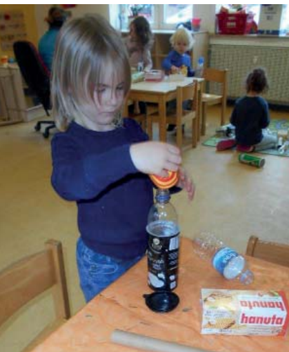
Aus einer leeren PET-Flasche lässt sich eine prima Raketenabschussbasis bauen.