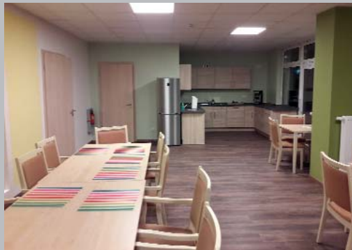
Blick in die neue Tagespflege „Am Alten Stellwerk“

Am 8. Januar eröffnete die neue Tagespflege „Am alten Stellwerk“ in Kapellen. Hier stehen in einem Neubau großzügige und behindertengerechte Räumlichkeiten für 14 Tagesgäste zur Verfügung. Die Künstlerin Moni Müller setzte ein Farbkonzept um, das Orientierung gibt und – je nach Räumlichkeit – beruhigend oder anregend wirkt. Der Gartenbereich bietet u.a. einen