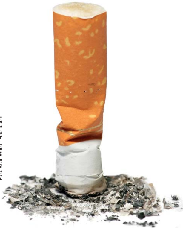
Rauchfrei in sechs Wochen: Das ist möglich. Die Fachambulanz für Suchtkranke bietet ein entsprechendes Kursprogramm zur Entwöhnung.

schung, München, in Zusammenarbeit mit der Bundeszentrale für gesundheitliche Aufklärung (BZgA) entwickelt und beinhaltet neueste wissenschaftliche Erkenntnisse. Der Kurs ist als Präventionsmaßnahme anerkannt und wird von den Krankenkassen bezuschusst. „Das Rauchfrei Programm“ wird in der regionalen Presse im Rhein-Kreis