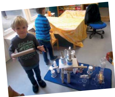
Hier wächst ein Turm aus Küchen- und Klopapierrollen und Plastikbechern.