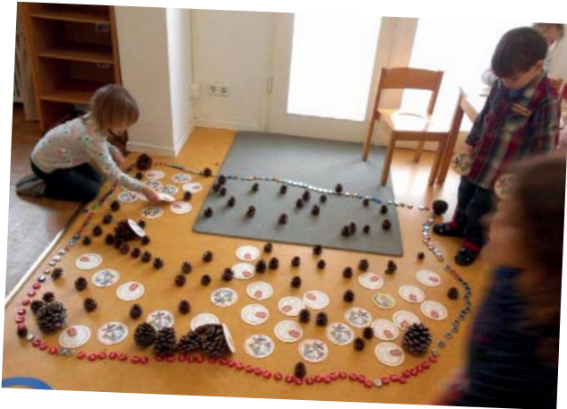
Eine Traumlandschaft aus Tannenzapfen, Bierdeckeln und Kronkorken.