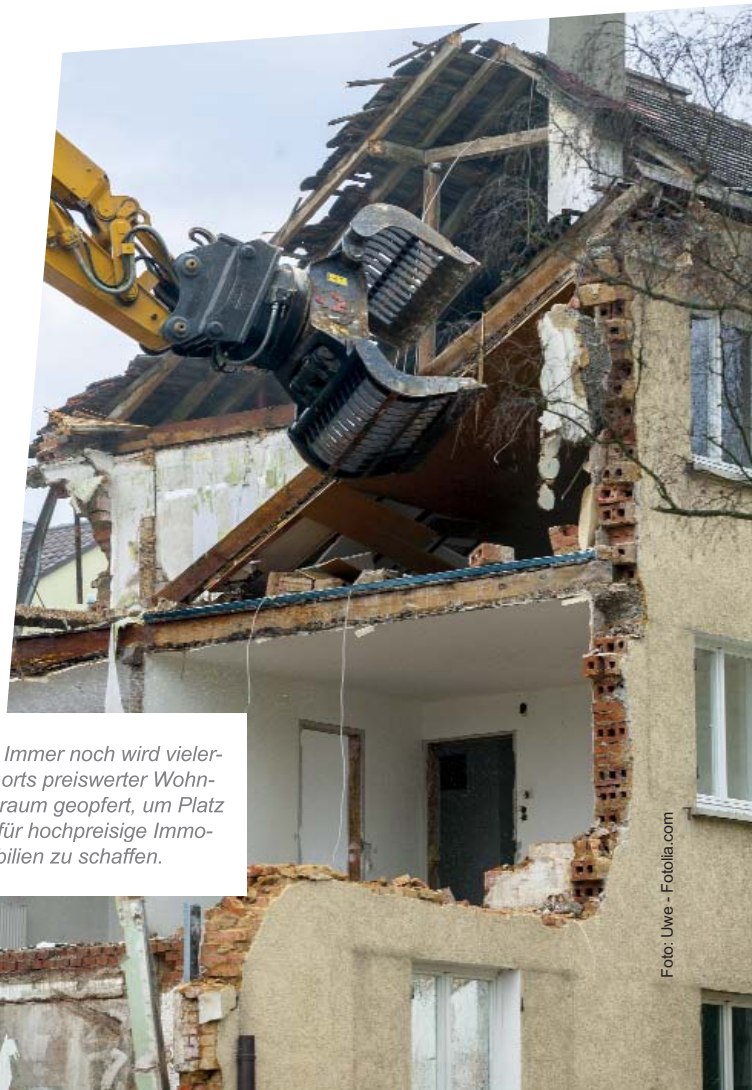
Immer noch wird vielerorts preiswerter Wohnraum geopfert, um Platz für hochpreisige Immobilien zu schaffen.