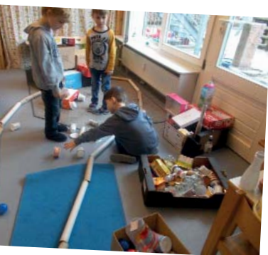
Hier entsteht ein Hindernisparcours aus Küchenrollen und Joghurtbechern.