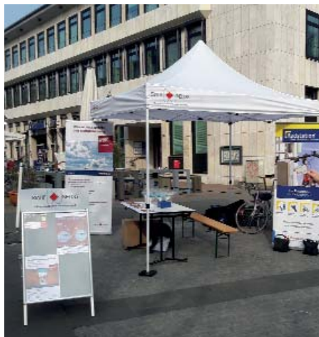
Stand der Radstation auf dem Marktplatz.

Die Radstation stellte die nötigen Werkzeuge zur Verfügung und unterstützte die Schüler bei der Reparatur und Instandsetzung. Nach Abschluss der vom Umweltamt der Stadt Neuss geförderten Aktion