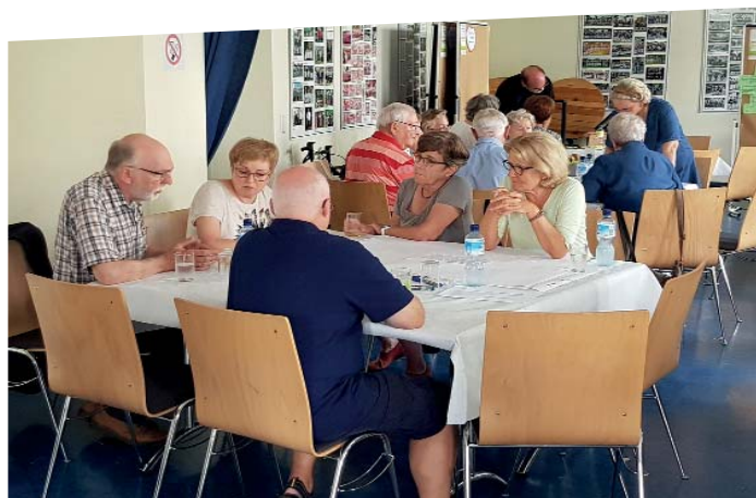
In Kleingruppen diskutierten die Teilnehmer über Ziele, Herausforderungen und Wünsche für Büttgen.