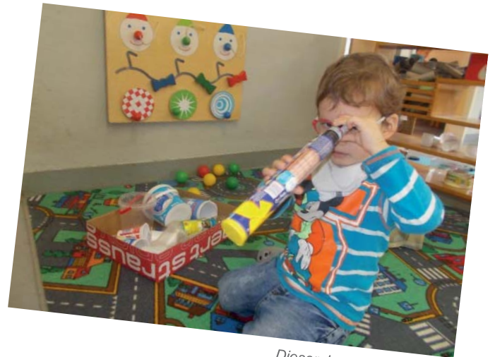
Dieser Jungforscher bastelt ein Fernrohr aus einem Schokolinsenbehälter.