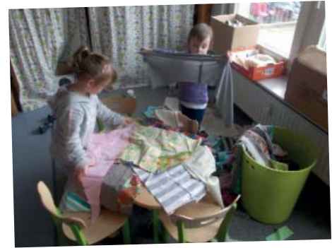
Diese beiden Modedesignerinnen schaffen neue Kreationen aus alten Stoffresten.