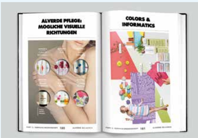
Projekt: Alverde Relaunch: Strategie / Packaging concept / Design Entwicklung von trendbasierten Verpackungskonzepten und Design Richtungen für den Relaunch der dm-Eigenmarke Alverde.