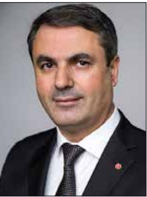
Ibrahim Baylan, Energieminister