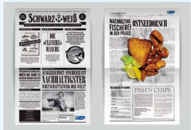
Projekt: Marine Stewardship Council: Kampagne Deutschland, Österreich und Schweiz. Kommunikationskonzept und Design für verschiedene Werbematerialien für die MSC Kampagne 2013.