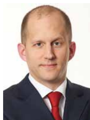
Dr. Jon Marcus Meese Baker & McKenzie www.bakermckenzie.com

3. Wir beobachten zurzeit, dass schwedische E-Commerce Unternehmen auf die deutschsprachigen Märkte vordringen. Der Internethandel unterliegt in Deutschland anderen und teilweise auch strengeren Regeln als in Schweden. Wer auf dem deutschsprachigen Markt erfolgreich sein will, muss sich mit diesen rechtlichen Vorschriften eingehend befassen und auch alle sonstigen Gepflogenheiten beachten. Die Umsetzung des Angebotes und der rechtlichen Grundlagen in die deutsche Sprache ist wesentlich, englisch genügt nicht. Auch praktische Fragen spielen eine Rolle, insbesondere im Zusammenhang mit dem Kundensupport und den denkbaren Zahlungssystemen.