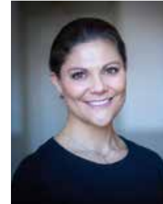
Kronprinzessin Victoria von Schweden