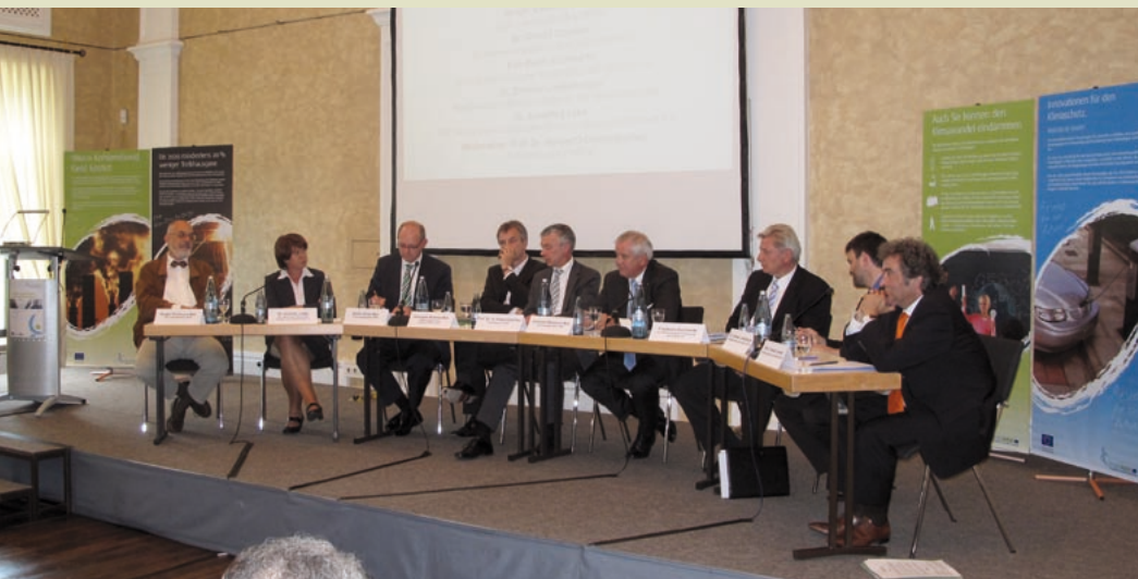
Die Experten auf dem Podium diskutierten angeregt über den Klimaschutz.

23. Juni 2009 – „Klimaschutz – Trotz oder wegen der Finanzkrise?“ Diese Frage stand im Mittelpunkt einer Konferenz, die der Landtag Nordrhein-Westfalen gemeinsam mit der Europäischen Kommission veranstaltet hat. In Mönchengladbach kamen Sachverständige aus Politik, Wirtschaft und Wissenschaft zusammen, um in wirtschaftlich schwierigen Zeiten über mögliche Konzepte gegen den Klimawandel zu diskutieren. Auch wenn die Vorschläge der Expertinnen und Experten unterschiedlich ausfielen, so machten sie doch alle deutlich: An gemeinsamen europäischen und globalen Anstrengungen für mehr Klimaschutz führt kein Weg vorbei.