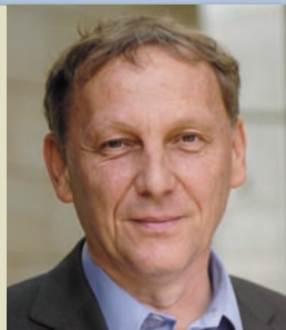
Reiner Priggen (Grüne)

... werden die Folgen katastrophal sein: eisfreie Polargebiete, überflutete und unbewohnbare Küstenregionen, abwechselnd schwere Dürren und Überschwemmungen, Hunderte Millionen Klimaflüchtlinge. Die Kosten für den Klimaschutz sind dagegen geradezu eine Kleinigkeit.