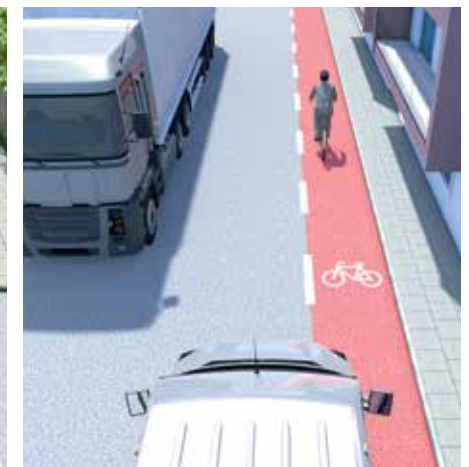
Schutzstreifen für Radfahrer