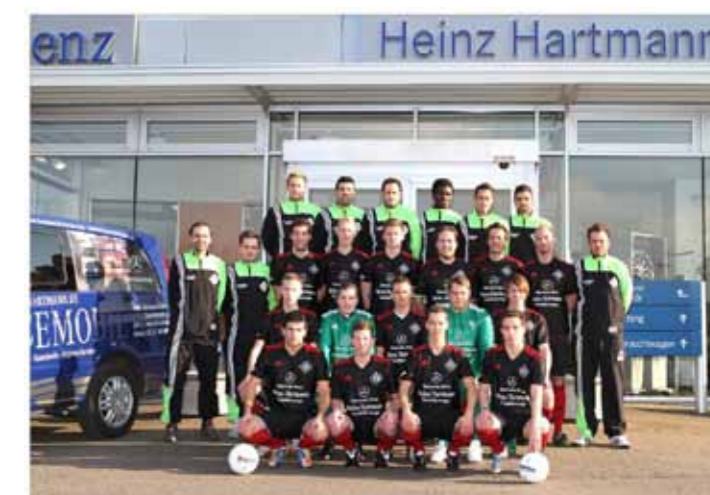
Die 1. Fußballmannschaft