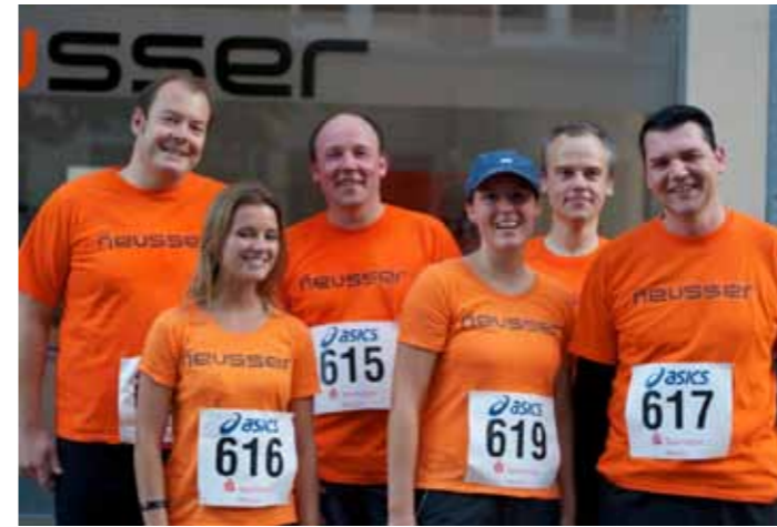
Das Der Neusser-Team beim Sommernachtslauf 2011