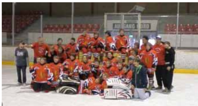
Jugendbereich - Knabenmannschaft 2011/12