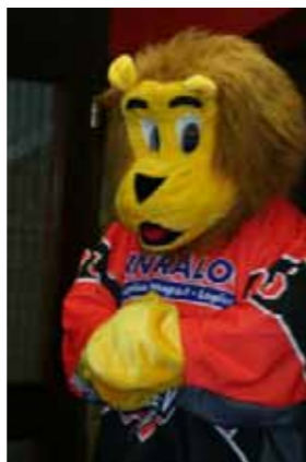
Das Maskottchen und Werbung auf den Neusser Bussen