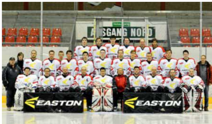
1. Mannschaft Saison 2011/12

Die SWN hat den Eissporttreibenden Vereinen eine Busbeklebung gesponsert, der Bus fährt jetzt durch Neuss- alles mit Neusser Spielern und Eistänzern beklebt (siehe Bild)