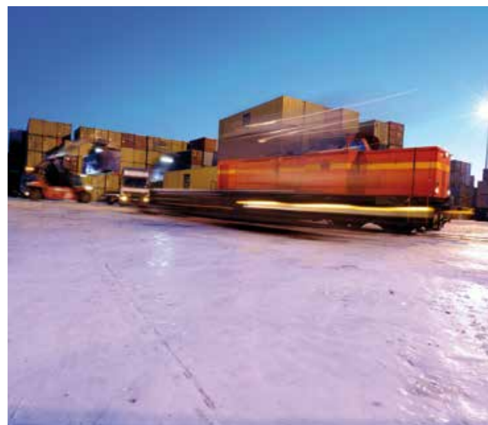
Neusser Containerterminal Eisenbahn