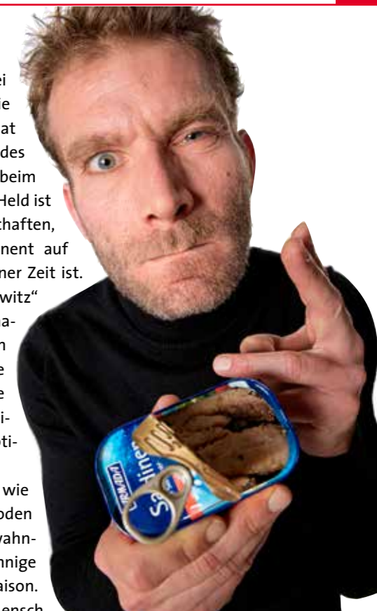
Imagefoto zu „Der nackte Wahnsinn“

Lebens zu schauen. Bei Michel Decar liegt die Geschichte anders. Er hat den gängigen Begriff des flexiblen Menschen beim Wort genommen. Sein Held ist ein Mann ohne Eigenschaften, aber einer, der permanent auf der Suche nach verlorener Zeit ist. Sein Stück „Jenny Jannowitz“ verschiebt die Koordinaten und entwirft einen satirischen Blick auf die Flüchtigkeit der Zeit, die anhaltende Beschleunigung und die Selbstoptimierung. Um tapfere Helden wie auch um ihre Antipoden – Fanatiker, Größenwahnsinnige und Leichtsinnige – geht es in dieser Saison. Auch darum, ob der Mensch gut oder böse ist und ob er die Wahl der Entscheidung hat. Eine Frage, der sich die amerikanische Familiensaga „Jenseits von Eden“ über drei Generationen widmet. Der Bogen ist weit gespannt in dieser Spielzeit und angereichert mit attraktiven Stücken, was schon der Saisonauftakt beweist.