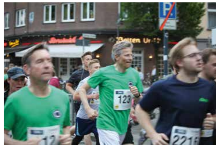
Auch sportlich ist der aktuelle Schützenkönig oft zu sehen – wie hier beim Sommernachtslauf