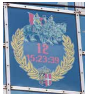
Das Königsgeschenk: Die Countdown-Uhr zum Schützenfest am Rathaus zum Zeitpunkt des Interviews

ohne Standesdünkel und Machtbestreben. „Mir ist wichtig, dass ich „Ich“ bleibe und weiterhin als einer der Schützen wahrgenommen werde.“