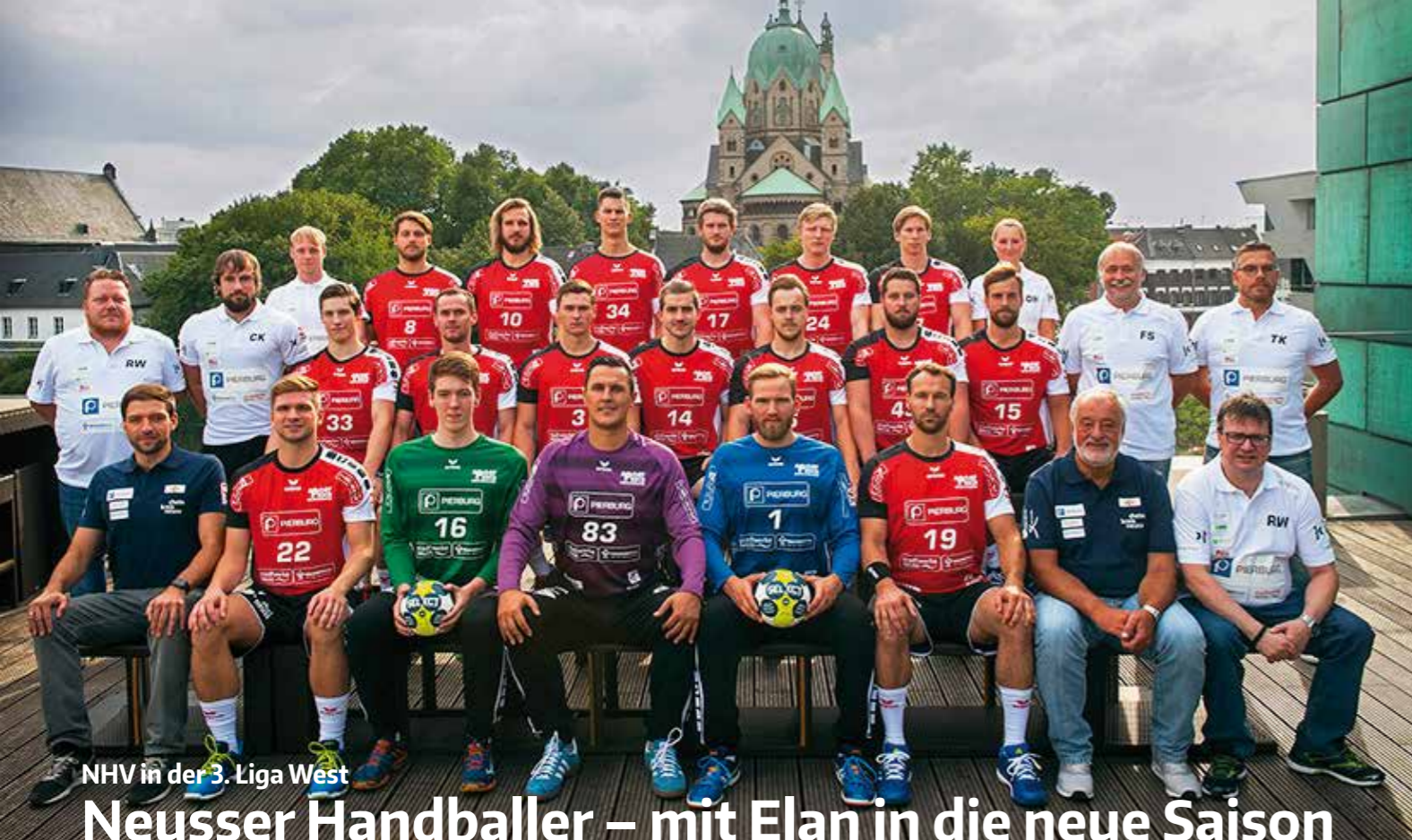
NHV in der 3. Liga West