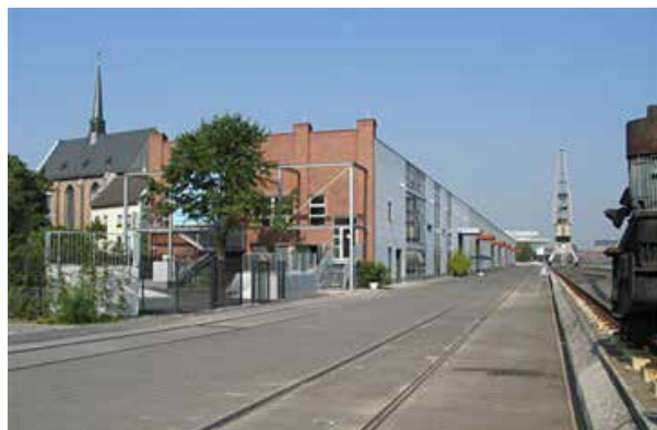
Das Greyhound Pier 1 am Hafen

Einer der Orte ist der erst letztes Jahr angelegte Hafencampus Neuss am Hafenbecken I. Für die Kleineren gibt es ein Klettergerüst, Schaukeln und einen Wasserspielplatz. Den Jugendlichen stehen Fußballplatz und Sitzgelegenheiten zur Verfügung. Der Park