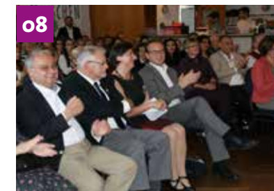
Gelebte Integration – der Verein SUM