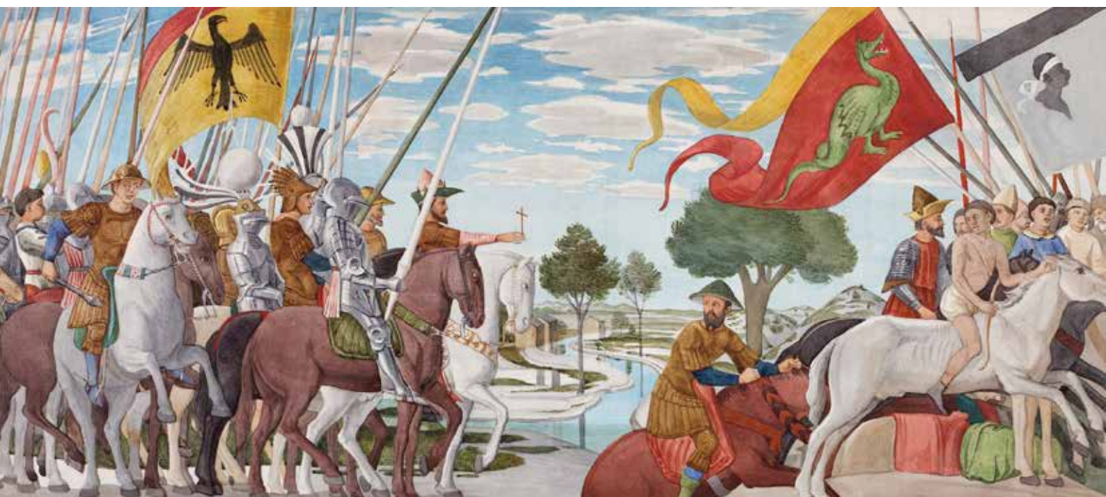
Sieg des Kaisers Heraclius über den Perserkönig Chosroes

2016 jährt sich der Todestag von Johann Anton Ramboux (1790–1866) zum 150. Mal. Ein Künstler aus Trier, der dem Rheinland die Schätze Italiens auf ungewöhnliche Art näherbrachte und eine besondere künstlerische Offerte hinterließ: das „Museum Ramboux“, einzigartige Nachempfin-