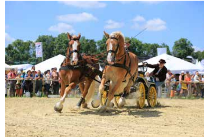
Pferdeliebhaber werden begeistert sein

Alle zwei Jahre wird das Rheinland zum Zentrum für Reiter und Pferdeliebhaber aus ganz Deutschland: Die EQUITANA Open Air bringt vom 20. bis 22. Mai mehr als 1.000 Pferde und ihre Fans auf dem Neusser RennbahnPark zusammen. Deutschlands größtes Pferdesportfestival zeigt den Reitsport in all seinen Facetten, ist Treffpunkt für Pferdefans und Familienevent mit dem Flair eines Open Air Festivals. Mehr als 40.000 Besucher werden erwartet, wenn Reitponys, Island-