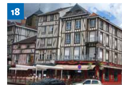
Neue Serie: Partnerstädte