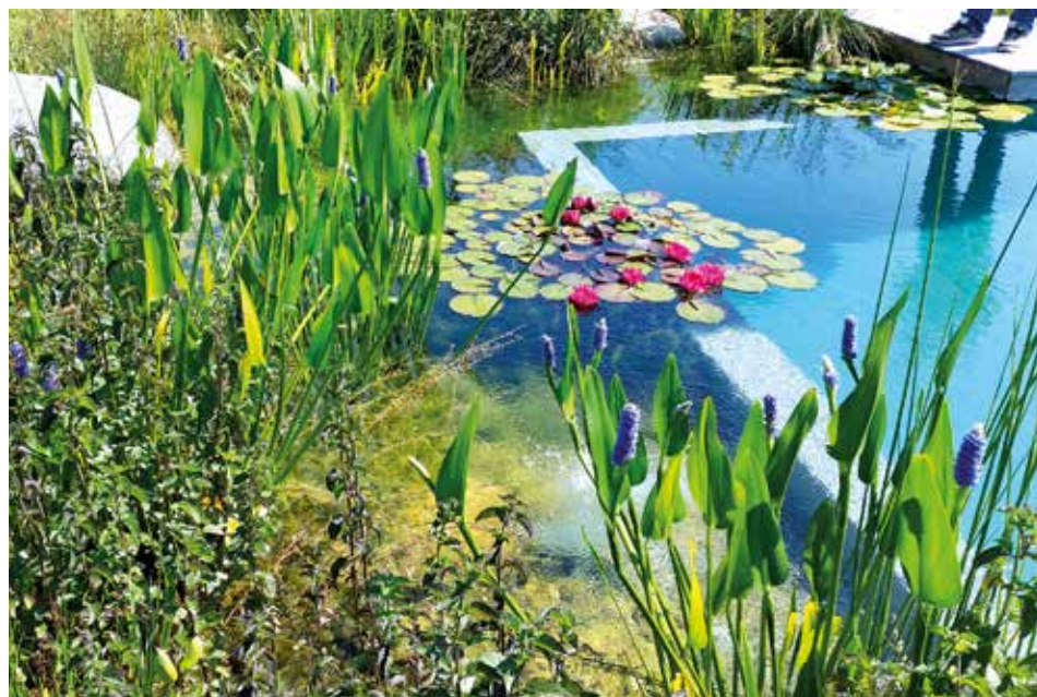
Ein Schwimmteich im eigenen Garten – ein erfrischendes Vergnügen, realisiert von Galabau Riße