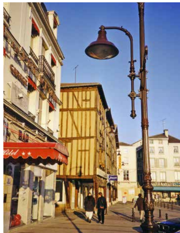
Idyllische Straßen und Plätze machen den Bummel durch Châlons zu einem schönen Erlebnis

und der Neusser Eifelverein hatte Besuch von den „Amis de la Nature“, um nur einige Begegnungen zu nennen.