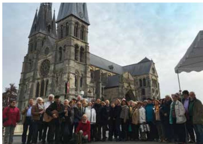
Die Teilnehmer des diesjährigen „Bus nach Châlons“ vor der Stifts- und Wallfahrtskirche Notre-Dame-en-Vaux