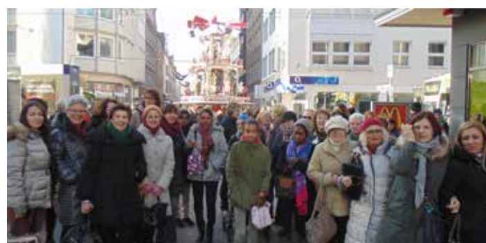
Weihnachtsfeier der CareMigration auf dem Düsseldorfer Weihnachtsmarkt

Weil man sich auch im Jahr Eins nach dem 10-jährigen Jubiläum nicht zurücklehnt, sondern kontinuierlich stärker aufstellt, sucht man stetig nach neuen InteressentInnen mit und ohne Migrationshintergrund.