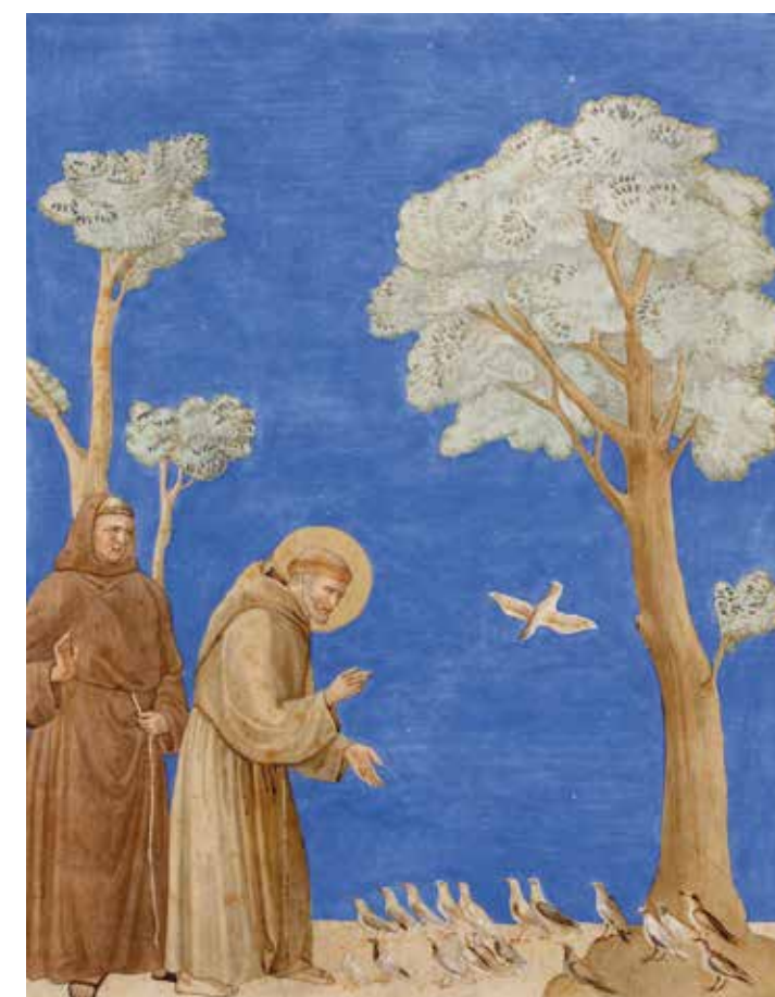
Der hl. Franziskus predigt den Vögeln