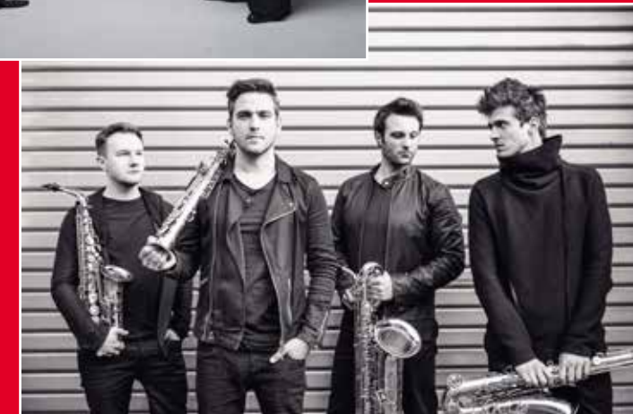
Signum Saxophone Quartet