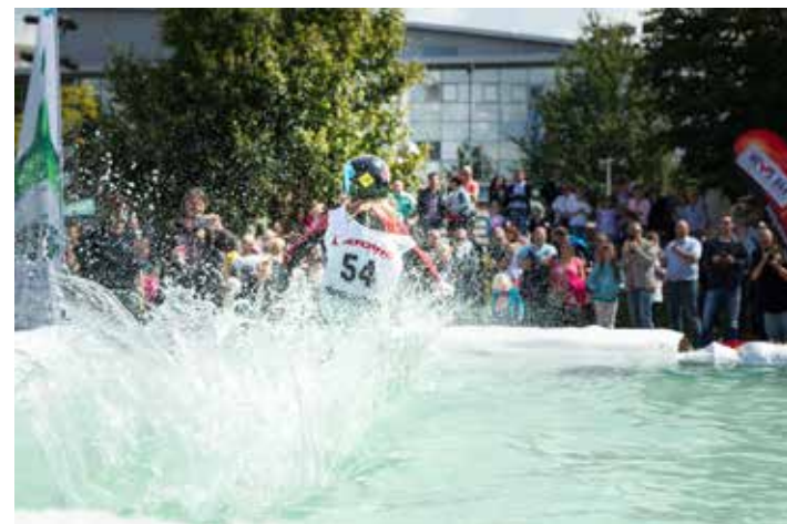
Erfrischender Spaß beim Waterslide

Am 18. Juni fahren mutige Snowboarder und Freeskier mit spektakulären Stunts wieder von der Schneerampe über das Wasserbecken. Wer genügend Schwung bekommt, schafft es über das ca. zehn Meter lange Wasserbecken, wer nicht, wird nass. Neu beim JEVER FUN Waterslide ist heuer die Lokation. Mitten in Neuss, auf dem Marktplatz, wird die Rampe und das Wasserbecken aufgebaut. Am 18. Juni ab 12.00 Uhr laden die Skihalle Neuss und Neuss Marketing die Neusser zu dem originellen Fun-Event bei freiem Eintritt ein.