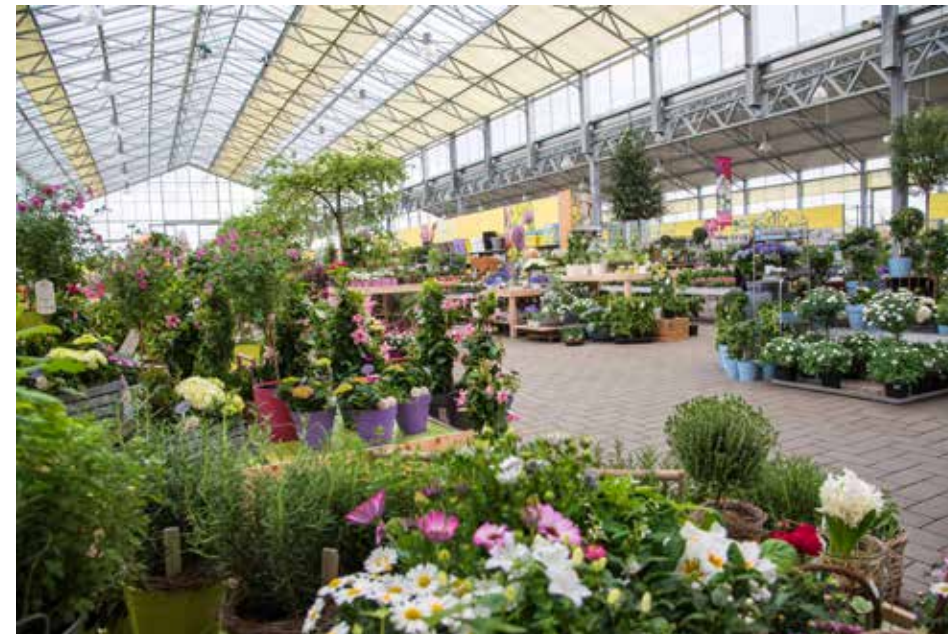
Ein riesiges Angebot in den Hallen und auf dem Außengelände bietet das Pflanzencenter Schmitz

Für die Privatsphäre im Garten sorgen Heckpflanzen wie Thuja, Hainbuche, Eibe