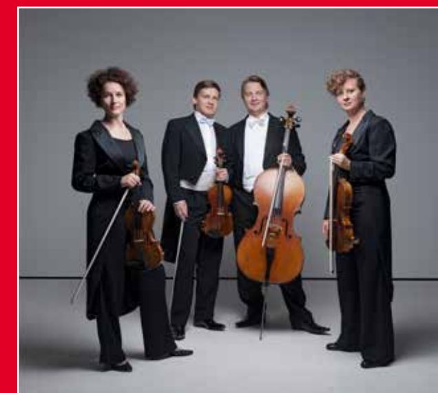
Asasello Quartett