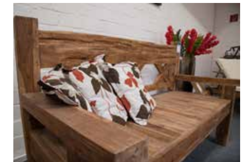
Eine der Jumbo-Gartenbänke aus alten Teakhölzern, die der Holzfachmarkt Jungbluth anbietet

Einfach hinstellen, die Beine hoch legen und ausspannen! – Viel schöner kann es an Ost- oder Nordsee auch nicht sein!