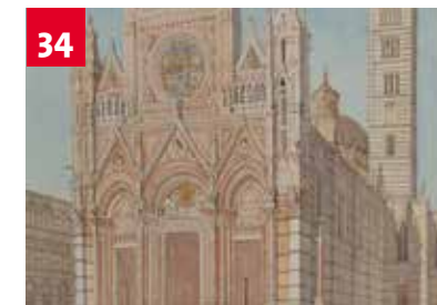
Ausstellung im Clemens Sels Museum