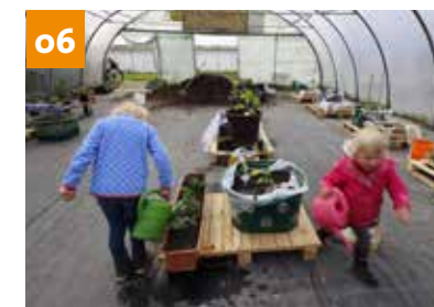
Urban Gardening in Neuss