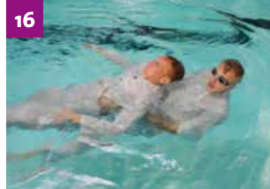
Lothar in Gefahr