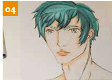
Zeig, was in dir steckt!