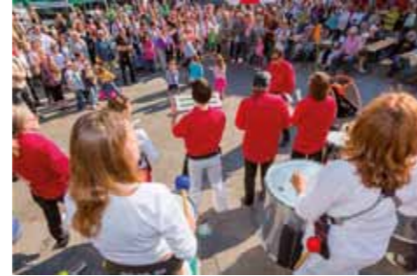
Bunte Vielfalt beim Frühlingsfest der Kulturen