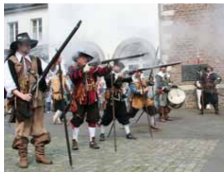
Interessante Einblicke in die Geschichte der Stadt bei den Zeitsprüngen

...und auch das Frühlingsfest der Kulturen, welches am gleichen Tag stattfindet! Unsere Stadt ist bunt – wenn das kein Grund zum Feiern ist. Eben! Unter dem Motto „Die Zukunft sind wir: Jugend in Neuss!“ bevölkert das Frühlingsfest der Kulturen bereits zum