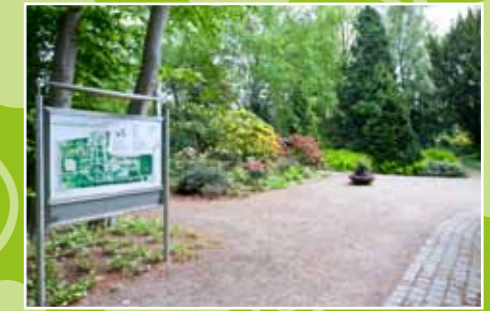
Etwas versteckt: Der Botanische Garten

Hundebesitzer führen ihre Vierbeiner dort aus, daher ist es ratsam, eine Decke zu nutzen, um sich auf die Wiese zu legen.