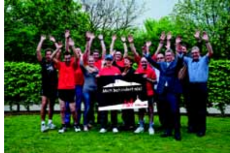
Sportliche Stimmung beim Sommernachtslauf