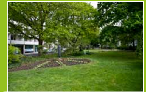
Am Berliner Platz