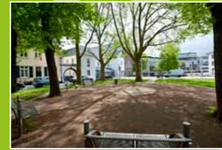
Auch am Freithof findet sich viel Grün