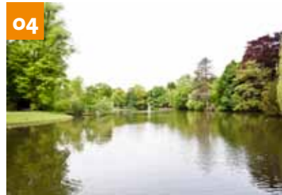
Neusser Grünflächen und Parks