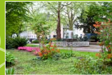
Lauschiges Plätzchen an der Drususallee