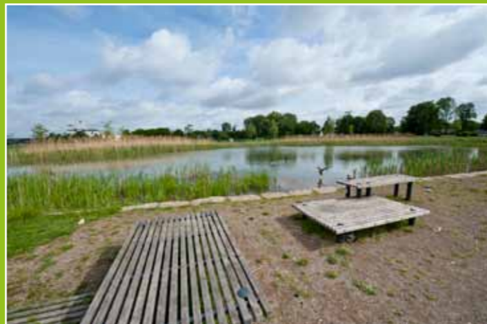
Im RennbahnPark gibt es vielfältige Möglichkeiten, aktiv zu werden, aber auch zum Entspannen