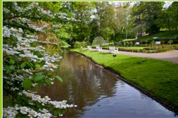
Der Rosengarten – der ideale Platz für alle Rosenliebhaber