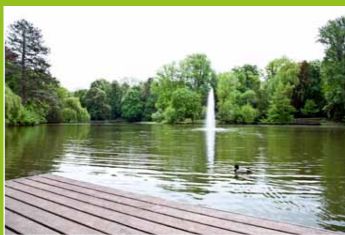
Im Stadtgarten gibt es viele schöne Ecken zum Entspannen

Ebenfalls im Dreikönigenviertel liegt eine kleine Grünanlage, die mit alten Bäumen, einer Wiese, Bänken und einem Spielplatz aufwartet. Zwischen der Straße „An der Obererft“ und der Simrockstraße gelegen, ist dies eine Platz, um unter viel grün Ruhe zu finden. Viele