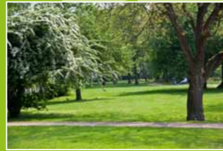
Die Neusser Weyhe in der Nordstadt