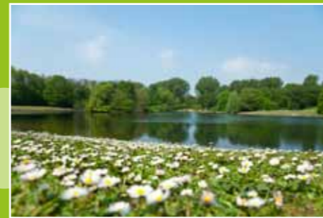
Das Iröne Merke in der Nordstadt