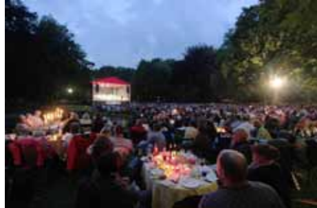
Feierliche Atmosphäre bei der Klassiknacht