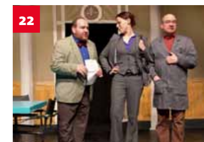
Neues aus der Rathauskantine