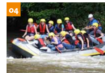
Outdoor-Aktivitäten in Neuss