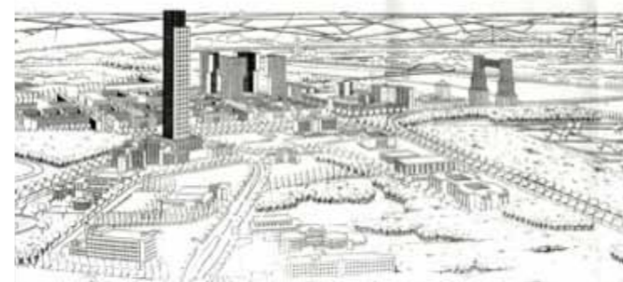
Vision der 10er Jahre: Neuss zwischen den Häfen