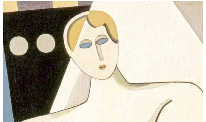
Detail aus dem Ausstellungskatalog STURM-FRAUEN

„Sehen Sie, Fräulein, es gibt zwei Arten von Malerinnen, die einen möchten heiraten und die anderen haben auch kein Talent.“ Was der „Simplicissimus“ 1901 schrieb, entsprach dem Zeitgeist Anfang des 20. Jahrhunderts. Bis zum Ende des Kaiserreichs 1919 war es Frauen verboten, an deutschen Kunstakademien