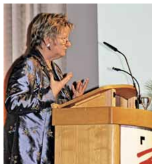
Ministerin Sylvia Löhrmann.

Bleibt die Freude, dass es das Zentrum gibt! Aber auch die Hoffnung, dass künftig anders gearbeitet wird als mit Ausstellungen und Veranstaltungen ausschließlich zum Thema Holocaust. Die sind wichtig und notwendig. Aber das können etablierte Einrichtungen, wie etwa die Jüdischen Museen, seit langem weitaus besser, da sowohl finanziell wie auch vor allem personell mit hoher Fachkompetenz entsprechend ausgestattet. Der Misserfolg ist bekanntlich ein Waisenkind. Der Erfolg jedoch hat viele Väter und Mütter. So ist es auch hier. Allen sei gedankt, die sich als Mäzene und Sammler für das „Zentrum“ eingesetzt haben. Dennoch bleibt es „mein Kind“, das nach altem Gesetz