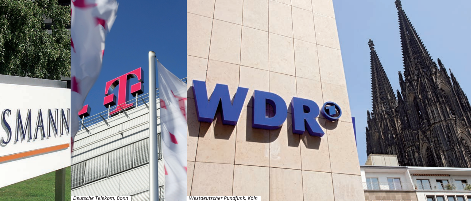
Deutsche Telekom, Bonn