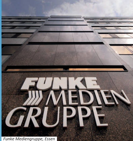
Funke Mediengruppe, Essen