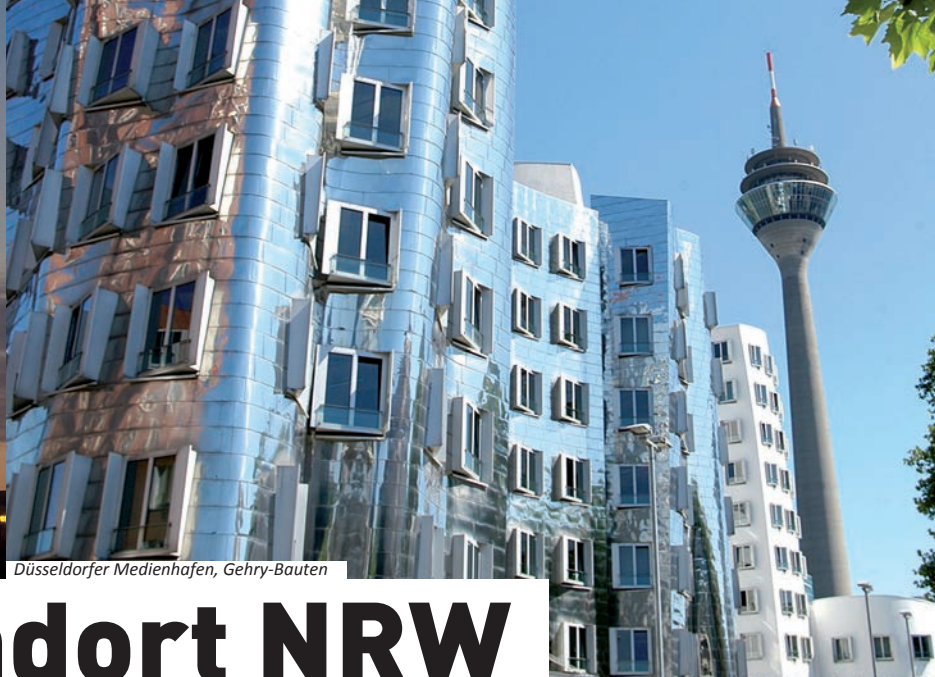
Düsseldorfer Medienhafen, Gehry-Bauten