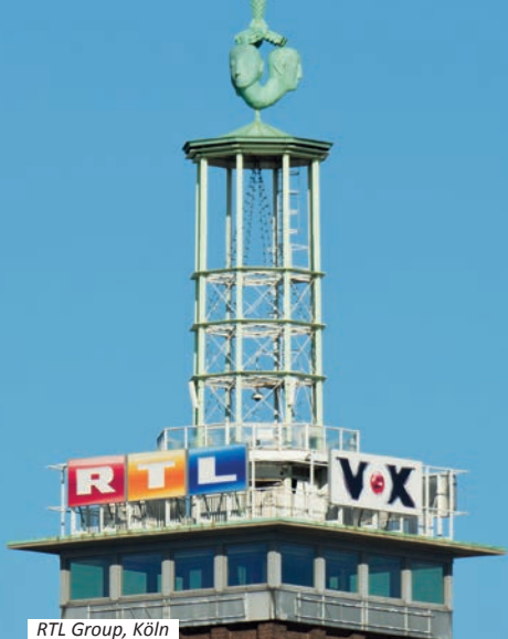
RTL Group, Köln