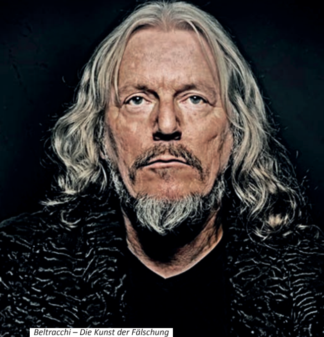
Beltracchi – Die Kunst der Fälschung