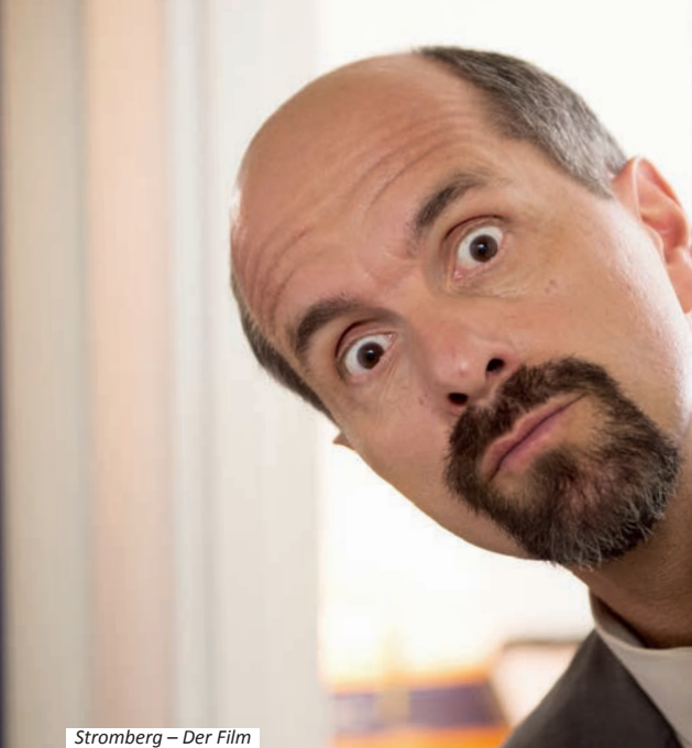
Stromberg – Der Film