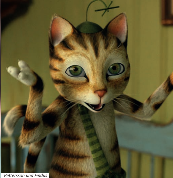
Pettersson und Findus