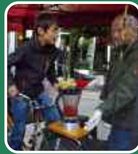
Reformations- woche: Abend der Begegnung Mit ÖkoGruppe Smoothies