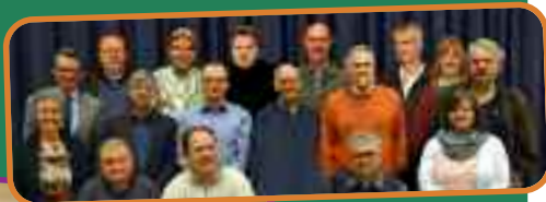
Der Bevollmächtigten-Ausschuss der Ev. Auferstehungs-KGM

Unsere Feier endet im Anschluss mit Andacht, und wir werden mit Gebet in die beginnende gemeindliche Arbeit gesendet – getreu dem Motto „Auferstehung mitten im Leben“.