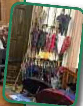
Abend mit Anselm Grün

Liebe „Luthers“, ich war heute bei Ihnen zu Gast und möchte mich für die liebvolle Gast- freundschaft bedan- ken. Ich habe einiges an neuen Dingen erfahren und Wissen aus der Schulzeit wurde wiederaufge- frischt. Die einzelnen Etappen der Führung mit den zeitgemäßen Kostümen und auch Darstellungen aus Luthers Leben haben mich schon sehr beeindruckt. Wieviel Mühe haben Sie sich gemacht, den Weg von Martin Luther aufzuzeigen.