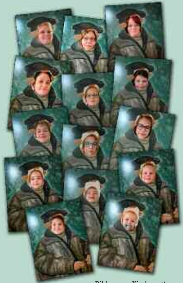
Bilder vom Kindergottesdienst zum Thema Martin Luther am 07.10.2017

Beim Reformationsgarten wurde der Wein durch Wasser ersetzt und ein bisschen Pfeffer hinzugefügt. Als vegetarische Variante wurden die Schinkenwürfel durch leicht angebratene, mit Salz und Pfeffer gewürzte Zwiebeln ersetzt und der Käseanteil auf 200g erhöht.