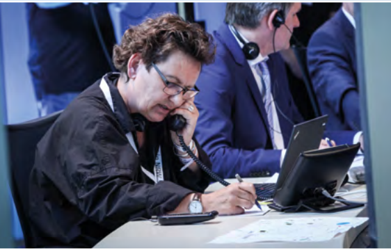
Blick ins ARD-Wahlstudio (Bild unten, v.l.): Hannelore Kraft (SPD), Armin Laschet (CDU), Moderator Frank Plasberg, Christian Lindner (FDP), Sylvia Löhrmann (Grüne) und Marcus Pretzell (AfD).

Die vielen Gäste in Bürger- und Wandelhalle, darunter aktuelle und ehemalige Abgeordnete, Weggefährten und Bundesprominenz, stehen in Grüppchen zusammen, sie diskutieren, spekulieren, rechnen: CDU und FDP hätten zusammen eine hauchdünne Mehrheit – allerdings nur, wenn die Linken an der Fünf-Prozent-Hürde scheitern, was letztlich auch geschieht. Eine große Koalition aus CDU und SPD wäre ebenfalls denkbar. Für Gesprächsstoff ist also gesorgt.