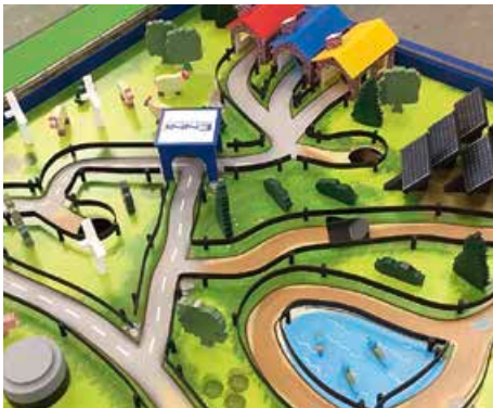
Beim Geduldsspiel in XXL ist Teamgeist gefragt.

gewinnen: Im Laufe der Veranstaltung sind alle eingeladen, eine Karte auszufüllen. Sie wird in die Verlosung gegeben, und am Ende des Tages heißt es, Daumen drücken. Dann werden die Sieger gezogen! Zu gewinnen gibt es etwa eine Fahrradlampe zum Kurbeln, an der man auch ein Handy aufladen kann, oder als Hauptpreis ein praktisches Wurfzelt, für alle, die gern campen.