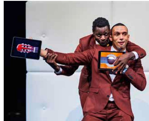
Zwei Schauspieler zaubern auf der Bühne mit ihren iPads, bis sich die Technik am Ende verselbstständigt.

Am Ende des Festivals kürt eine Profi-Jury die besten Stücke und Darsteller. Preisgelder gibt es in Höhe von 10.000 Euro. Den Publikumspreis vergeben sieben junge Leute zwischen 13 und 18 Jahren. Jedes der zehn Festival-Stücke, acht sind für Jugendliche, wird von einer Moerser Schulklasse begleitet. Und noch ein Tipp: Sonntag ist Familientag, unter anderem mit einem Stück für Babys ab acht Monaten in der Aula des Gymnasiums in den Filder Benden.