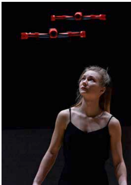
Wer ist überzeugender auf der Bühne? Mensch oder Drohne?

Weitere Infos zu Stücken und Spielorten auf www.westwind-festival.de ; Tickets gibt es an der Theaterkasse, an der Tages- und Abendkasse sowie online unter www.schlosstheater-moers.de