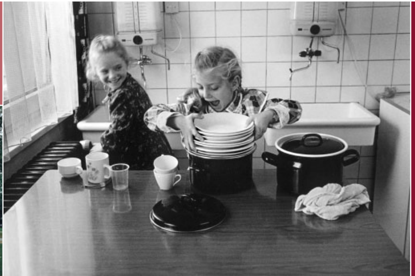
Spülende Mädchen aus Kasachstan in der Lagerunterkunft, 1990er Jahre.