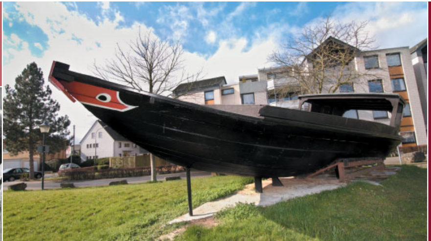
Gestrandet in Troisdorf. Das letzte Flüchtlingsboot, das Ende April 1982 im südchinesischen Meer von der Cap Anamur mit 52 vietnamesischen Flüchtlingen aufgefunden wurde .