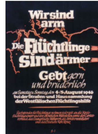
Plakat einer Straßensammlung für Flüchtlinge in Westfalen im August 1946.

Kriegsende 1945 – auf der Potsdamer Konferenz beschließen der britische Premier Attlee, US-Präsident Truman und der sowjetische Diktator Stalin die „Umsiedlung“ der deutschen Bevölkerung aus den nunmehr zu Polen bzw. der Sowjetunion geschlagenen bisherigen Ostgebieten des Deutschen Reiches und aus der Tschechoslowakei sowie aus Ungarn, was eine Vertreibungswelle mit all ihren Schrecken auslöst. In der britischen Besatzungszone sollen 1,5 Millionen Deutsche aus Schlesien und anderen Regionen aufgenommen werden. Die Militärbehörden geben dieser Ausweisungsaktion den Code-Namen „Operation Swallow“ (Schwalbe). In Siegen wird die ehemalige Kaserne am Wellersberg notdürftig als Hauptdurchgangslager für die Provinz Westfalen