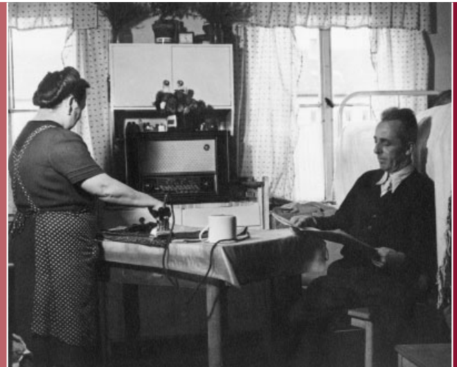
Lager Massen im September 1954. Eintrag von Deutschen aus Rumänien in die Lob- und Beschwerdebücher.

„Wir wandern schon vierzehn Jahre umher und finden keine Heimat mehr. Nach sieben Monate und eine Woche Aufenthalt im Lager Massen wollen wir Abschied nehmen und nach Neheim Hüsten weiterziehen um dort endlich unsere neue Heimat zu finden.“