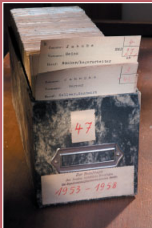
Kartei für Flüchtlinge des Bundesnotaufnahmeverfahrens. Aufbewahrt im Dokumentationszentrum der Landesstelle.

Zwischen 1949 und dem Mauerbau 1961 kommen 711.402 Personen über Notaufnahmegeräte nach Nordrhein-Westfalen.