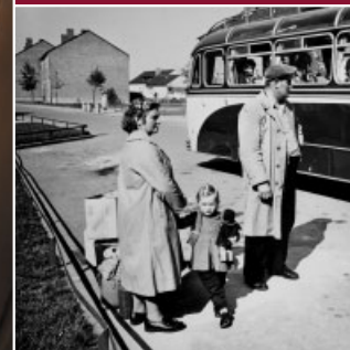
Ankunft im Lager Massen.