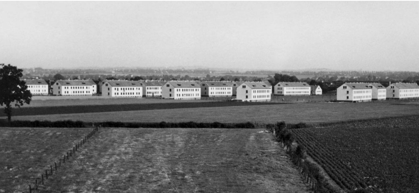
Hauptdurchgangslager Unna-Massen, Ausdehnung nach Beendigung des ersten Bauabschnittes 1951.