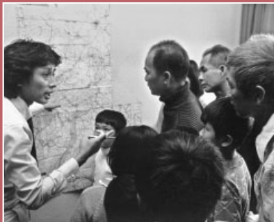
Der Dolmetscher in Bergkamen-Oberaden.

Nach öffentlichen Protesten kann die Hilfsaktion noch bis 1986 fortgeführt werden. Zwischen 1979 bis 1986 wird die Cap Anamur zur Rettung für 10.375 Menschen. Die meisten der Flüchtlinge leben noch heute in Deutschland, viele dürfen im Laufe der Jahre ihre Familienangehörigen nachholen.