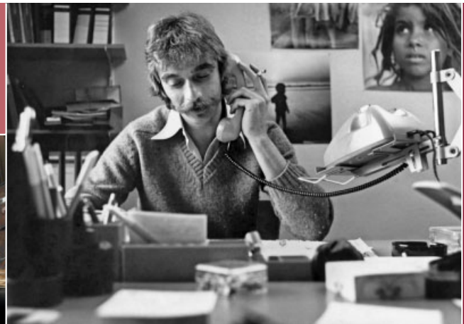
Büro der Landesstelle in den 1980ern.