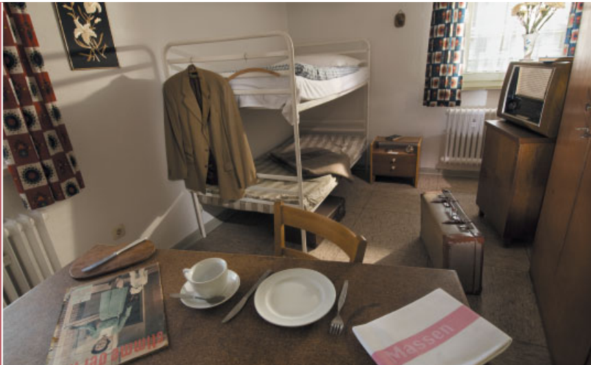
Nachgestellte Flüchtlingsunterkunft im Dokumentationszentrum der Landesstelle.

Gesetz über die Angelegenheiten der Vertriebenen und Flüchtlinge (Bundesvertriebenengesetz) tritt in Kraft. Bis heute zentrale Rechtsgrundlage für die Aufnahme von Flüchtlingen, Übersiedlern, Vertriebenen und Spätaussiedlern.