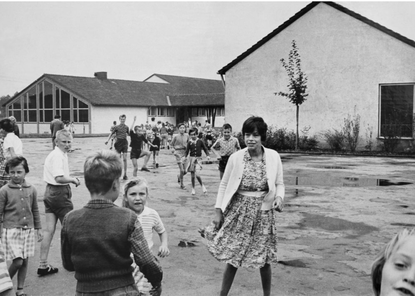
Auf dem Schulhof der Gerhart-Hauptmann-Schule.