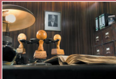
Nachgestelltes Büro aus den 1960ern im Dokumentationszentrum Unna-Massen.

Von linken Gruppen euphorisch begrüßt, von Rechten beschimpft, und von Vertriebenenvertretern als „Volksfrontchilenen“ abgelehnt. Die Aufnahme der Chile-Flüchtlinge polarisiert.