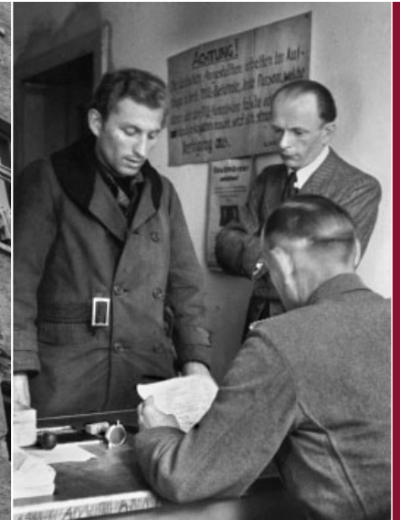
Registrierung der Flüchtlinge.