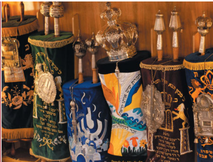
Thorarollen in der Dortmunder Synagoge.

Die Landesstelle ist dem neu geschaffenen Ministerium für Generationen, Familie, Frauen und Integration des Landes Nordrhein-Westfalen (MGFFI) zugeordnet.