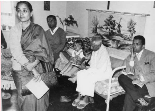
Eine indische Regierungsdelegation besichtigt 1962 das Modellager Unna-Massen.

Von der Öffentlichkeit besonders wahrgenommen werden in den 1970er Jahren die Chile-Flüchtlinge bzw. die Boat People und die Flüchtlinge aus dem Balkan in den 1990ern.