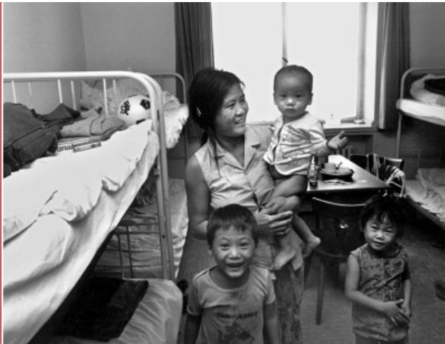
Vietnamesin mit Kindern in der Außenstelle Bergkamen-Oberaden 1979

Im Frühjahr 1979 gründet der deutsche Journalist Rupert Neudeck zusammen mit Schriftstellern wie Heinrich Böll in Troisdorf bei Köln das private Hilfskomitee „Ein Schiff für Vietnam“. Sie möchten, nach dem Vorbild eines französischen Hilfsschiffes, dem Sterben im Chinesischen Meer ein Ende machen. Die deutsche Bevölkerung lässt sich vom