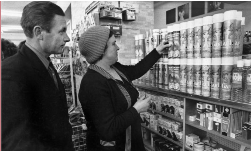
Von allem sovjet – ein Aussiedlerpaar staunt über das Warenangebot in einem Massener Geschäft.

Begleitheft zu einer Tagung des Steinbacher Kreises in Waldbröl 1965. Faltblatt des Deutschen Roten Kreuzes, herausgegeben 1989.