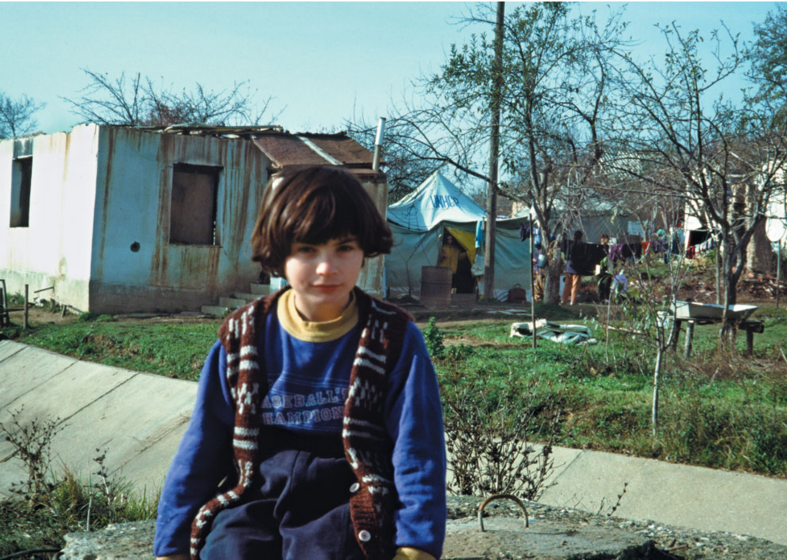
Zurück aus Unna im Kosovo. Im Hintergrund das ausgebrannte Haus. Die Familie lebt in dem blauen Flüchtlingszelt, eine Spende des UNHCR. Die Caritas aus der Landesstelle liefert per LKW den Hausrat aus Spenden.