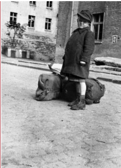
Ankunft am Wellersberg.

„Swallowtransporte. Unter diesem Namen liefen die traurigsten Bewegungen von Ost nach West. In wenigen Stunden und mit dürftigstem Gepäck mußten Menschen ihre Heimat verlassen und trafen, in Güterzüge gesperrt, von Miliz gefilzt und gepeinigt, erst nach vielen Tagen in Siegen ein. Verschmutzt, verlaust, ausgehungert.“