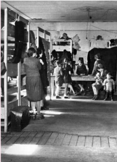
Dreistöckige Holzbetten in den Unterkünten.

Die Konflikte in und um das Durchgangslager am Wellersberg bewegen das nordrhein-westfälische Sozialministerium 1951 dazu, in Unna-Massen mit einem neuen Konzept Flüchtlingsbetreuung zu organisieren.