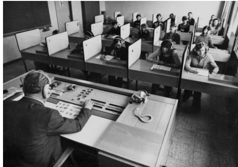
1950er Jahre: Umzug der Kinder des Durchgangwohnheims vorbei an der katholischen Kirche. Die Ladenzeile in der Lippestraße. Das Behelfskrankenhaus, für das zwei Ärzte angestellt sind. 1970er Jahre: Das Sprachlabor der Gerhart-Hauptmann-Schule.