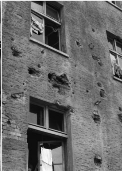
Vom Krieg gezeichnet. Kasernen-Gebäude am Wellersberg.