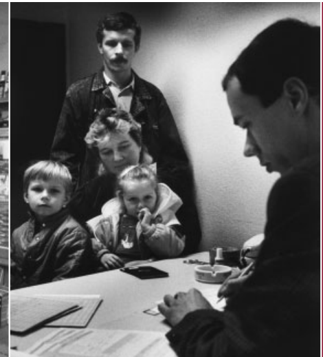
Beratung einer Aussiedlerfamilie.