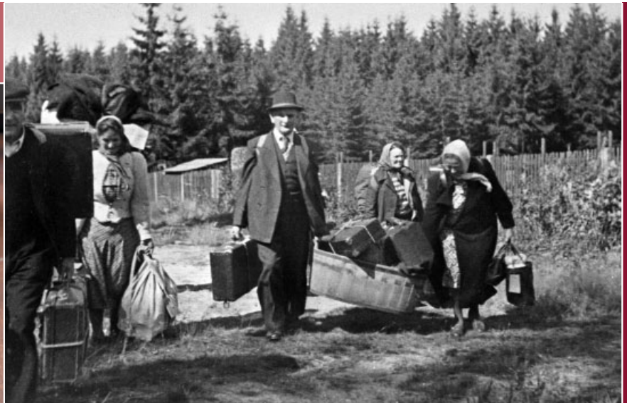
Über die „Grüne Grenze“ aus der Sowjetischen Besatzungszone, Ende 1940er Jahre.