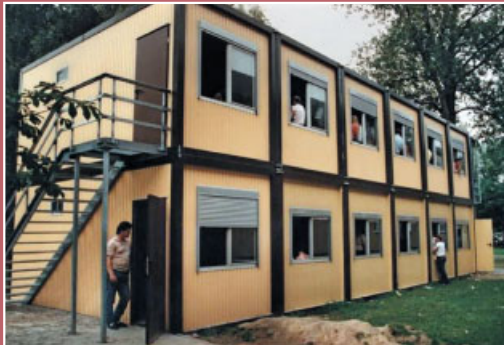
Container auf dem Gelände der Landesstelle, 1990er Jahre.

Die Landesstelle Unna-Massen nimmt im Zeitraum von 1976 bis 2007 insgesamt 539.382 Spätaussiedler aus der ehemaligen Sowjetunion auf. Darunter vor allem Familienverbände mit vielen jungen Menschen.