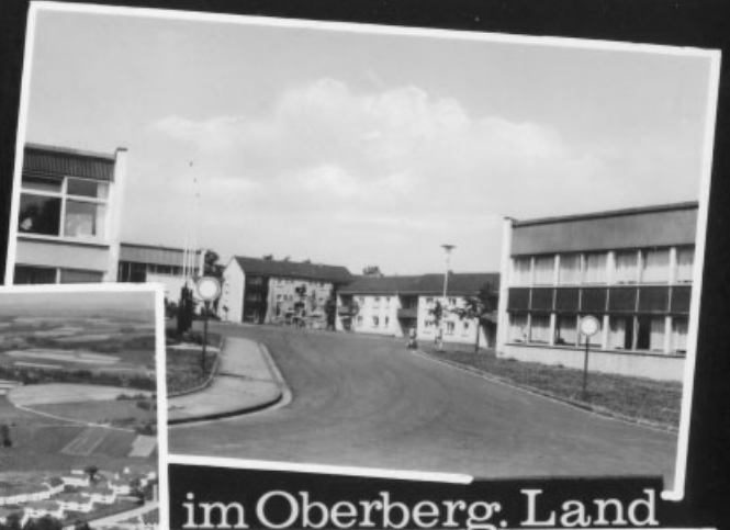
im Oberberg. Land