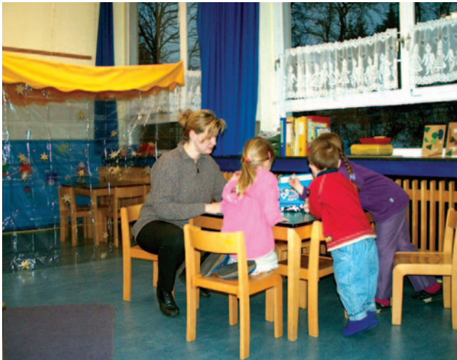
Die Benutzung von kindgerechten Möbeln führt zu Zwangshaltungen