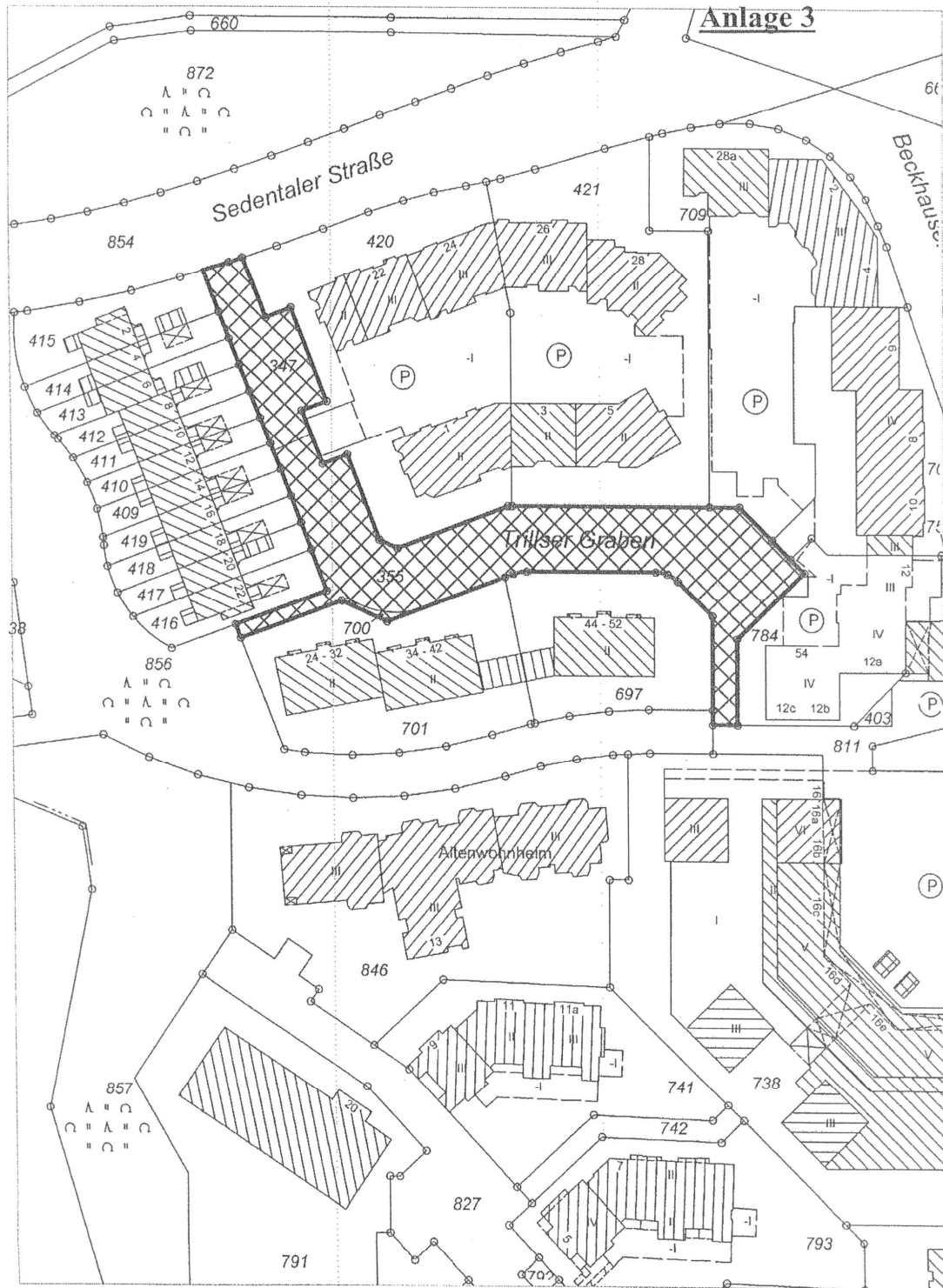
Trillser Graben: Widmung entsprechend Bebauungsplan