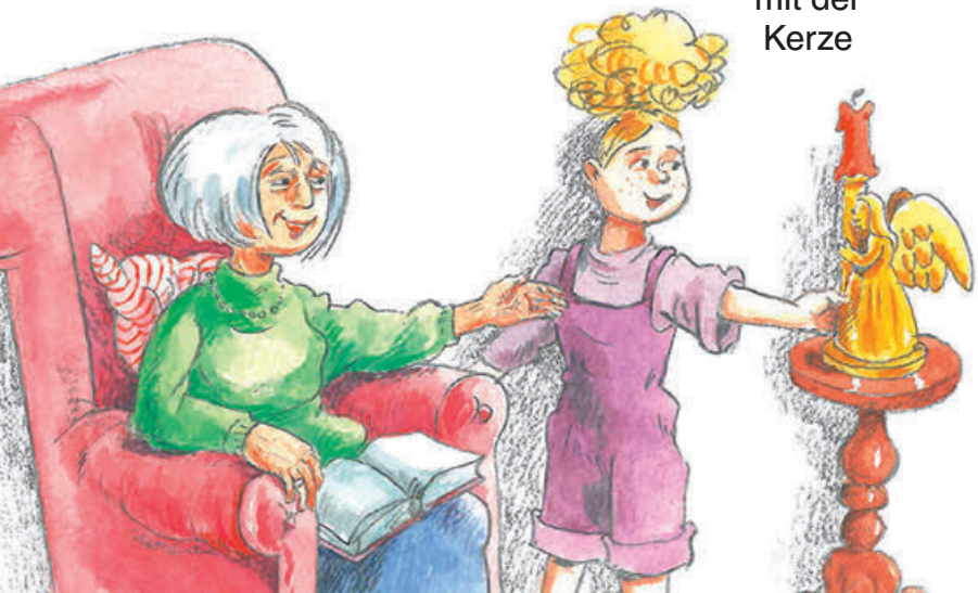
Der Engel mit der Kerze