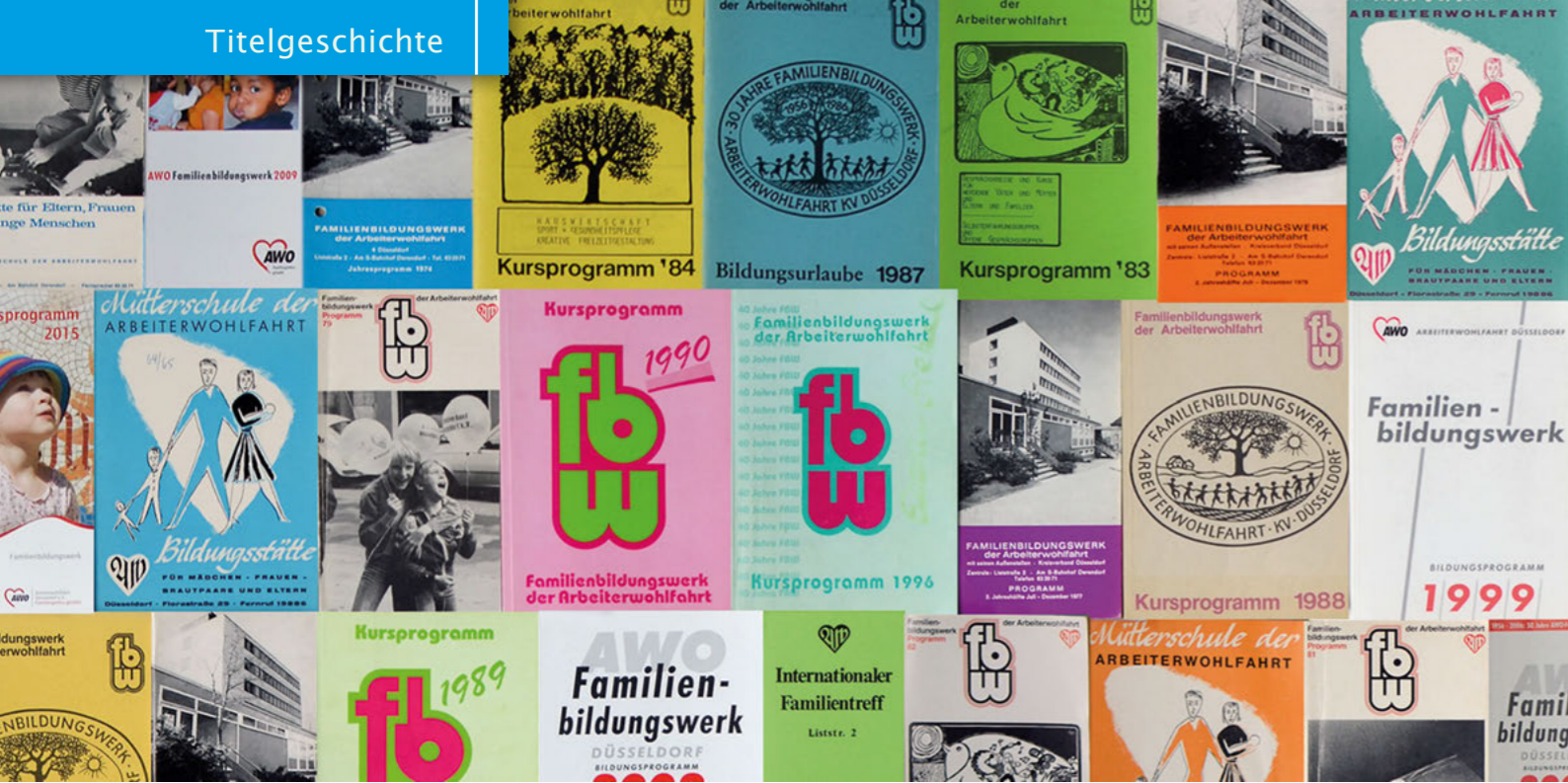
Auch das Design hat sich im Laufe der Jahrzehnte gewandelt: Eine Auswahl von „historischen“ Plakaten und Programmtiteln des Familienbildungswerkes.