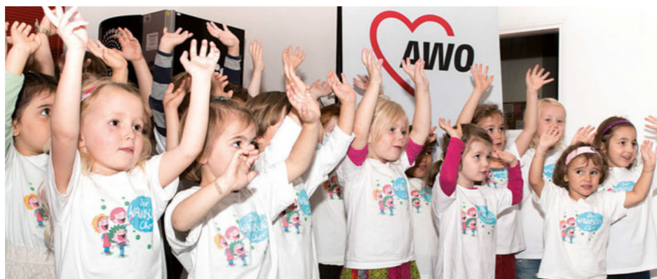
Hier intonieren die Kleinen das „Düsseldorf-Lied“. Mit ihrem Auftritt begeisterten die Kinder der Kita „Die Wawuschels“ und sangen sich in die Herzen der Gäste.

erfolgreichen Beispielen in der 60-jährigen Geschichte des FBW: Bereits in den 80er Jahren stärkte das FBW die Vereinbarkeit von Familie und Beruf durch erste Spielgruppen für Kinder ab drei Jahren, entwickelte 2009 das Programm der Sprachpartnerinnen und -partner für Menschen mit Migrationshintergrund, bot bereits im Jahr 2014 erste Orientierungsangebote und Sprachkurse für Geflüchtete an und weitete seine Angebote in 2015 auf fast 20 Sprachkurse aus. Heute ist es eine der führenden