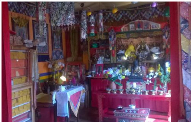
Meditationsraum im Buddhistischen Zentrum

Eine Bewirtung mit Kaffee und Kuchen auf der Terrasse des Bauernhauses bildete den Abschluss der denkwürdigen Begegnung.