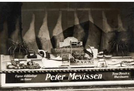
Schaufenster mit Neujahrsgrüßen, in den 1920er Jahren