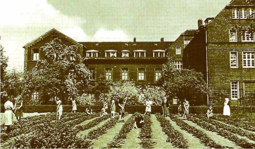
Pflege einer Erdbeerplantage

Eine Tätigkeit im Garten an der frischen Luft dagegen war beliebt und galt als Vertrauensbeweis. Bei allen Tätigkeiten wurde absoluter Gehorsam erwartet. Wer beim Arbeiten, beim Essen oder beim Spaziergang redete, wurde bestraft, z.B. mit der Ausführung besonders unangenehmer Aufgaben. Vom kleinen Taschengeld konnte man sich etwas am heimeigenen Kiosk kaufen, bei Verfehlungen jeder Art wurden jeweils 10 Pfennig abgezogen.