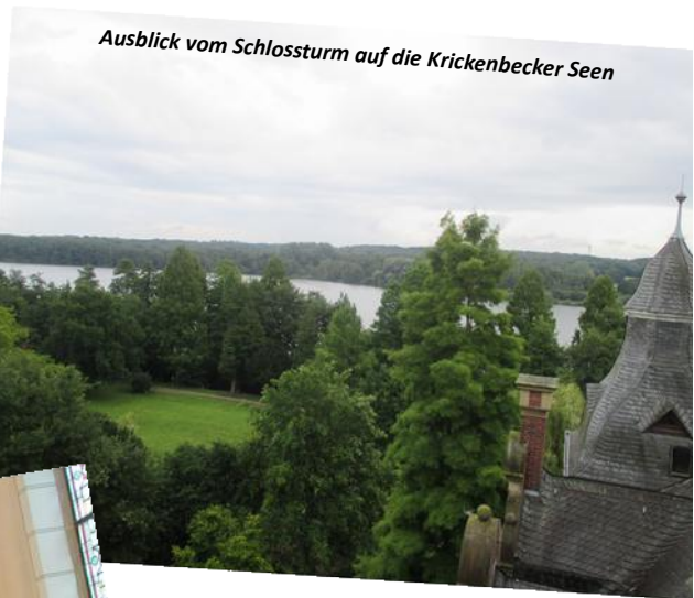
Ausblick vom Schlossturm auf die Krickenbecker Seen