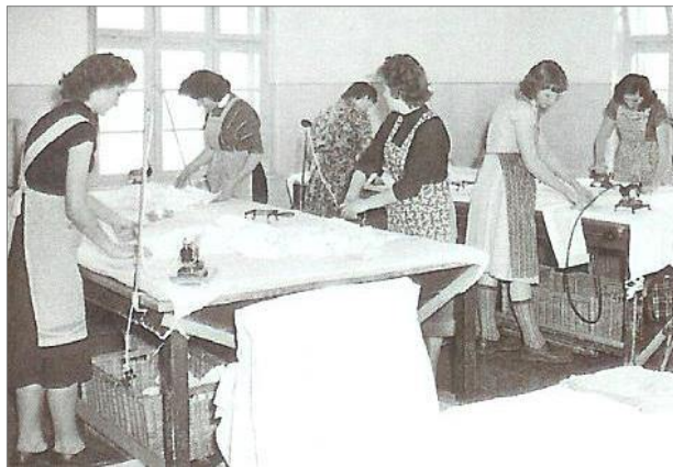
Mädchen beim Bügeln, 1950er Jahre

Es folgten Frühstück und Andacht. Gearbeitet wurde vormittags und nachmittags immer unter strenger Aufsicht u. a. in der Wäscherei, in der Nähstube oder in der Küche. Besonders anstrengend war das Bügeln und Mangeln, weil die Mädchen stundenlang an Bügelbrettern oder Maschinen stehen mussten. 2