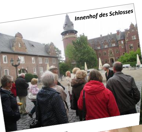
Innenhof des Schlosses