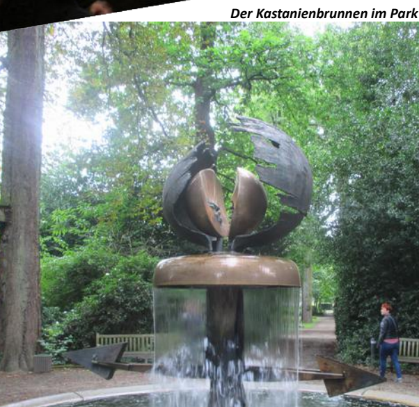
Der Kastanienbrunnen im Park