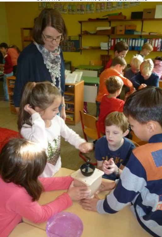
Schülerinnen und Schüler beim Mehlmalen mit einer Metallmühle