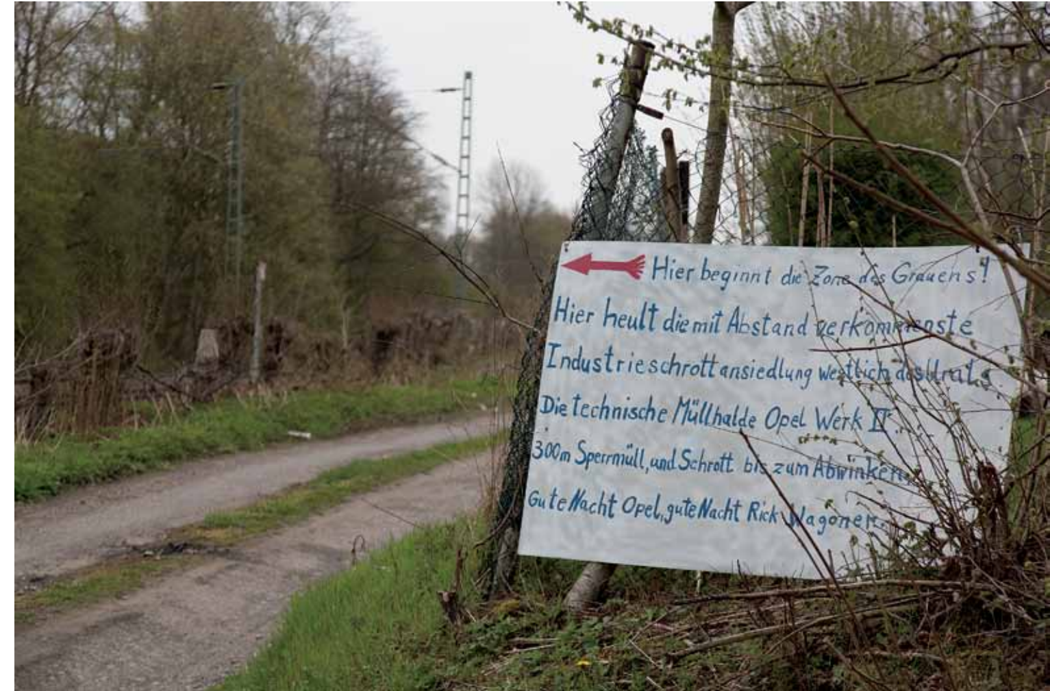
Bilder diese Seite: Oesterheidestraße