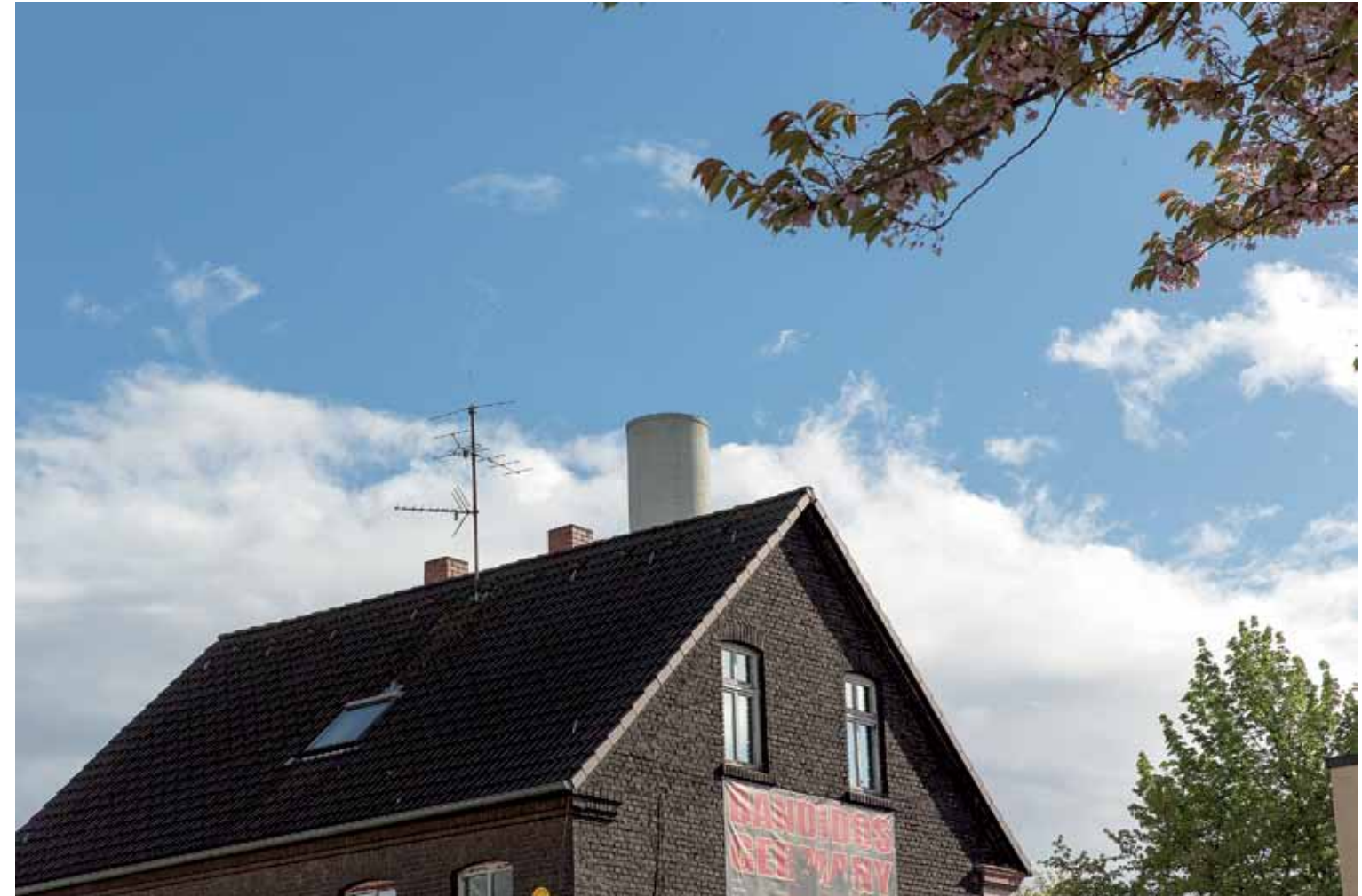
Bild linke Seite links: Alte Wittener Straße Bild linke Seite rechts: Gerlach-von Heven-Weg