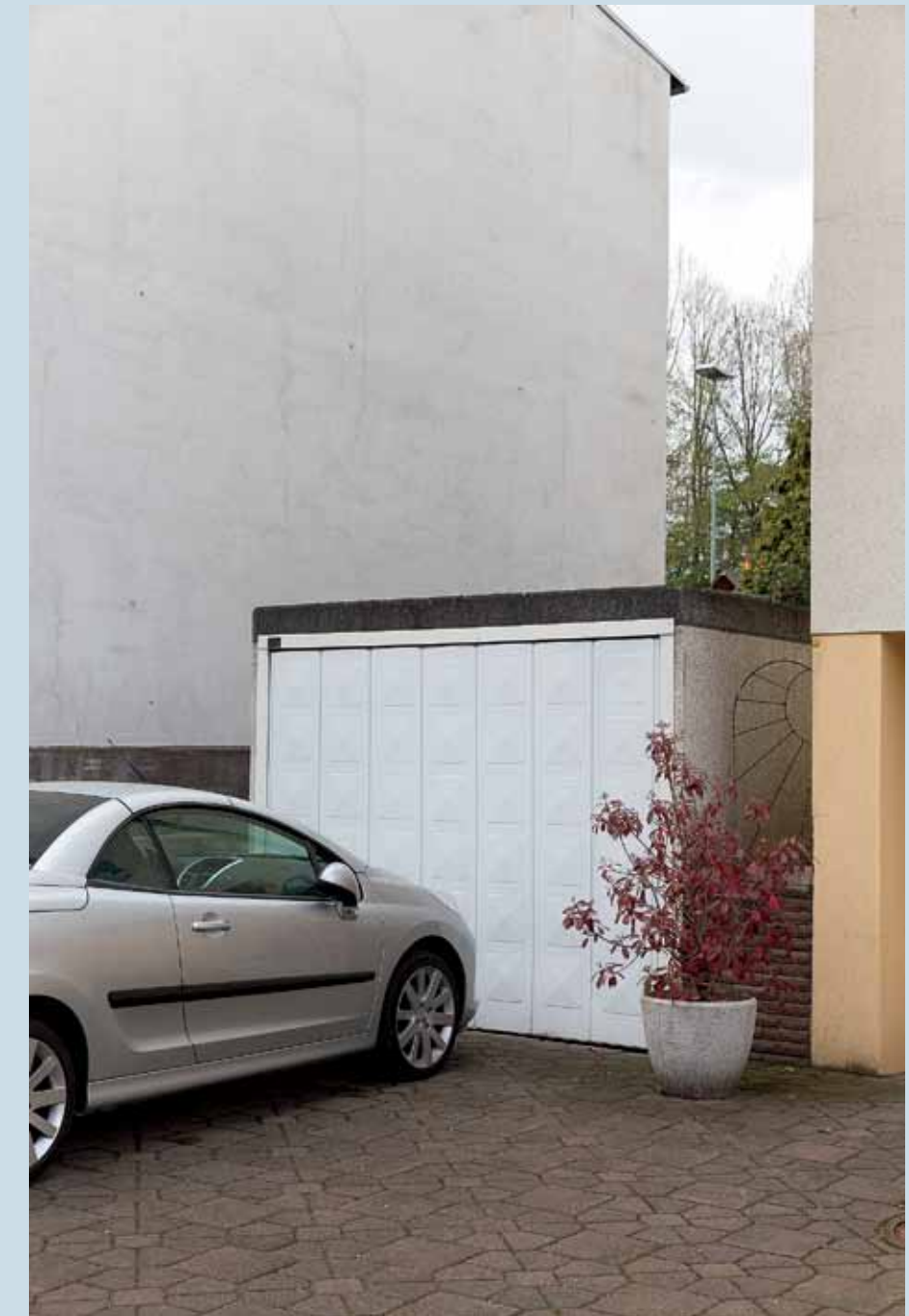
Alle Bilder diese Seite: Laerfeldstraße