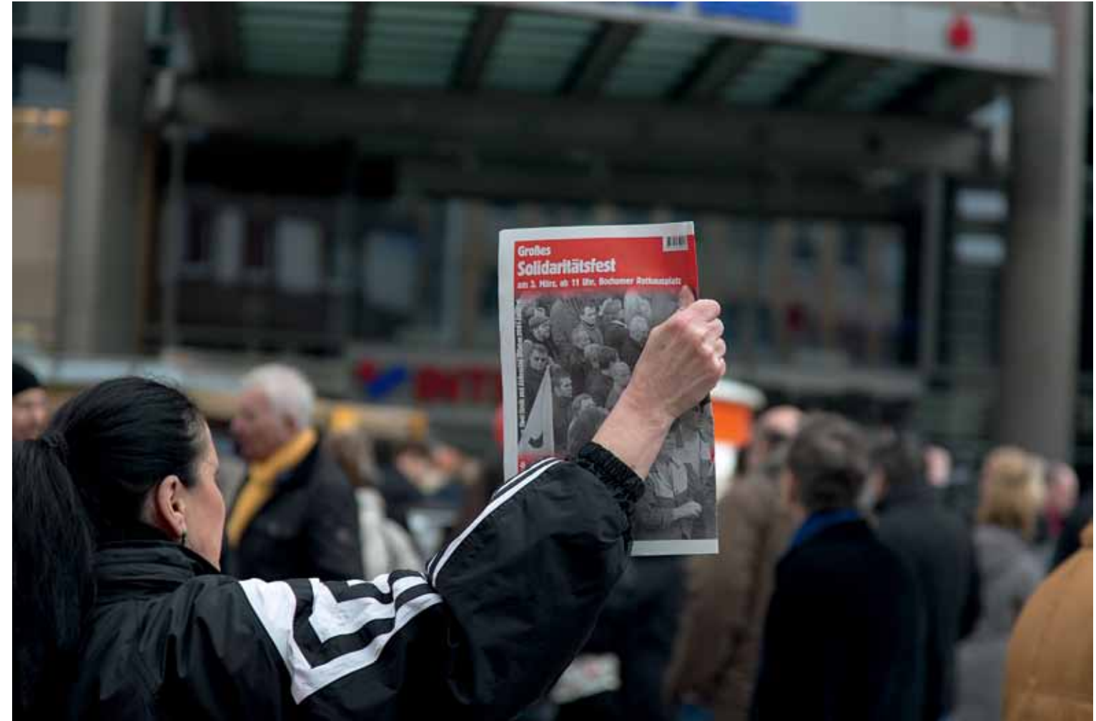
Alle Bilder diese Seite: Bongardstraße