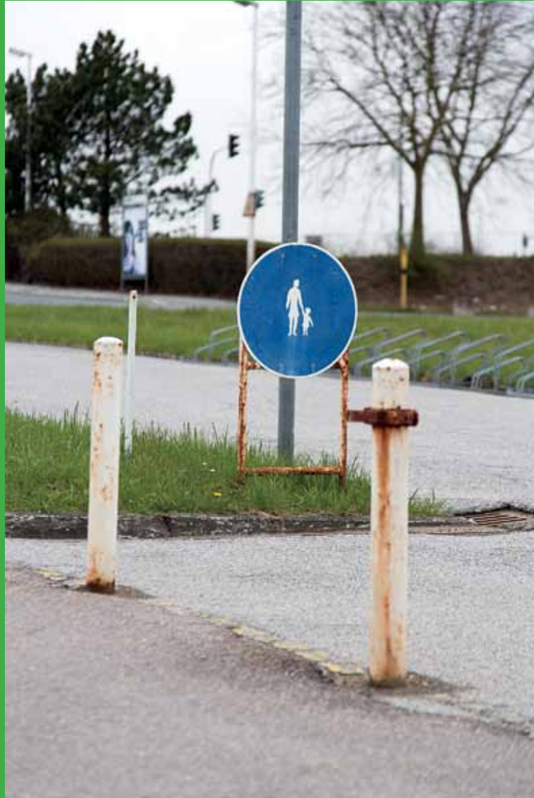
Alle Bilder vorherige Seite: Bongardstraße