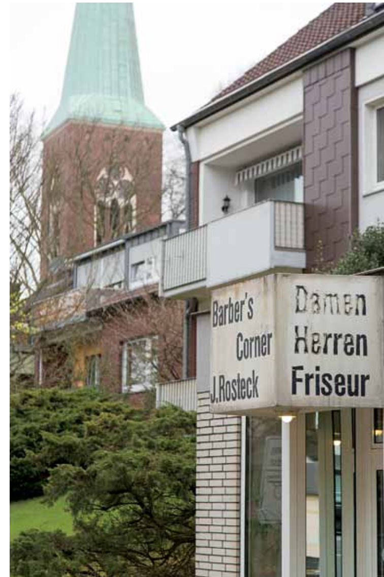
Bild rechte Seite links: Am Heerbusch Bild rechte Seite rechts: Schachtstraße