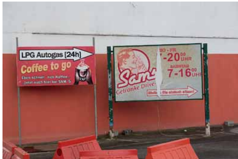
Bilder links: Wittener Straße Bild rechts: Hans-Ehrenberg-Platz