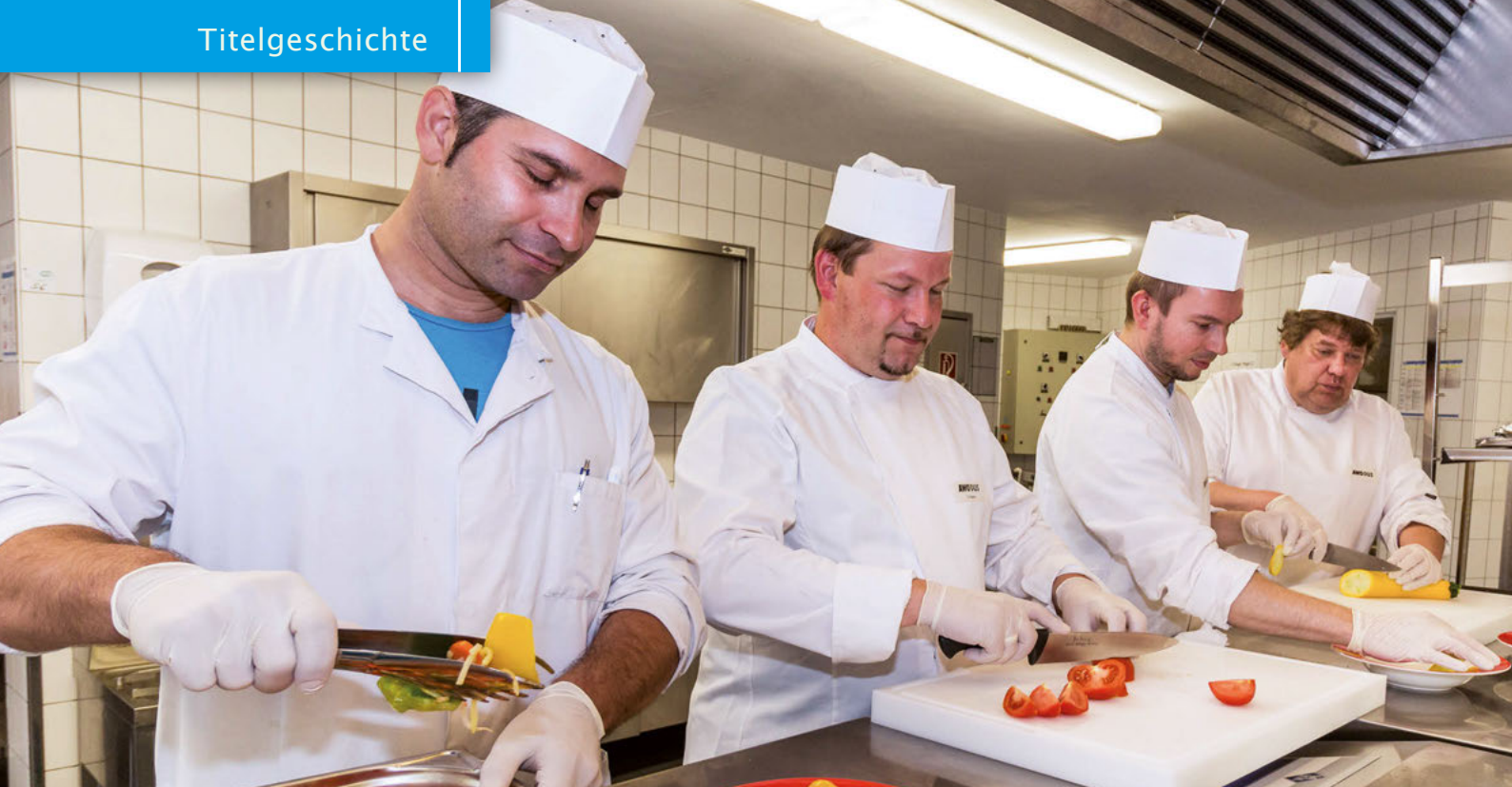
Das Küchenteam der AWO.DUS ist gut aufeinander eingespielt.