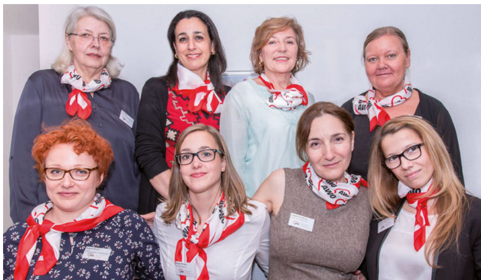
Fast komplett im Bild: das Team des neuen Beratungszentrums.

Im Beisein zahlreicher Gäste aus Politik, Verwaltung und anderen Wohlfahrtsverbänden wurde nun