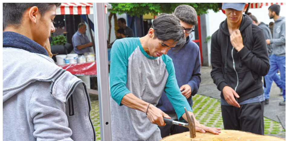
Beim Nägeleinschlagen waren Kraft, Geschick und Zielsicherheit gefragt.