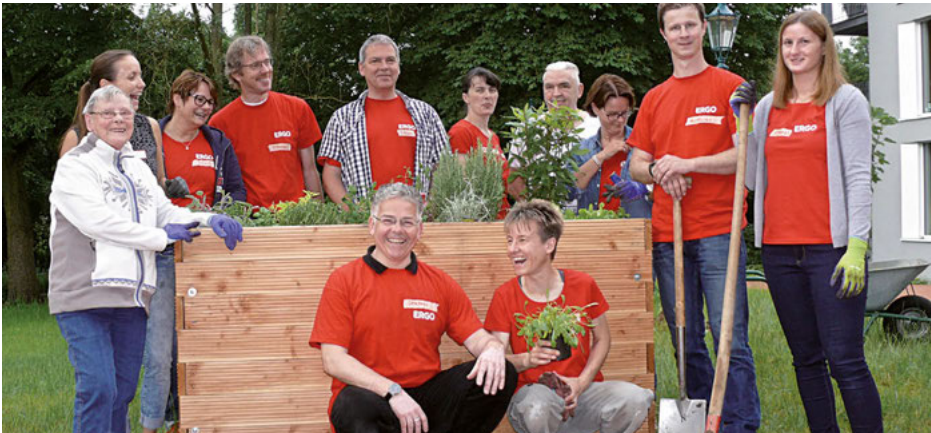
Mitarbeiterinnen und Mitarbeiter der ERGO Group sind stolz auf das Kräuterhochbeet, das sie im Außengelände des Lore-Agnes-Hauses anlegten.

„Social Days“ haben sich in vielen Unternehmen etabliert. Sie investieren Ideen, Zeit und Geld und verwirklichen Projekte zur Unterstützung sozialer Einrichtungen. Davon profitieren Kitas und Senioreneinrichtungen ebenso wie die Unternehmen und ihre Mitarbeitenden: Der Blick über den Teller rand dient auch der Personal- und Teamentwicklung sowie der Imagepflege. Diese Win-Win-Situation ist auch für die AWO Düsseldorf ein Glücksfall, unser Dank gilt daher allen Beteiligten.