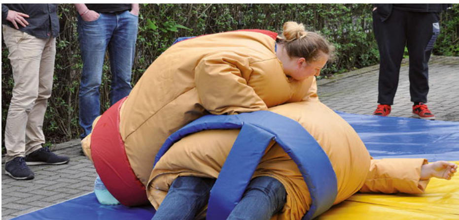
Besonders großer Andrang herrschte beim Sumo-Wrestling.

BBZ-Sommerfest bildete Abschluss der AWO-Aktionswoche