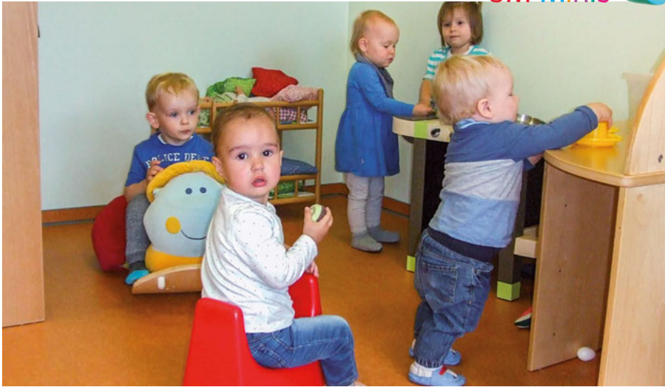
Auch sie fühlen sich bei der AWO.DUS gut aufgehoben: 18 Kindern zwischen vier Monaten und drei Jahren bietet die von der AWO.DUS getragene Kita „3M Minis“ in Neuss qualifizierte Betreuung.

Darüber hinaus beraten sie bei Fragen zur Organisation von Elternzeit, Rückkehr an den Arbeitsplatz und zur passenden Kinderbetreuung. Bei Bedarf finden diese Beratungen auch auf Englisch statt.