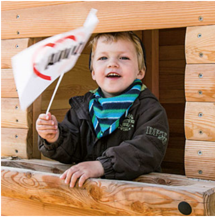
Auch bei den Kleinen kommt die neue Kita gut an.

AWO Familienglobus gGmbH eröffnet 22. Kita