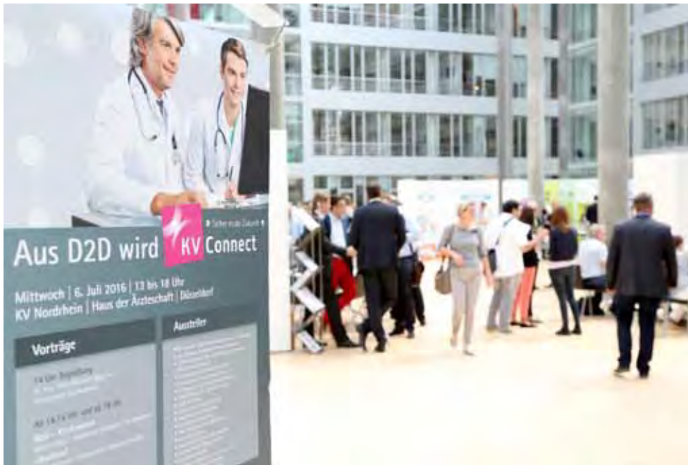
Die KVNO informierte Anfang Juli zusammen mit Anbietern von Praxissoftware über die Möglichkeiten von KV-Connect.

beim Umstieg auf KV-Connect. Dazu gehört zum Beispiel die Übermittlung von Labordaten oder die Abrechnung mit Privatärztlichen Verrechnungsstellen, die im KV-Connect-Portfolio enthalten sind. Auf der Veranstaltung zeigten Softwarehäuser, welche Anwendungen sie den Praxen bieten. Neben ihrer IT-Beratung bot die KV Nordrhein die Möglichkeit zur Registrierung für KV-Connect; mehr als 50 Ärzte und Psychotherapeuten taten dies direkt vor Ort.